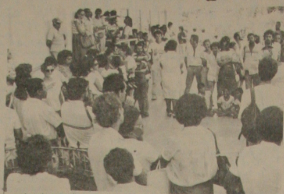
O movimento grevista conta com a adesão de 90 por cento dos Servidores.

Com um percentual de adesão de 90 por cento, os previdenciários de Sergipe finalmente aderiram ao movimento grevista da categoria. Último estado a aderir ao movimento iniciado no dia 17, Sergipe paralisou pacificamente suas atividades, sem a formação de piquetes e sem tumultos nas portas dos postos.