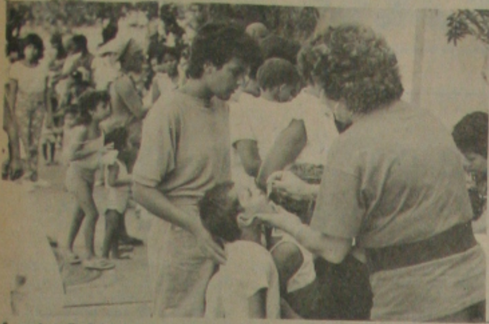
A vacinação foi iniciada às 8 horas da manhã.