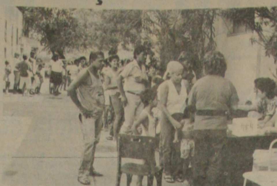
A Secretaria de Estado de Saúde contou com o apoio do INAMPS na campanha.

Teve início às 8 horas da manhã de ontem, os trabalhos para a vacinação contra poliomielite nas crianças dos bairros Siqueira Campos e Getúlio Vargas, estendendo-se por todo o dia, até o final da tarde.