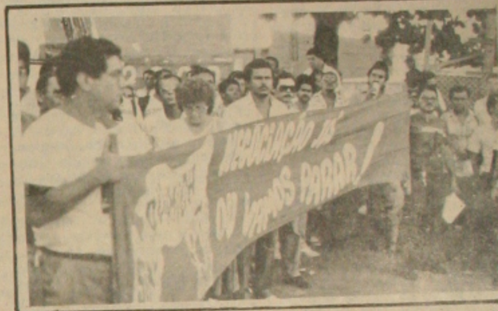
Funcionários fazem manifestação

Segundo o Secretário-Geral do Sindiquímica, José Vieira Aguiar a revolta maior dos trabalhadores da Petrobrás, é quanto as notícias falsas divulgadas pela empresa, afirmando que concedeu um reajuste salarial de 40 por cento, quando na verdade, o reajuste foi apenas de 27,45 por cento. Ele disse ainda que, pelo reajuste anunciado pela empresa, estão imbutidos os percentuais correspondentes às URPs de outubro e novembro, os quais já foram antecipados, dentro dos 40 por cento.