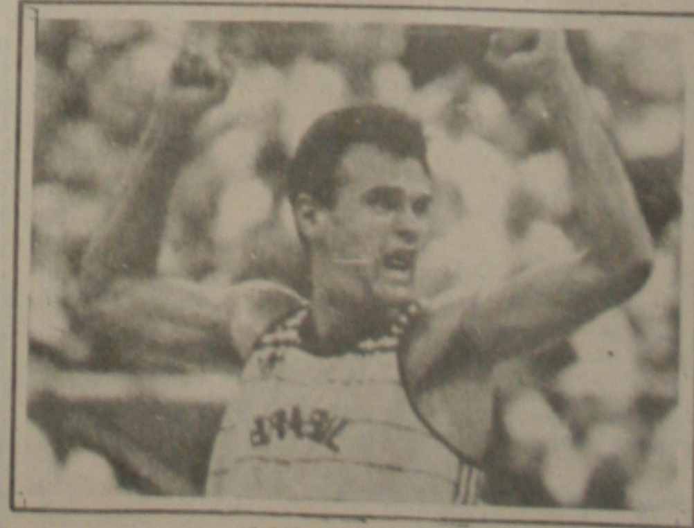
O GIGANTE OSCAR

A cerimônia de abertura está programada para às 8 horas, com as participações dos municípios de Cedro de São João, Amparo de São Francisco, Teinha, Malhada dos Bois e São Francisco. Haverá inicialmente o desfile das representações inscritas e em seguida o torneio início.