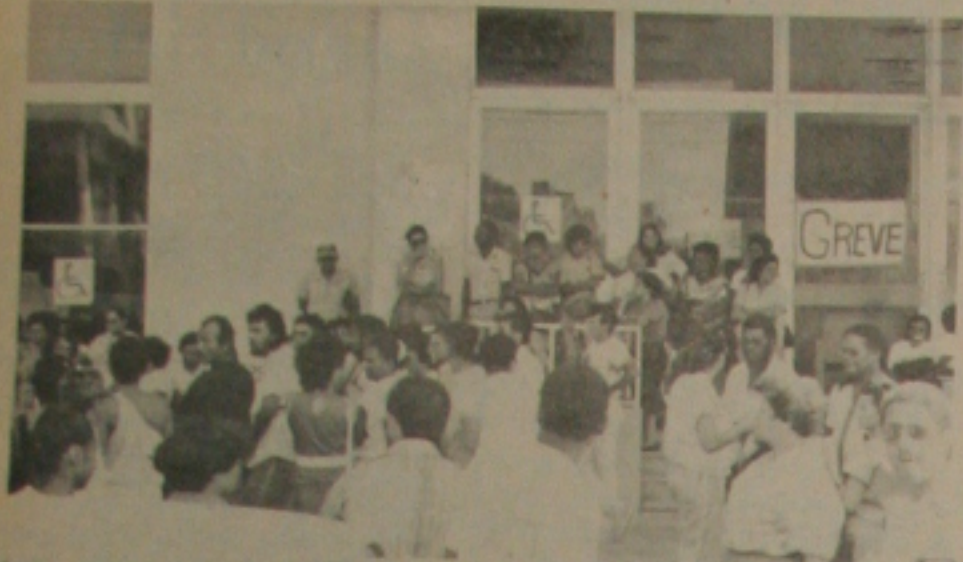
Os Previdenciários também entraram em greve no Estado de Sergipe e se concentram na sede do INAMPS.