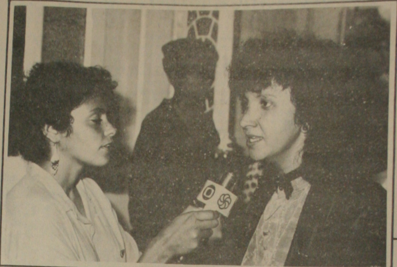
5ª FESTA DA AGRICULTURA