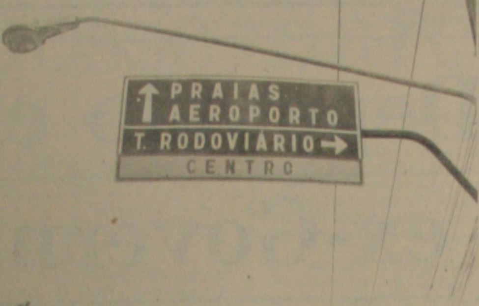
Aracaju vai ganhar nova sinalização informativa.

O presidente da EBTU - Empresa Brasileira de Transportes Urbanos, Telmo Magadan, está desembarcando no Aeroporto de Aracaju, às 11h30min, de hoje, sexta-feira, quando será recebido pelo prefeito Jackson Barreto e várias outras autoridades.