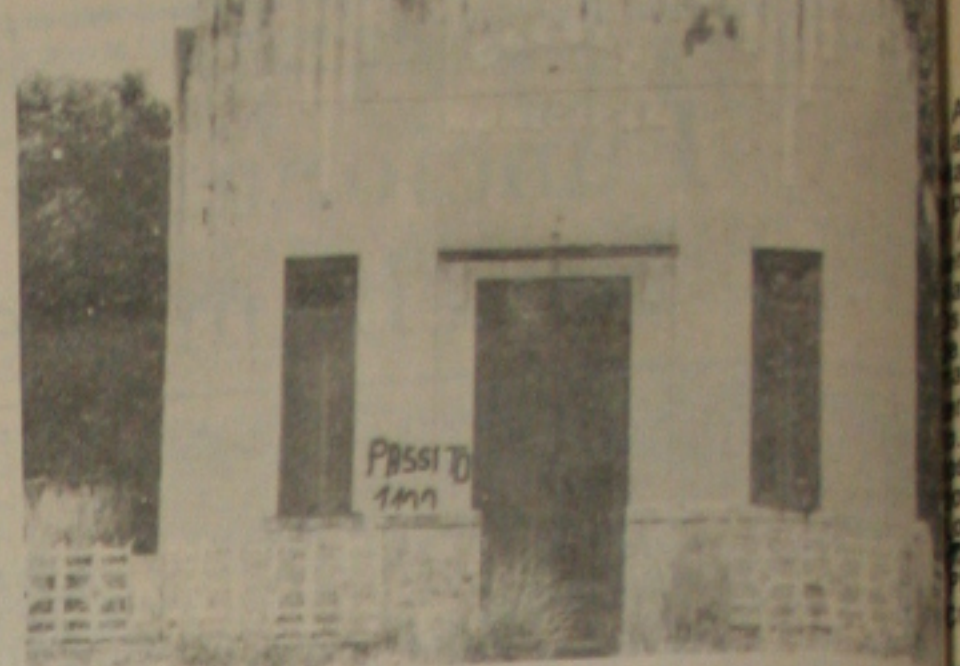
A escola da praça Princesa Isabel está neste estado.

O repórter fotográfico Manoel Bomfim, que vem realizando campanha eleitoral objetivando uma cadeira na Câmara Municipal nas eleições de 1988, visitou ontem a praça Princesa Isabel, a convite dos moradores e comerciantes daquela localidade que se encontram apreensivos face a existência de uma Escola na área que se encontra em total abandono, sem que as autoridades tomem uma providência no sentido de colocar o estabelecimento em funcionamento.