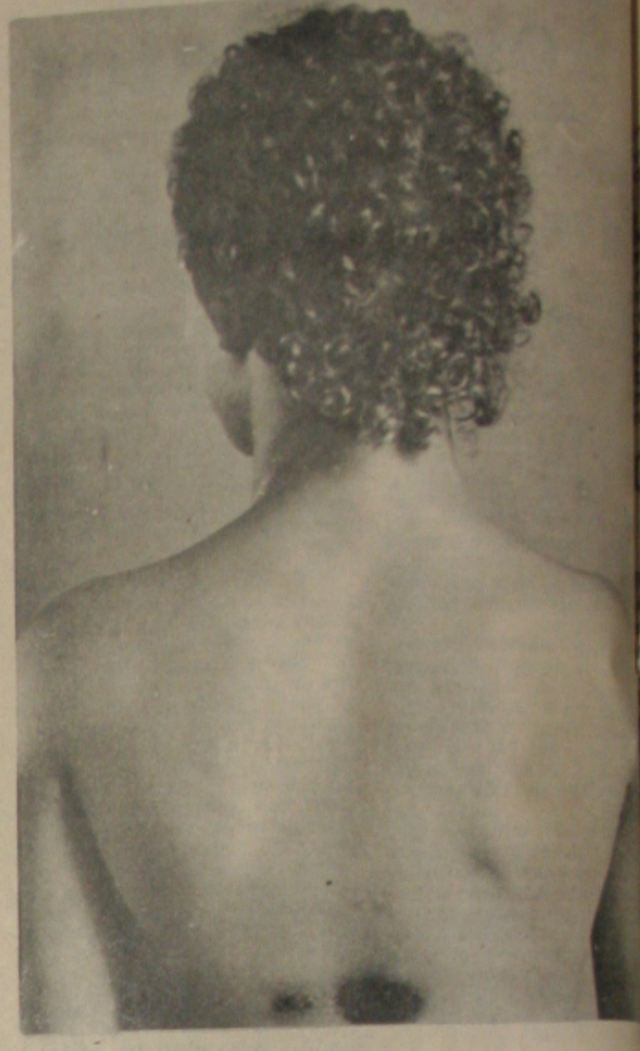
...Deixando várias lesões nas costas.