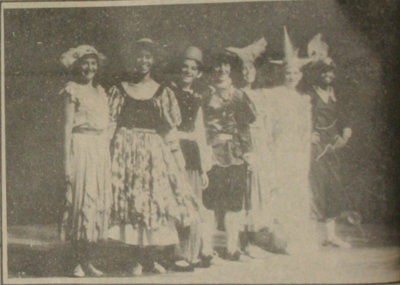
BRINCANDO COM ARTE

Em homenagem a Semana da Criança, a musical infantil terá o seu espaço nos dias 10, 11 e 12 deste mês, com sessão às 17:00 horas com o espetáculo O PRINCEPE FORMOSO, de Jorge Lins, músicas de Irineu Fontes e montagem do Grupo Raizes. O espetáculo será exibido no Teatro Atheneu.