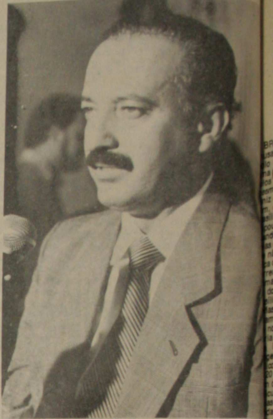
Clubes querem apoio do governador, para salvar o futebol sergipano.

Nos jogos extras-finais, a Emsetur derrotou na última terça-feira a equipe da Artese por dois a zero. Hoje, contra a mesma Artese, na segunda partida decisiva, a Emsetur só perderá o título de for derrotada por uma diferença de três gols, o que seus jogadores consideram uma façanha impossível para ser conquistada pelos adversários. "O chopp e o churrasco já estão programados, porque o título desse torneio é nosso" - proclama o técnico da Emsetur.