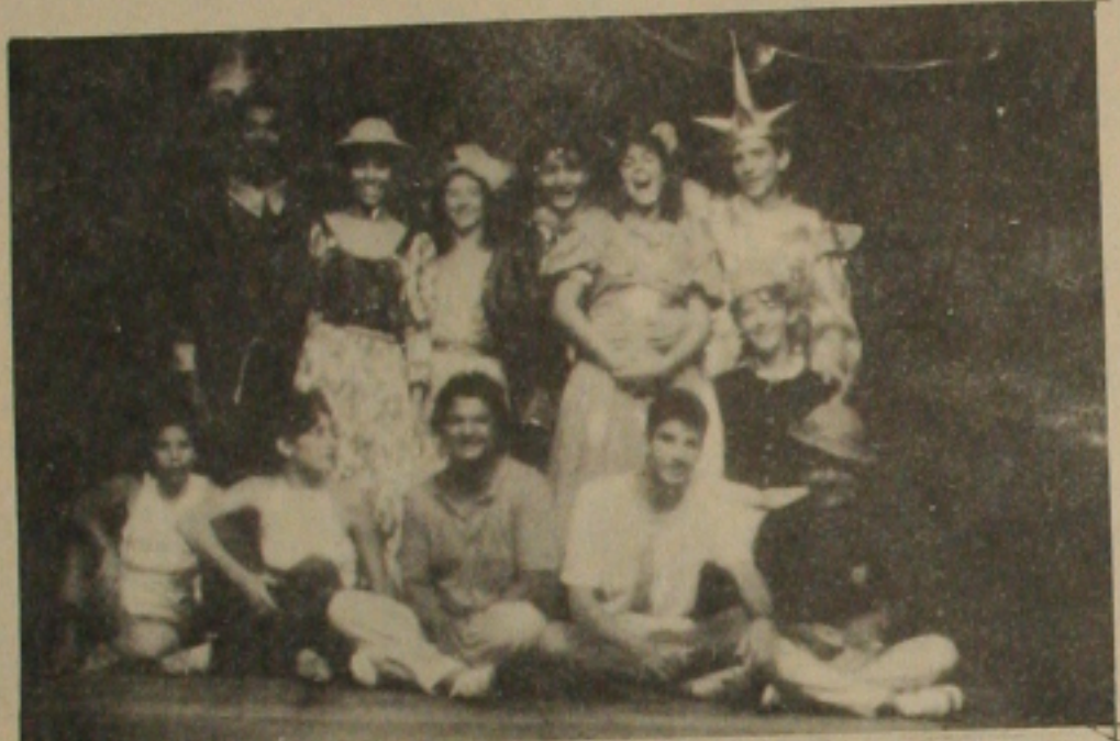
Grupo Raízes sempre para as crianças

Estréia no Teatro Atheneu dias 10, 11 e 12 de outubro com sessão às 17 horas, o musical infantil O PRÍNCIPE FORMOSOSO com texto de Jorge Lins, músicas de Irineu Fontes e montagem do Grupo Raízes.