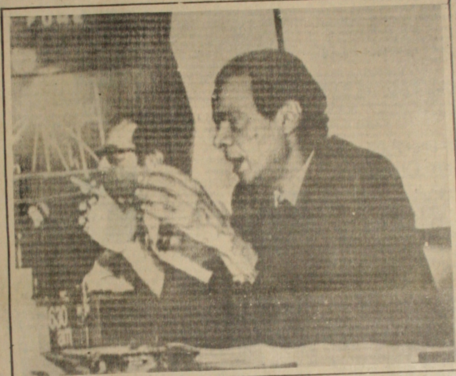
Rio - O Presidente da CNEN, Rex Nazareth, anuncia a descoberta de mais um foco de contaminação radioativa em Goiânia.

RIO, 13 (EBN) - O exame Aeroradiométrico realizado pela Comissão Nacional de Energia Nuclear sob a coordenação do doutor Paulo Marcos de Campos Barreto, do Instituto de Radioterapia e Dosimetria, detectou mais uma área contaminada pela radiação de Césio 137 em Goiânia. Trata-se de Vila Moraes, área próxima ao Aeroporto Golano, que já se acha isolada, a exemplo dos outros seis focos conhecidos anteriormente, e cuja dose de radiação é da ordem de um ponto três por hora. Voando devagar e baixo, a alturas entre 30 e 40 metros, a uma velocidade de 40 NOS, o que corresponde a 70 quilômetros por hora, o helicóptero da CNEN realizou o trabalho de "varredura" das áreas da zona urbana de Goiânia durante dois dias (sete e oito de outubro), cobrindo toda a Capital por setores, com distâncias de 100 a 200 metros entre as linhas de voo. O registro aeroradiométrico só acusou deflexão na zona anômala de Vila Moraes, não tendo o acidente contaminado as águas, alimentos ou pastos. A conclusão foi corroborada pelo Presidente da CNEN, Rex Nazareth Alves. A campanha de esclarecimento à população, em elaboração pela comissão, divulgada em detalhes, em todo o País, conforme informou o Rex Nazareth, toda a simbologia Internacional já existente, para que qualquer pessoa possa identificar um equipamento nuclear, mesmo aqueles que não sabem ler.