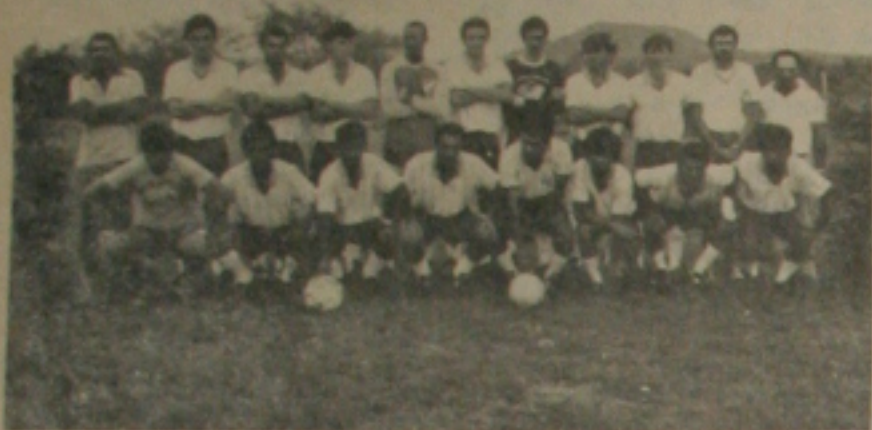
APARECIDA EM EVIDÊNCIA

O time de futebol do Esporte Clube Aparecida (foto), jogando no último domingo à tarde em seus domínios, venceu a equipe do