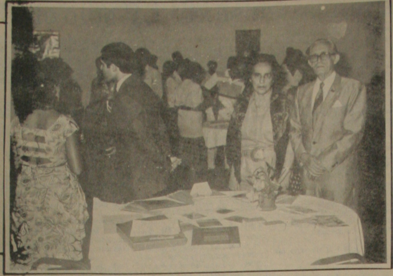
O Consul de Portugal juntamente com a esposa, se fizeram presentes nas comemorações da Semana Portuguesa, realizada do HPC.

técnicos estudarão todas as possibilidades de realizar vôos de Asa Delta pelo menos dois pontos do município: a Chapada do CUMBE e a DA TAQUARA. Isto significa ação turística com reflexos no Programa de Interiorização do Turismo.