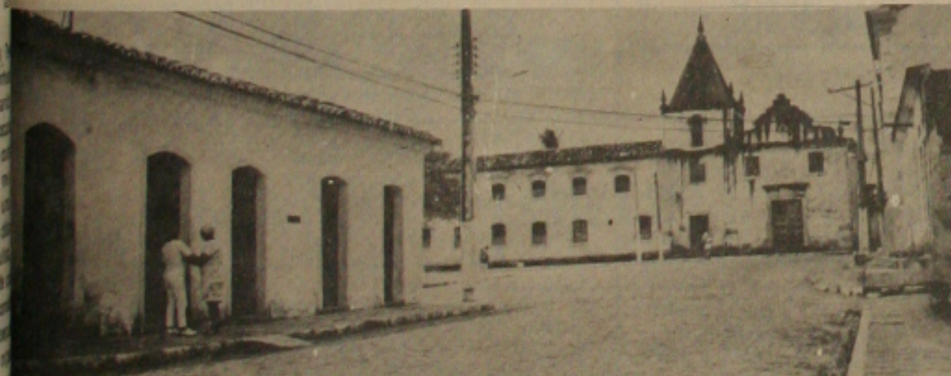
São Cristóvão, mais o pedaço do Histórico.

Texto: MILTON ALVES