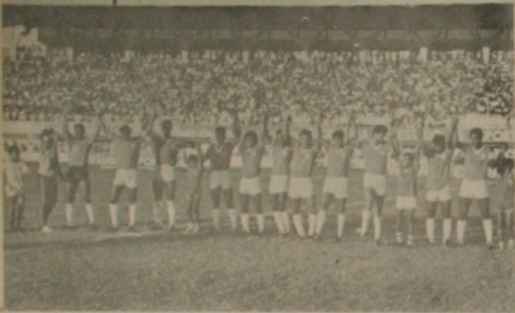
Sergipe com um novo time vai jogar no João Hora.

Na impossibilidade de poder jogar no domingo pela manhã no Batistão, os dirigentes do Sergipe conseguiram levar o jogo para o Estádio João Hora de Oliveira, no mesmo horário. Dessa forma o Sergipe além de voltar às atividades diante da sua torcida fará essa volta no seu estádio com possibilidade de conseguir um melhor resultado financeiro. A Federação aceitou o pedido do Sergipe e dessa forma, o jogo contra o Corinthians de Frei Paulo será no domingo pela manhã.