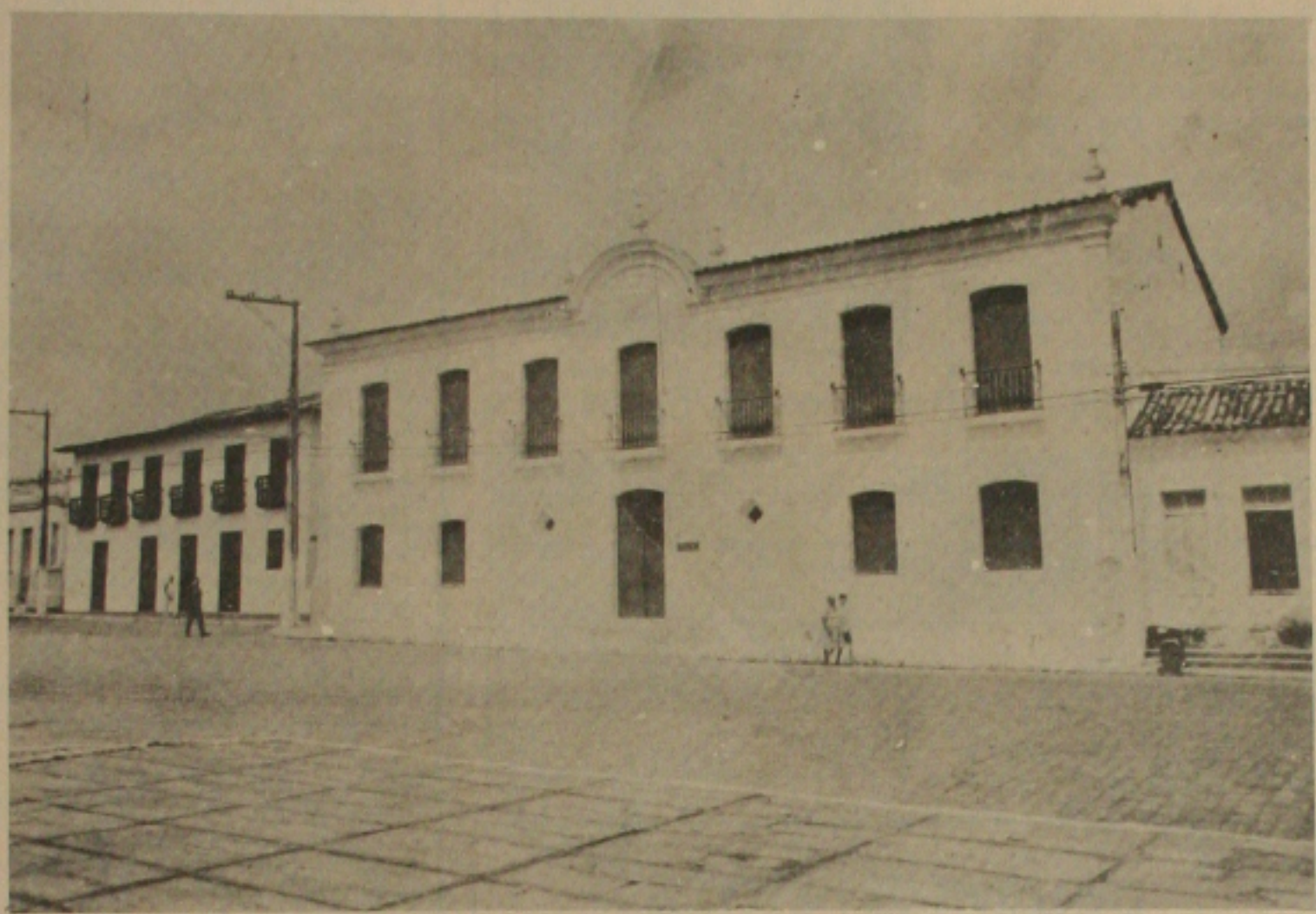
Museu de Sergipe bastante visitado durante os dias de realização do FASC.

Aracaju, 23 de outubro de 1987. A cidade de São Cristóvão, capital do Estado de Sergipe, está pronta para a abertura do VI Festival de Arte de São Cristóvão. O Festival, que ocorre anualmente, tem como objetivo promover a cultura local e nacional. Neste ano, o festival terá duração de 15 dias, com diversas atividades culturais, incluindo exposições, peças teatrais, música e dança. O festival é organizado pela Prefeitura Municipal de São Cristóvão, em parceria com o Conselho Estadual de Cultura de Sergipe.