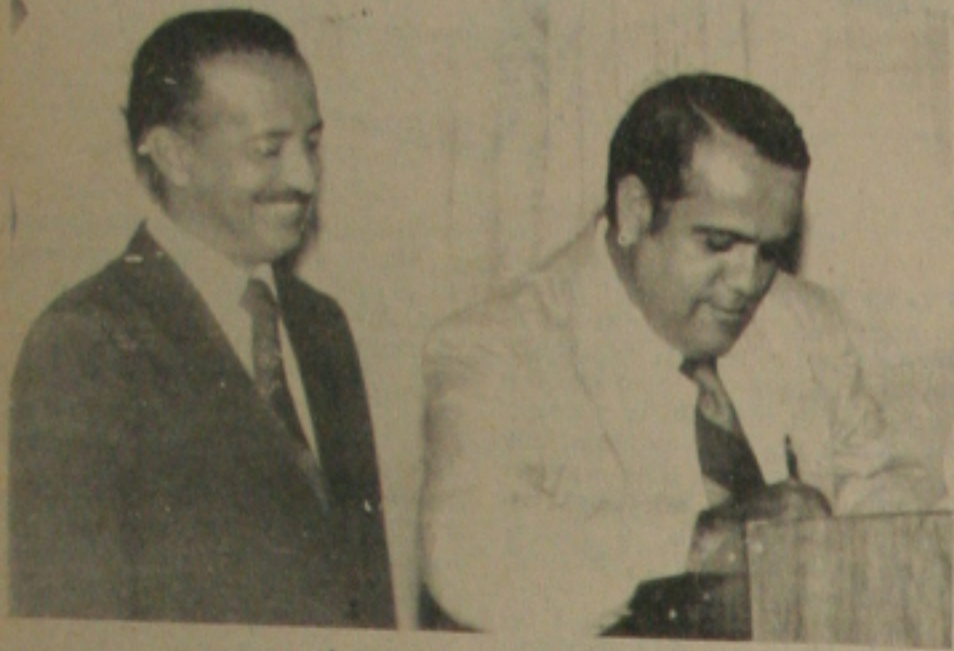
LEÃO FILHO TRABALHANDO

A Secretaria de Esporte e Lazer, está desenvolvendo um grande trabalho no esporte sergipano. No futebol profissional, a Secretaria de