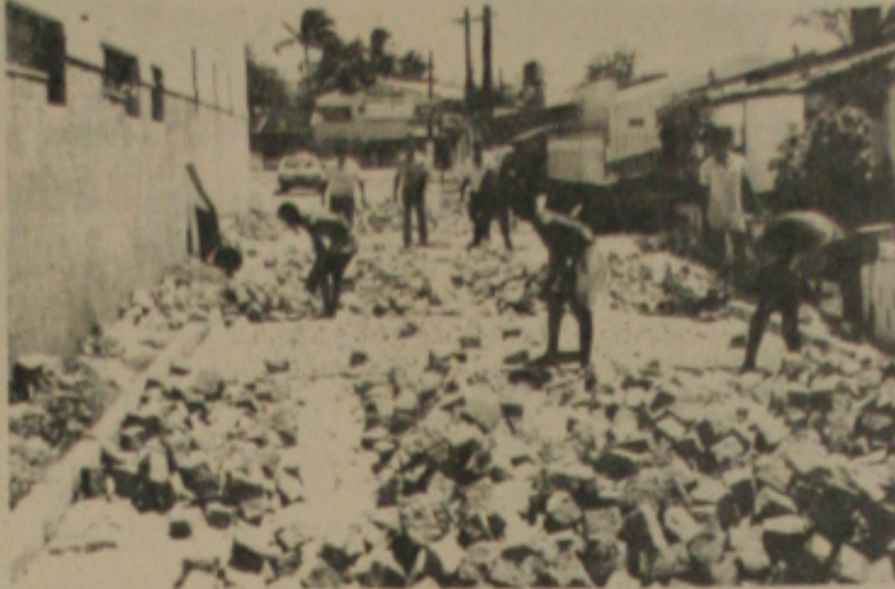
O Conjunto Castelo Branco será todo pavimentado.