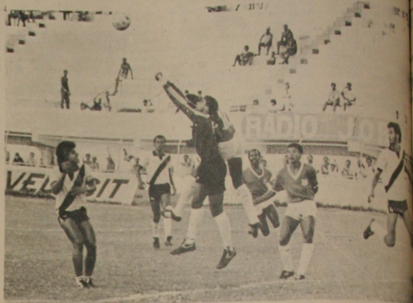
O Vasco goleou o Olímpico de Itabalaninha por 4x0