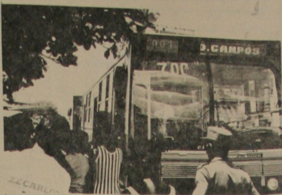
O novo aumento da tarifa dos ônibus de Aracaju recebe muitas críticas.