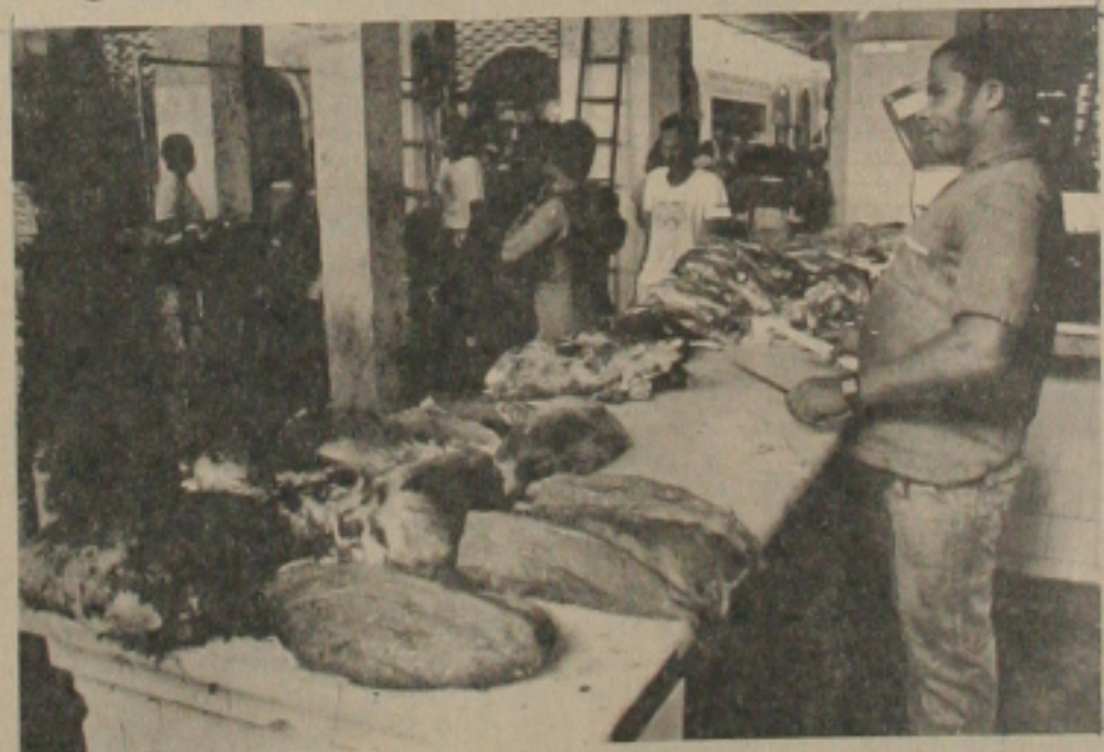
A carne bóia nas bancas.