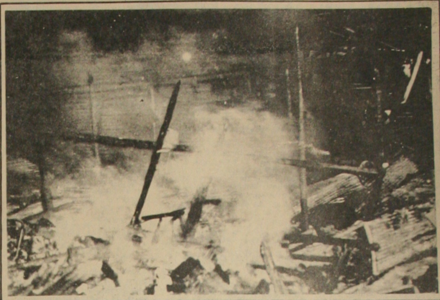
...foram debeladas, mas o mercado de artesanato foi praticamente destruído.