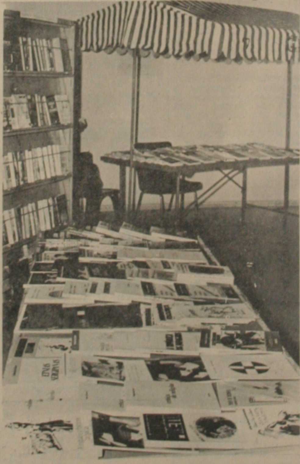
A feira reúne livros de vários autores sergipanos.