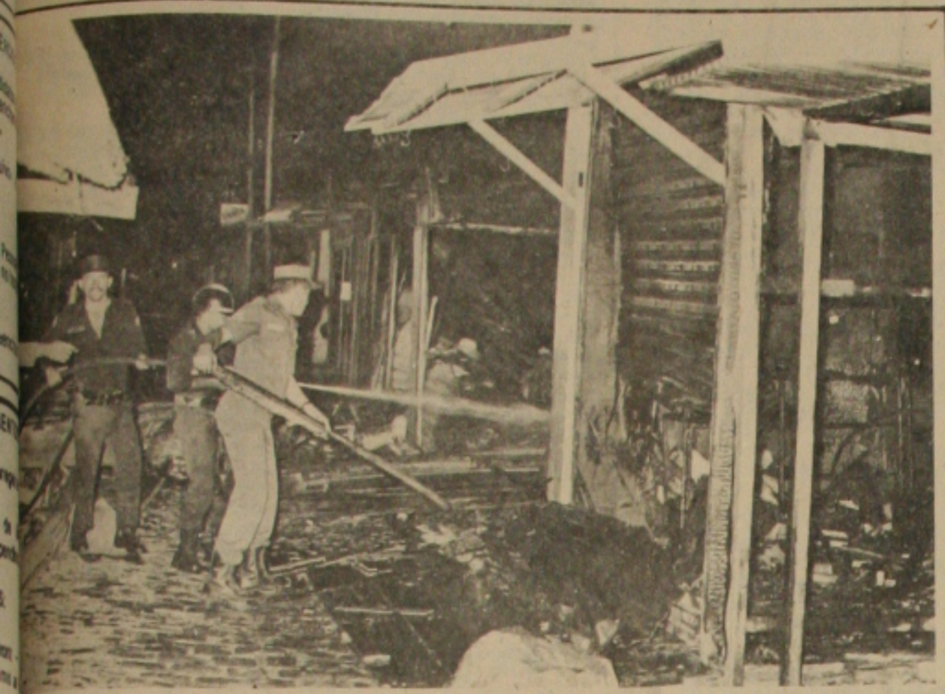
Apesar da ação do Corpo de Bombeiros, as chamas ...