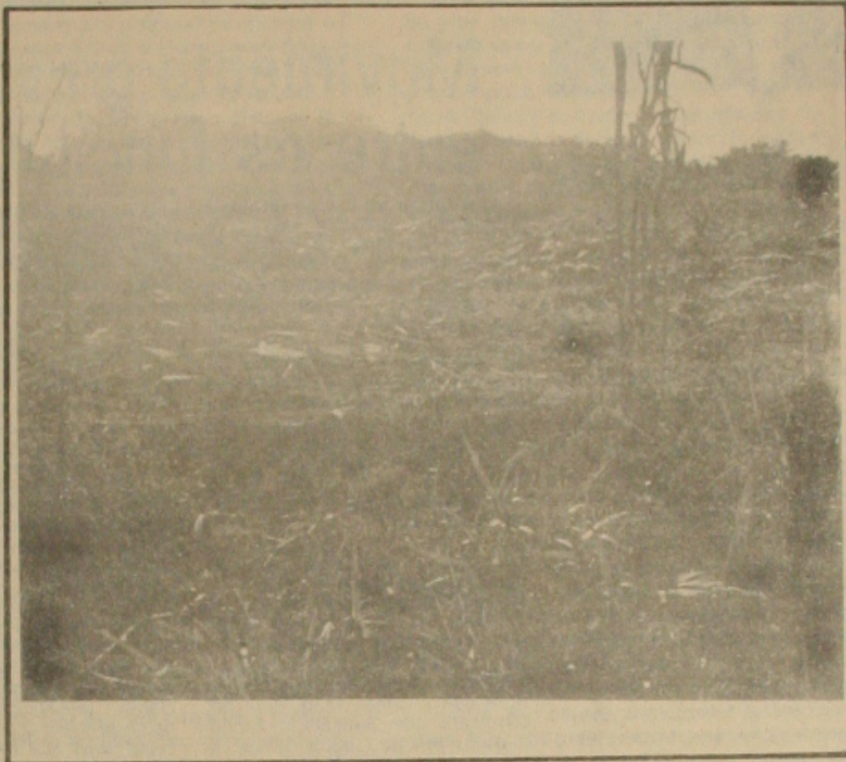
Abandonada, com terreno sendo invadido pelo mato, mas líder do Governo nega os fatos. Hoje somente os vestígios de um antigo prédio escolar em Boquim, no total abandono.