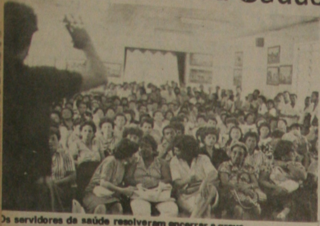
Os servidores da saúde resolveram encerrar a greve.