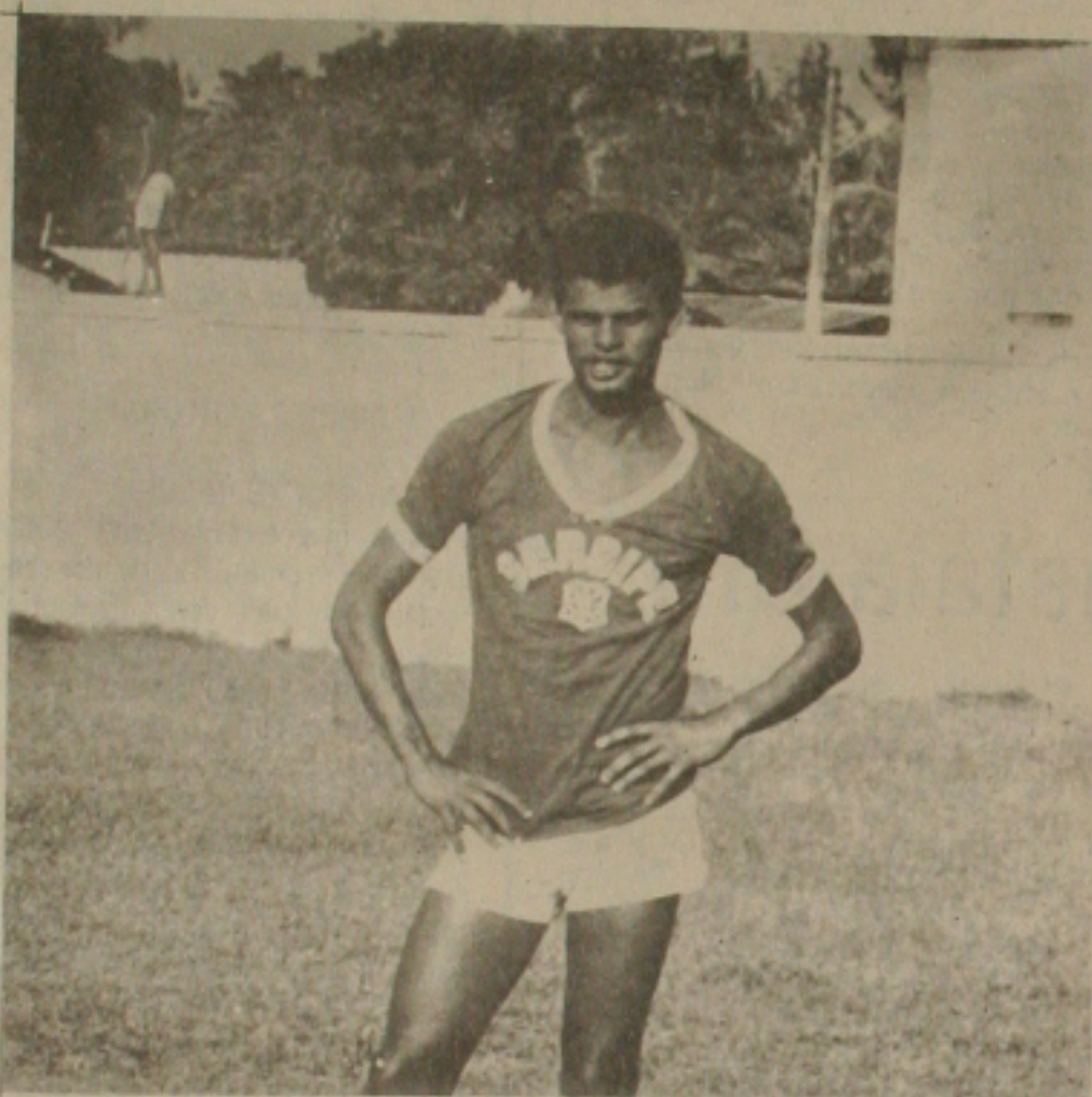
Rivaldo deve ser vendido ao Bahia.