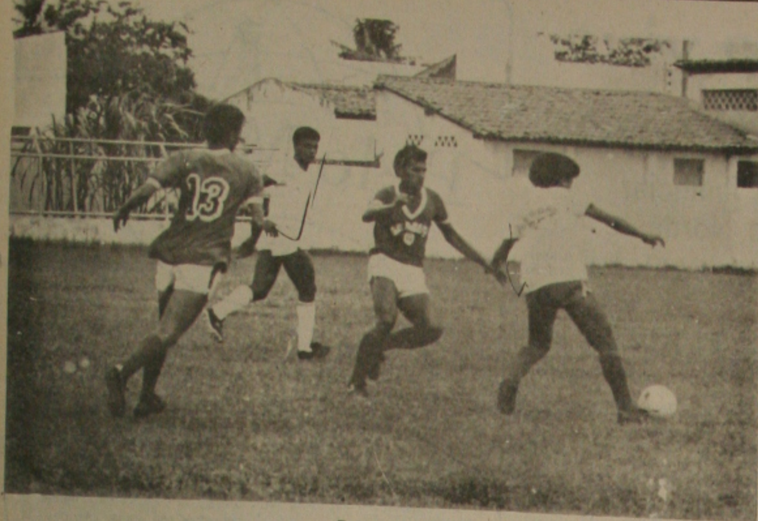
Rubens comandou o coletivo para o seu jovem time