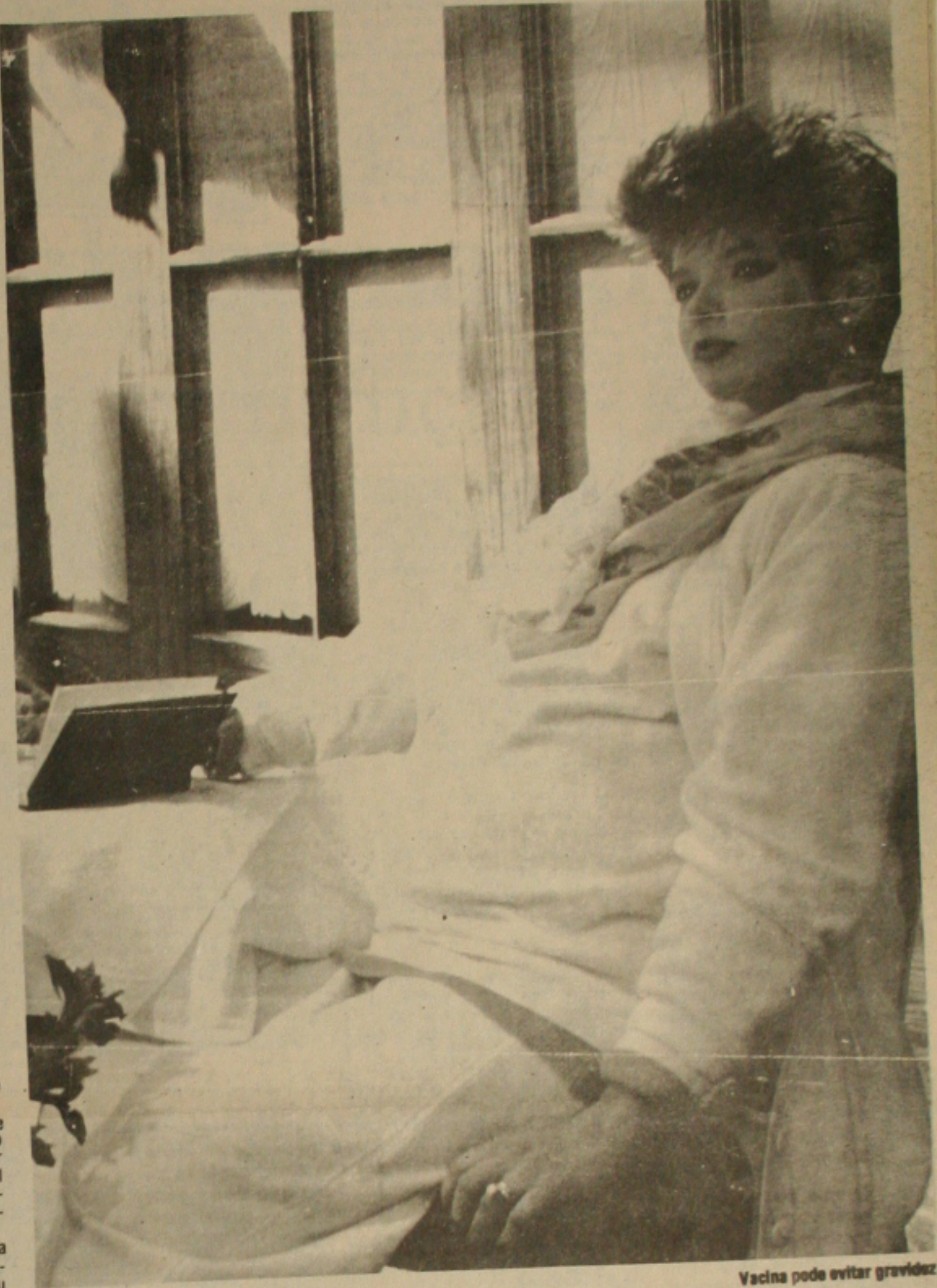
Vacina pode evitar gravidez.

Tendo afirmado que, no terceiro mundo, o maior sofrimento da mulher, daquela mulher pobre, é a falta de sexo, porque se a mulher tivesse uma compensação sexual ela faria planejamento familiar. A mulher do terceiro mundo não sabe o que é sexo. Ela chega aos 35 ou 40 anos sem nunca ter sentido um orgasmo. 70 por cento das faveladas não sabem o que é piea sexual agradável. E a vacina talvez criasse condi-