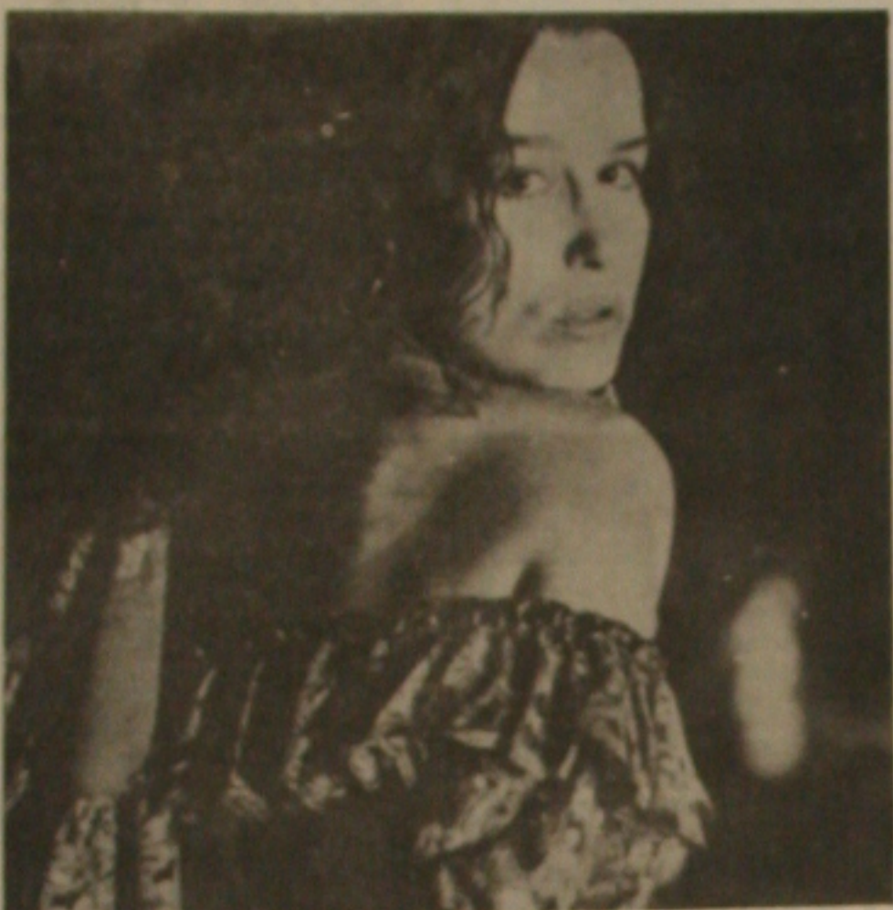
Carmem realiza o pacto com a Pombagira.