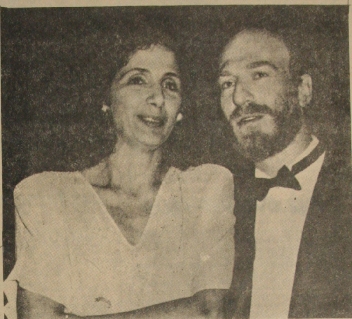
Virginia (Juliana C. Cunha) dá um ultimato a César (Odilon Wagner)...