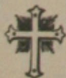
MISSA DE 7º DIA