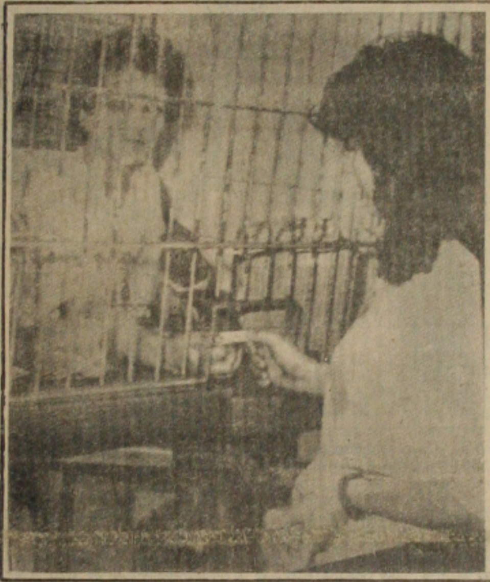
RIO (EBN) - O Vale-Transporte no seu primeiro dia de utilização na Estação das Barcas - Praça XV na cidade do Rio de Janeiro.