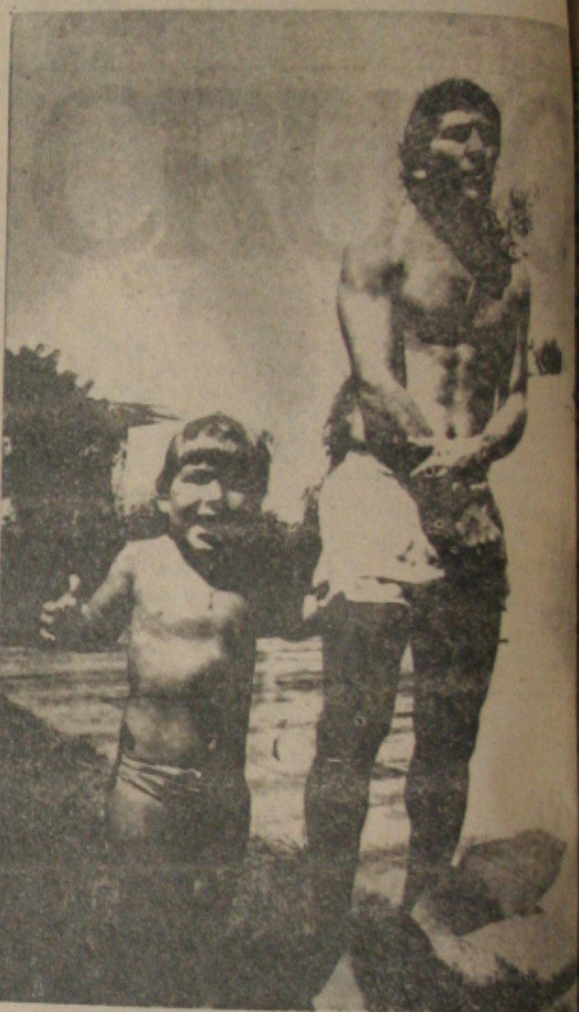
Zico ainda é a grande dúvida do Flamengo.

—Os meniscos de Zico não foram retirados. Foi feita uma sutura nos meniscos e a preocupação do médico James Andrews, que operou o Zico, era justamente saber quanto tempo os meniscos suportariam a essa sutura. As dores e a inchaço que apareceram agora podem ser sintomas dessa dúvida do médico.