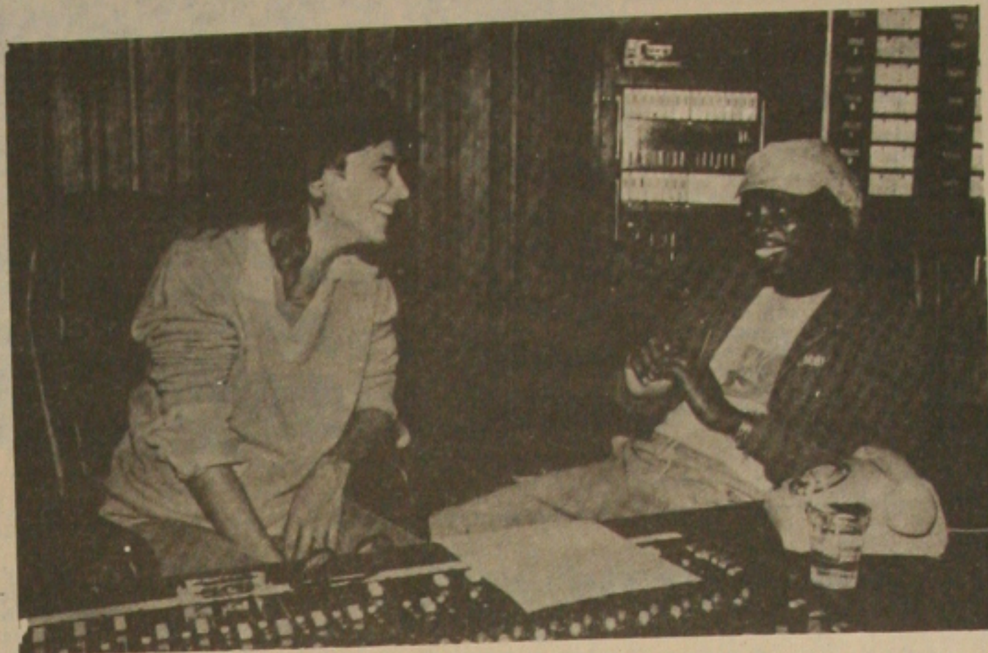
Em "Cais" e "Você é Linda" Milton divide os vocais com Simone.

Sei Que Vou Te Amar (de Tom Jobim e Vinicius de Moraes), com a participação de Tom ao piano; Cais (de Milton Nascimento e Ronaldo Bastos); Você é Linda (de Caetano Veloso) - nessas duas faixas, Milton Nascimento divide os vocais com Simone;