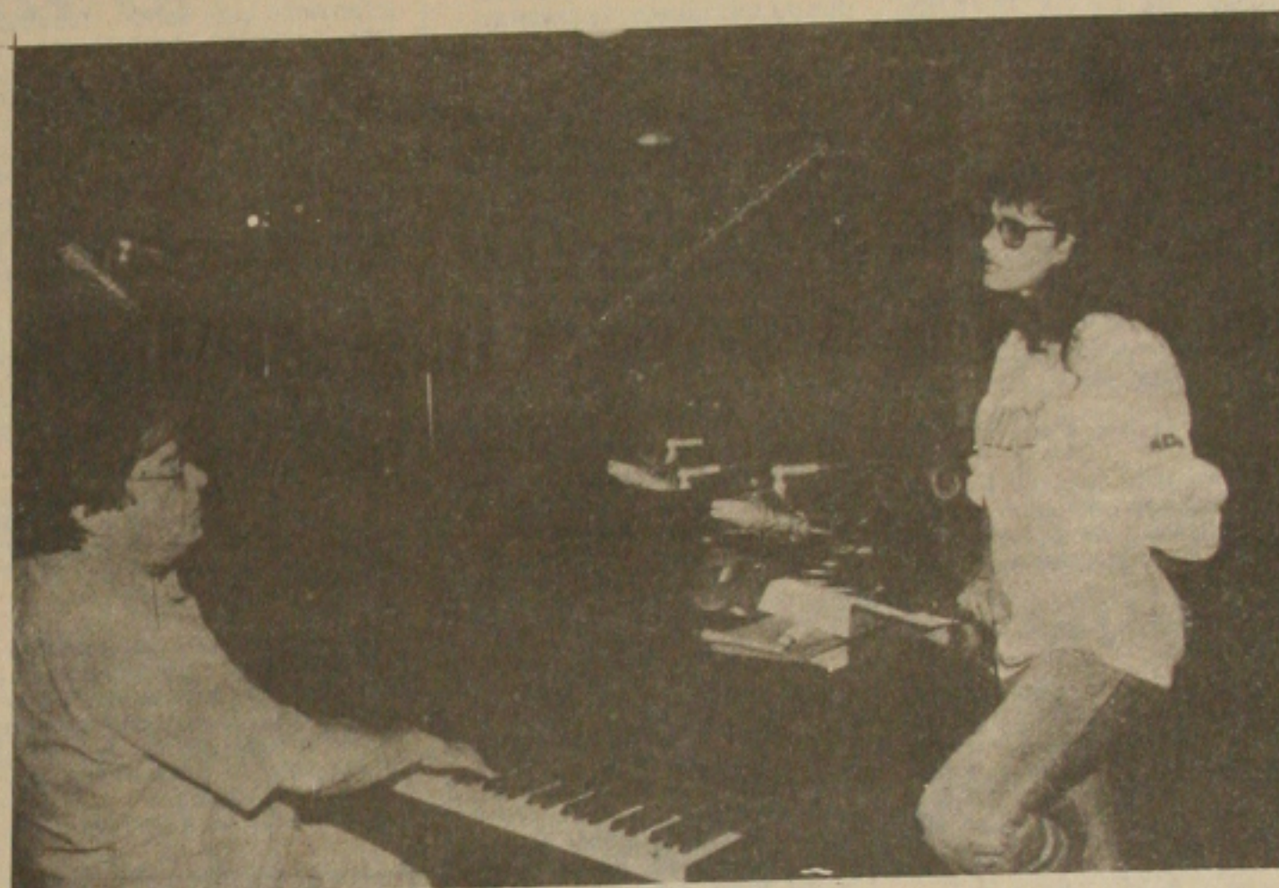
Tom Jobim participa em "Eu Sei Que Vou Te Amar".