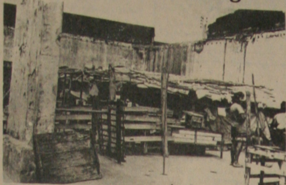
Abrigados numa antiga fábrica de café, os flagelados enfrentam uma vida por demais desumana.