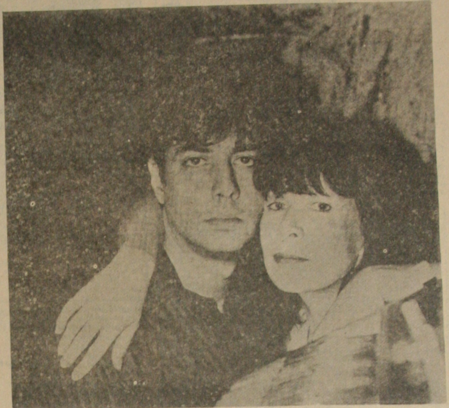
Rita Lee e Roberto de Carvalho: atração deste domingo, em show gravado ao vivo.

Consultório Jurídico coluna é um brinde da Gazeta de Aracaju e da Revista Imposto Fiscal. Autor que desejar efetuar sua inscrição deverá endereçá-la para o anúncio no rodapé desta página.