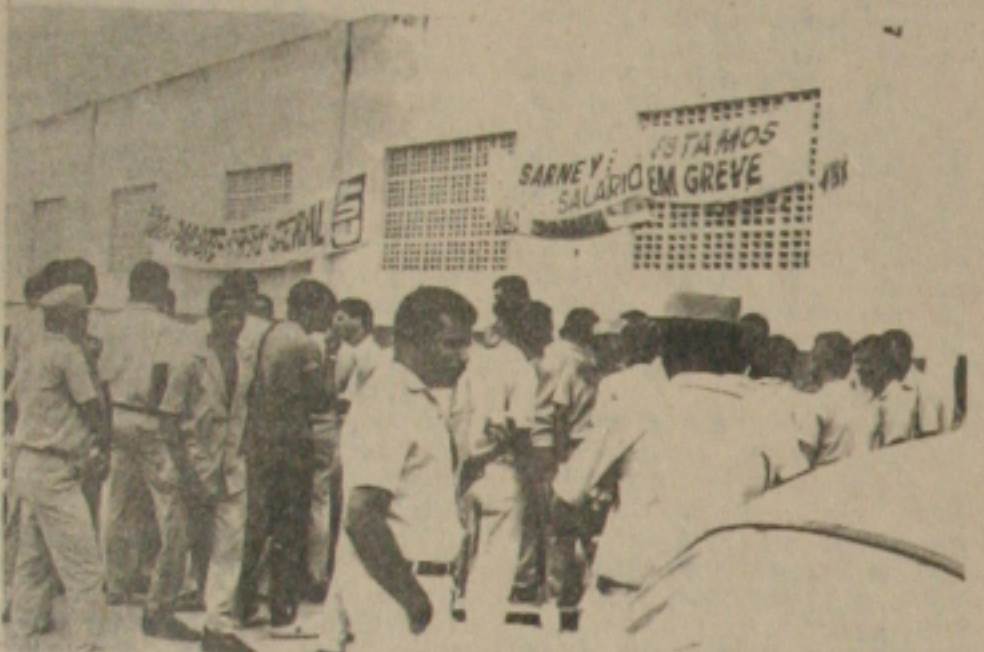
Os servidores da Sucam continuam concentrados na garagem do órgão.

Num clima animado por um sambão, os servidores da Superintendência de Campanha de Saúde, (SUCAM), permaneceram no dia de ontem concentrados na garagem do órgão federal, localizada no bairro Ponto Novo. Para conseguir maior adesão dos servidores, os líderes do movimento grevista liberaram a saída de 10 carros da Sucam que seguiram para o interior do Estado, onde o pequeno número de servidores desenvolviam algumas atividades.