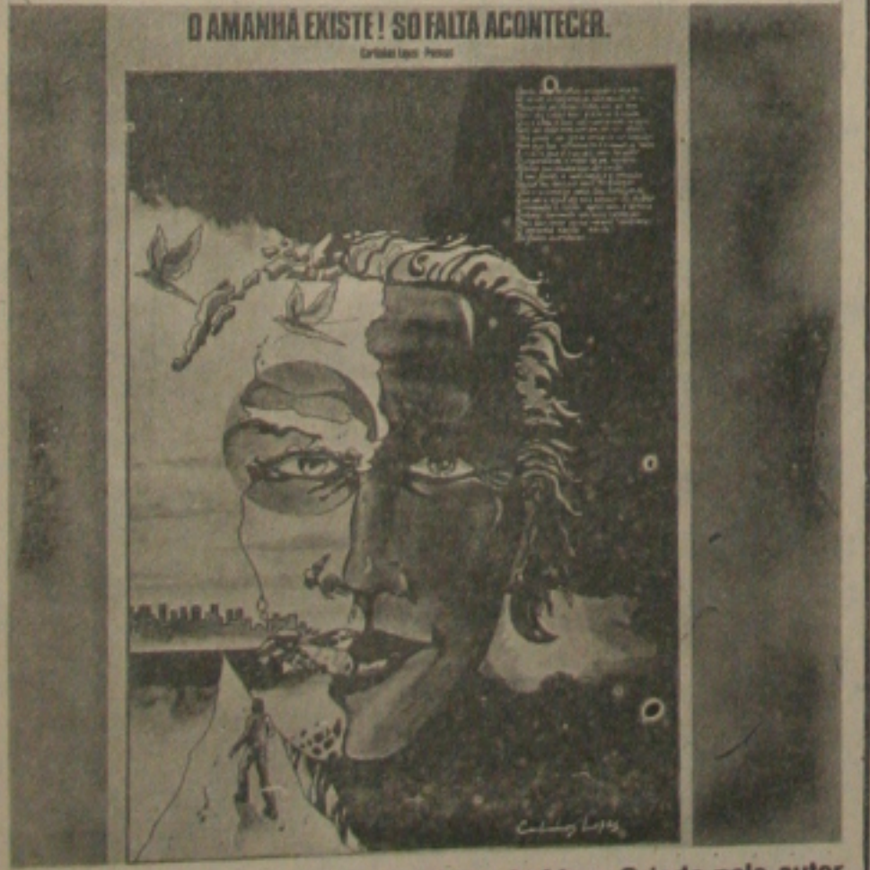
Capa do Livro Criada pelo autor que também é Artista Plástico.