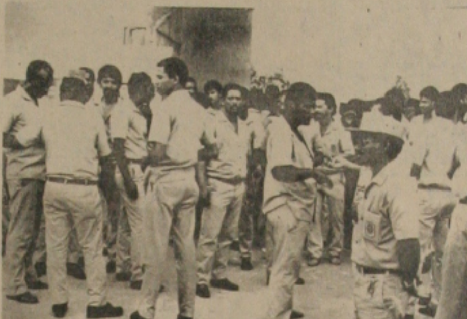
Os grevistas não abrem mão das suas reivindicações.