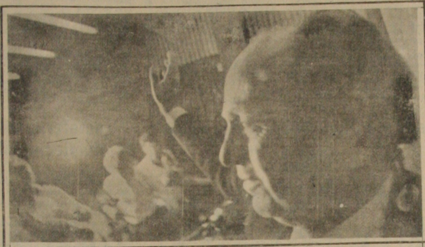
Brasília-18.12.87 - Ministro Bresser Pereira despede-se dos jornalistas

Brasília - O Ministro da Fazenda, Luls Carlos Bresser Pereira, pediu demissão do cargo, o Pedido foi entregue por volta das 18:00, durante audiência com o Presidente José Sarney.