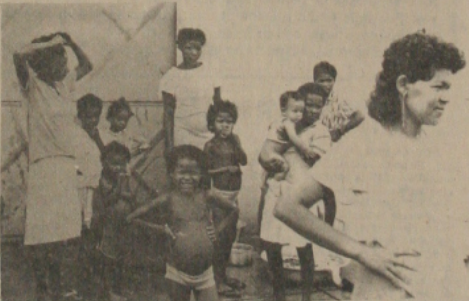
Sem os mínimos princípios de higiene, adultos e crianças convivem numa lamentável promiscuidade.

Lastimável. Assim considerou o Juiz de Menores, José Rivaldo dos Santos, ao visitar na manhã de ontem, os flagelados que estão abrigados numa antiga fábrica de café localizada na rua São Cristóvão, no bairro Getúlio Vargas. São em média 32 famílias, em sua maioria desempregados que saíram de cidades do Interior e até de outros Estados à procura de um meio de sobrevivência na capital sergipana.