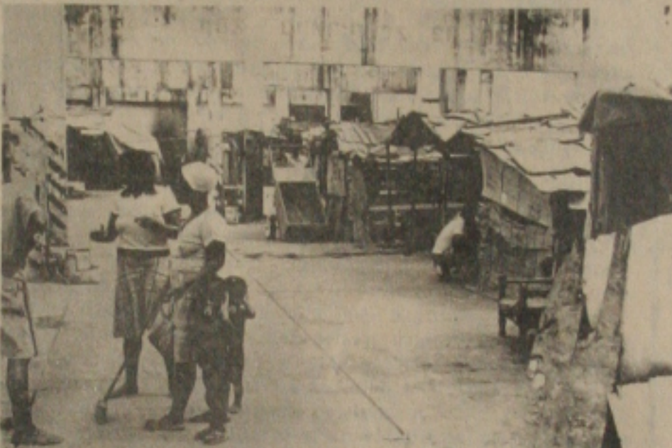
Nas improvisadas palhoças, vivem esquecidos do Governo e de toda a sociedade.