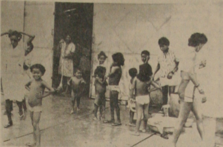
O futuro se apresenta incerto e o presente cruel para as famílias de flagelados.