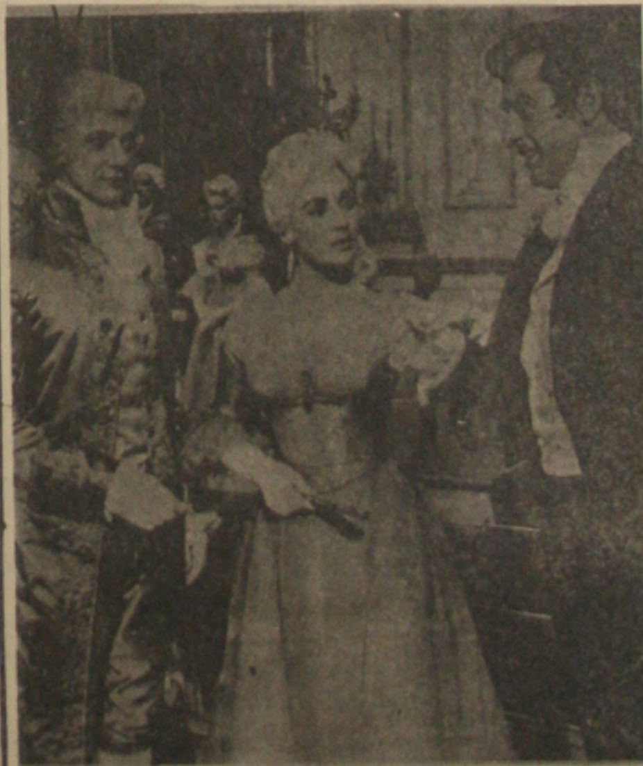
O Beau Brummell, na Vespéral de Sábado.