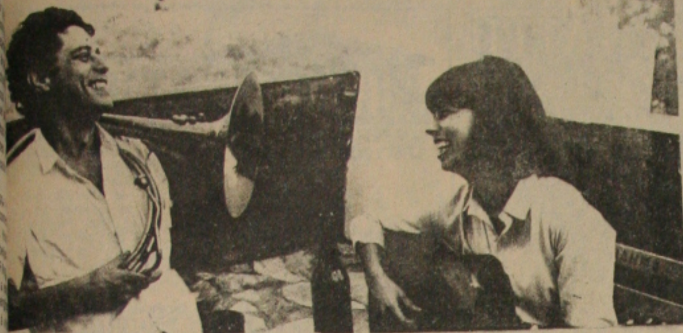
Chico Buarque é destaque em programa especial sobre sua vida.

Chico Buarque de Hollanda por força do verbo, falar dos momentos da MPB nos últimos 20 anos. Compositor genial, homem de uma época em que era proibido militante de posições políticas artísticas. Chico Buarque transcendeu a definição de criador e poeta da música brasileira.