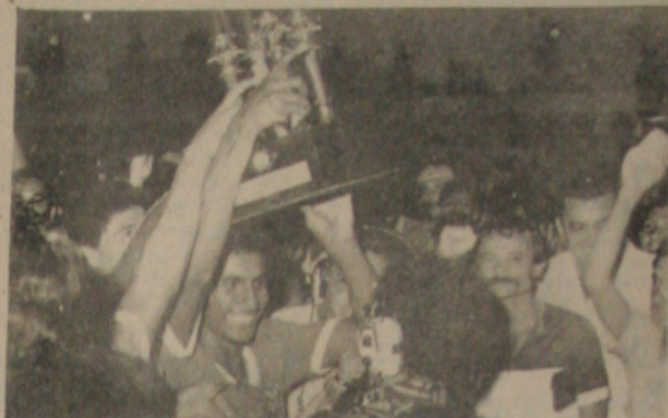
Após a vitória a festa e entrega de troféu.