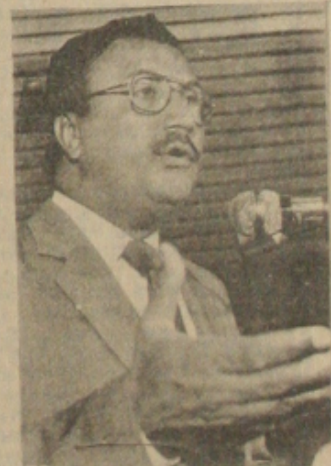
Jackson convoca vereadores

Nas sessões extraordinárias, os vereadores também estarão deliberando sobre a nova redação do Estatuto do Magistério do Ensino de 1º e 2º Grau do Município; reajuste dos vencimentos da Câmara Municipal de Aracaju e alteração na classificação dos cargos do Quadro de Pessoal da Administração Geral do Poder Executivo Municipal.