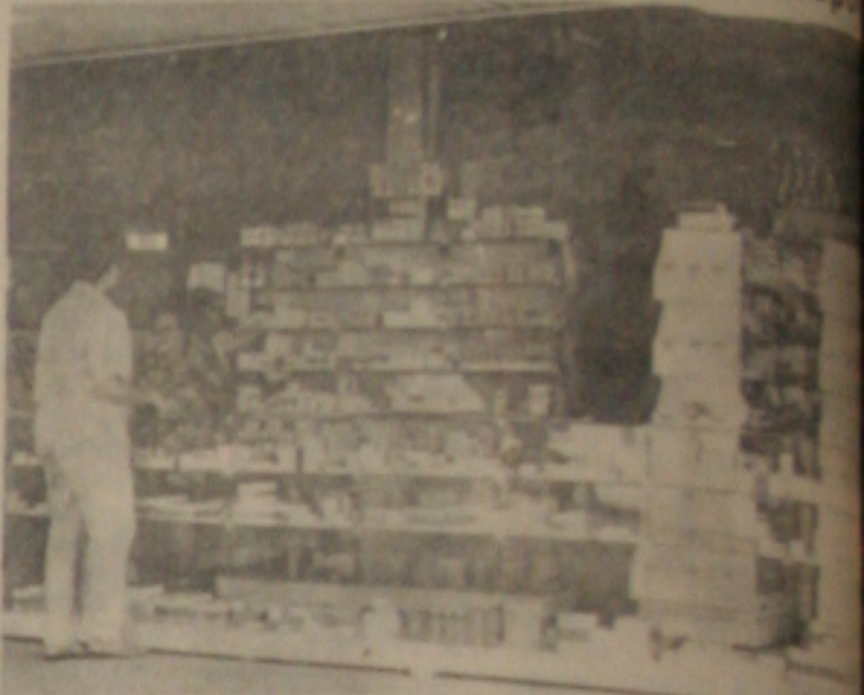
Os remédios estão reaparecendo nas farmácias da cidade.