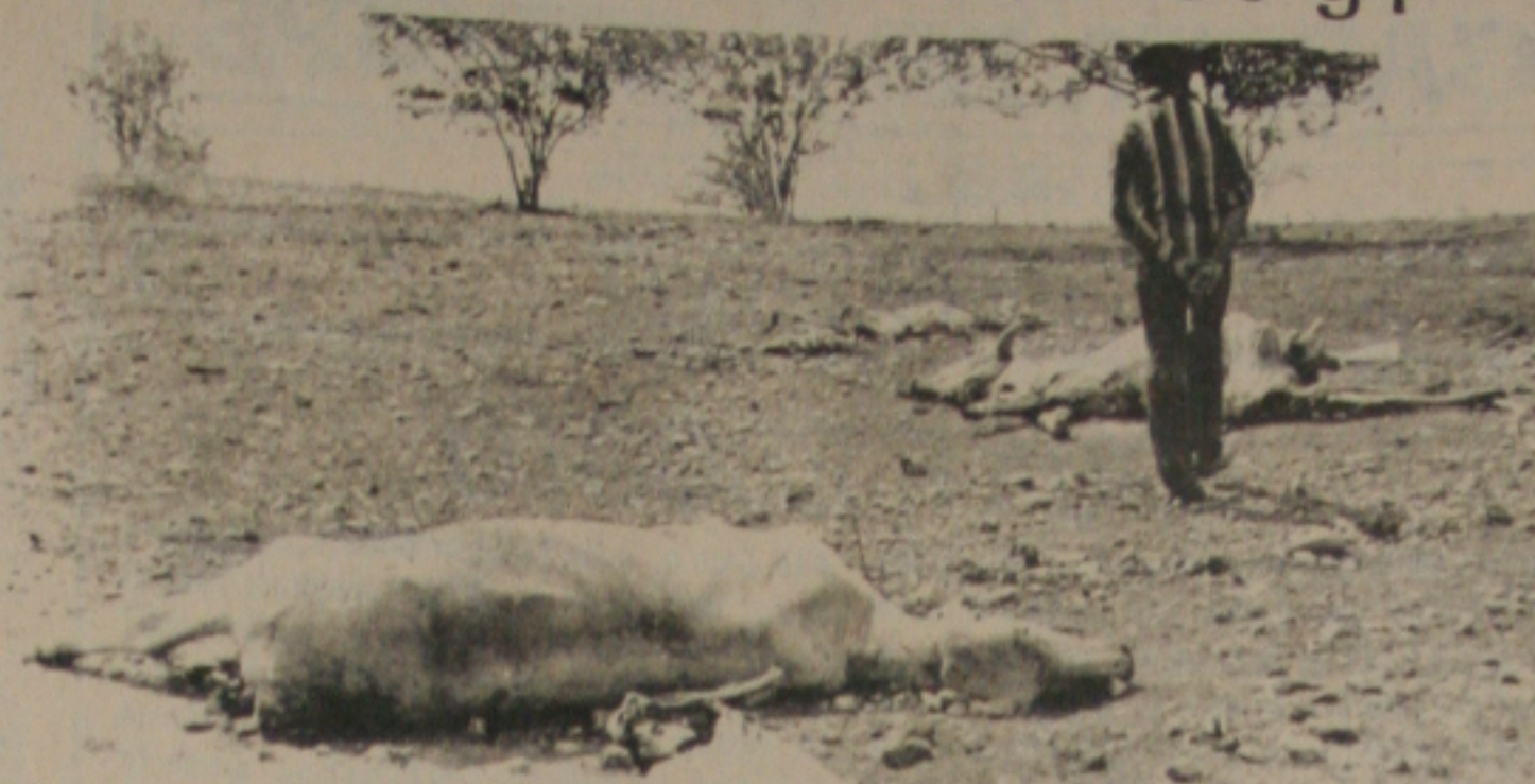
A falta de água está provocando a morte de gado.

Além da pecuária, todo o setor agrícola do País está enfrentando seríssimas dificuldades decorrentes da política econômica do Governo Federal. A atividade está somente trazendo prejuízos, informa Sobral. Para plantar um hectare de milho, o produtor tem que investir 16 mil cruzados - exemplifica -; se este hectare der um bom retorno, ele consegue 10 mil. Isto