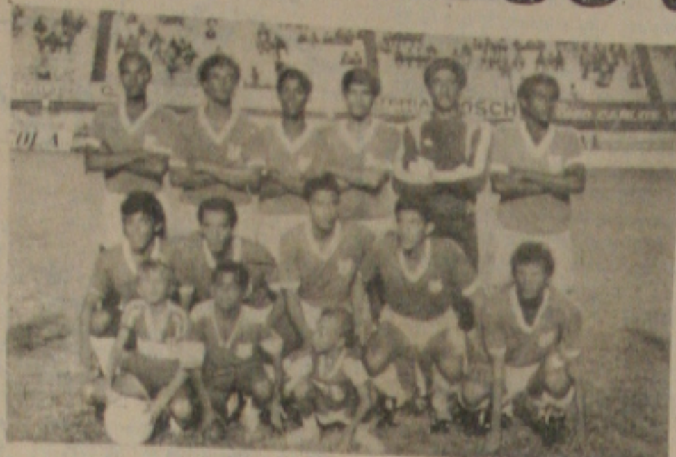
O time do Sergipe campeão da Copa Valadares