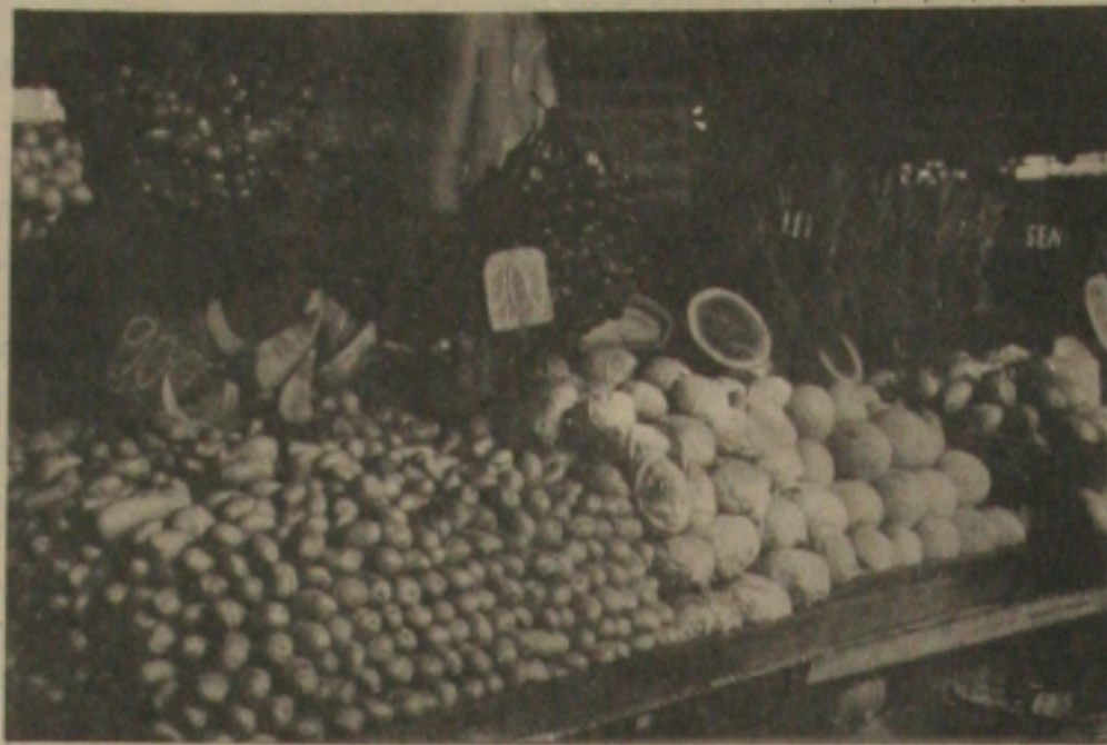
Com a tributação, os produtos hortifrutigranjeiros ficaram mais caros.