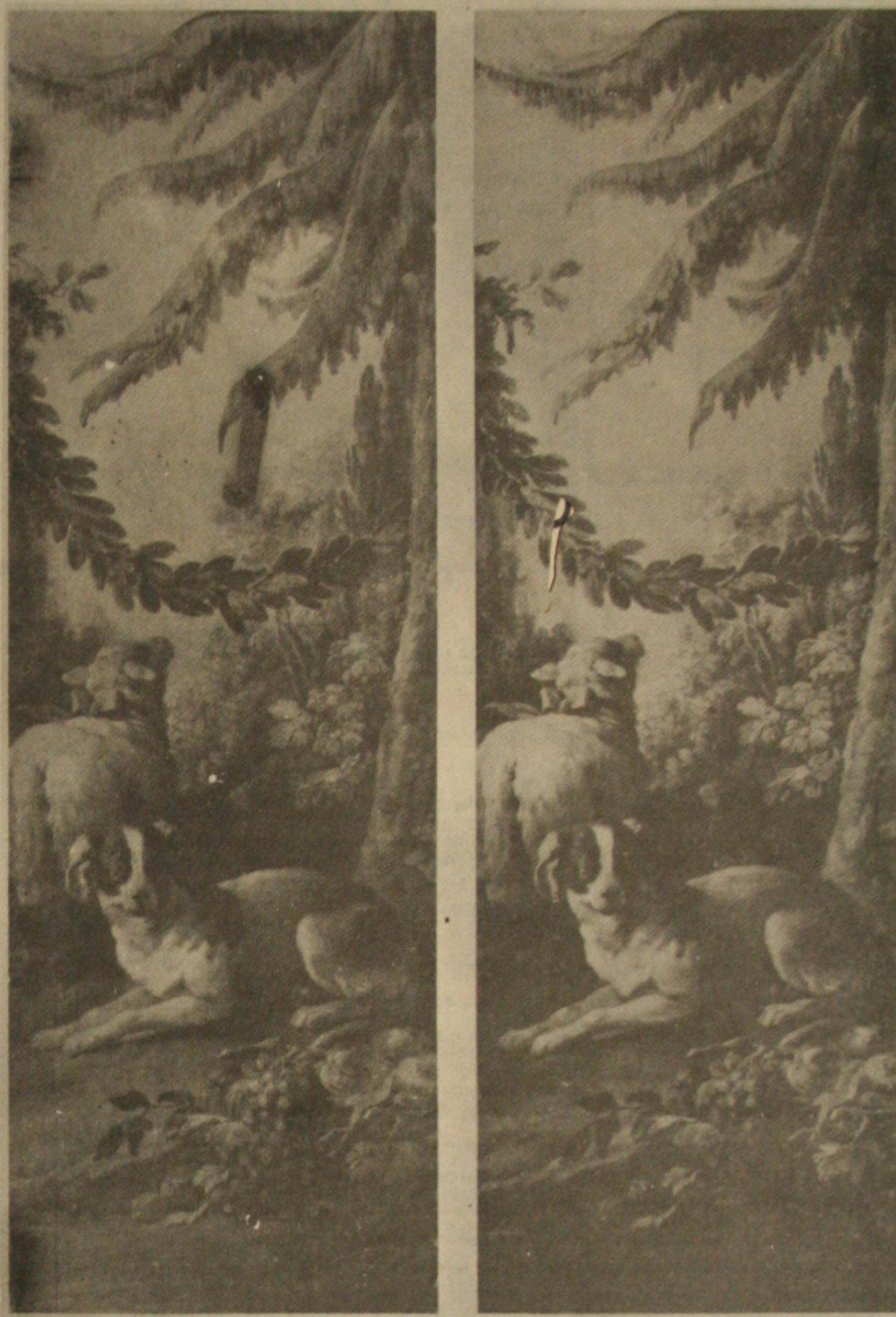
Um painel proveniente do hotel Gilles Desarteau do museu Carnavalet em Paris. Antes e depois da restauração, no momento da remontagem.