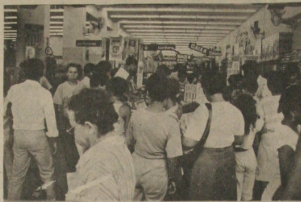
Os festejos de final de ano não concorreram para aumentar o