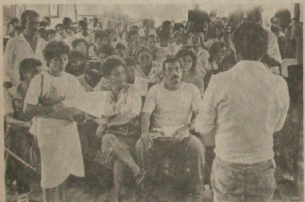
Um dos momentos da reunião.

A Secretaria Especial de Ação Comunitária reuniu, ontem à tarde, no Instituto Histórico e Geográfico de Sergipe, representantes de Federações, Associações de moradores e entidades comunitárias de Aracaju, a fim de traçar e definir planos de ações quanto ao processo de inscrição dos interessados em adquirir unidades habitacionais construídas pelo Governo do Estado, através da COHAB.