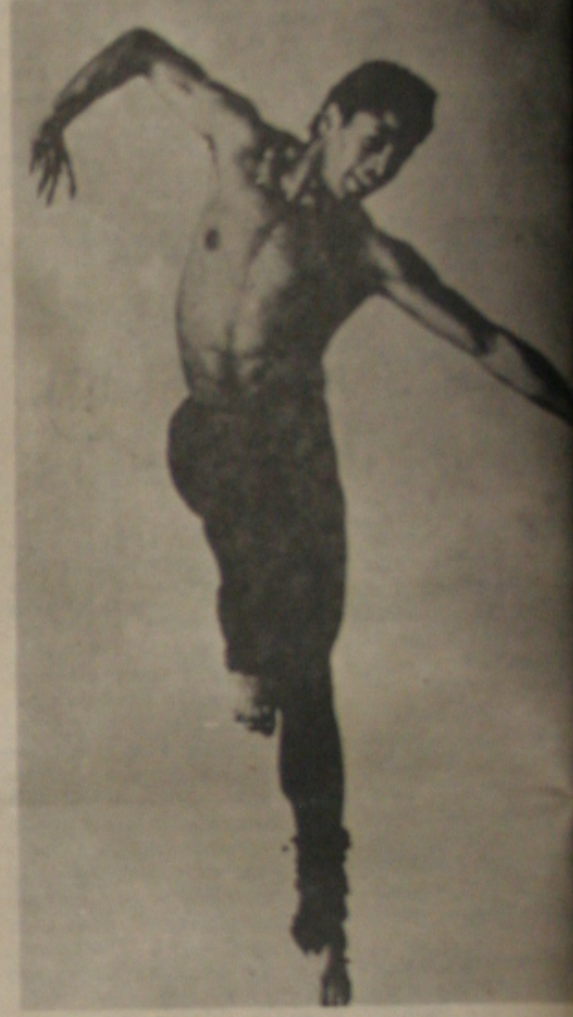
David Gray, campeão norte-americano de ginástica aeróbica estará no I Congresso.

No Rio de Janeiro - dias 24, 25 e 26 de janeiro de 1988 Em São Paulo - dias 27, 28 e 29 de janeiro de 1988.