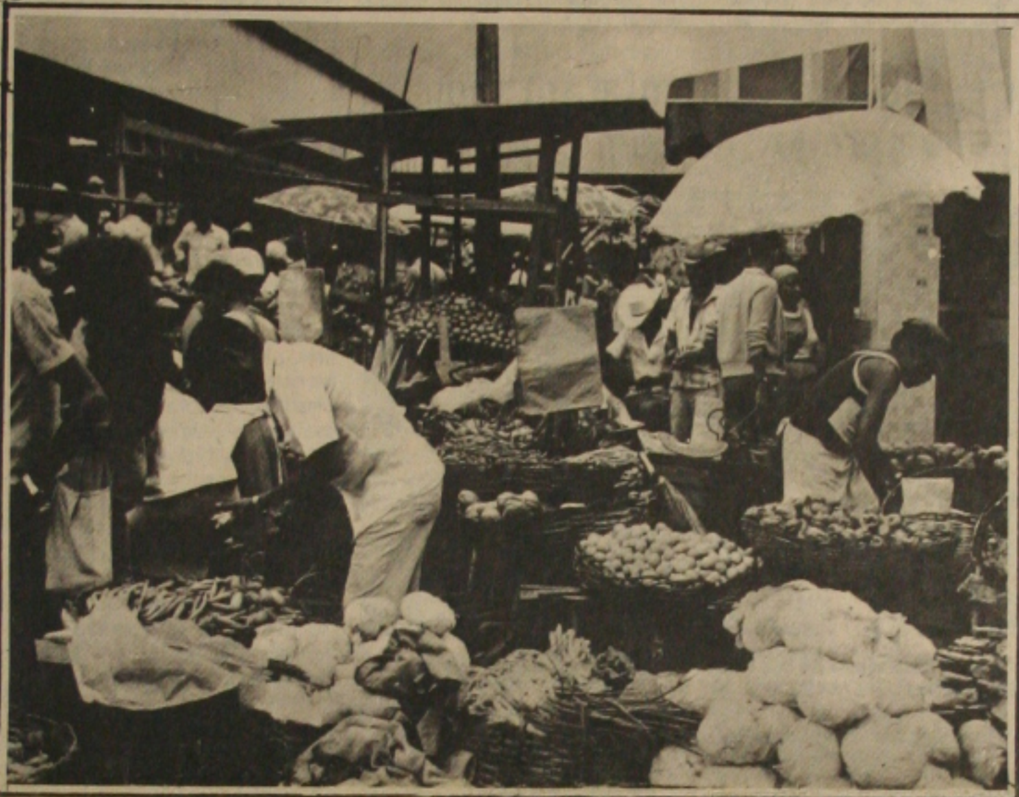
Sergipe está sendo o único estado a cobrar ICM dos hortifrutigranjeiros.