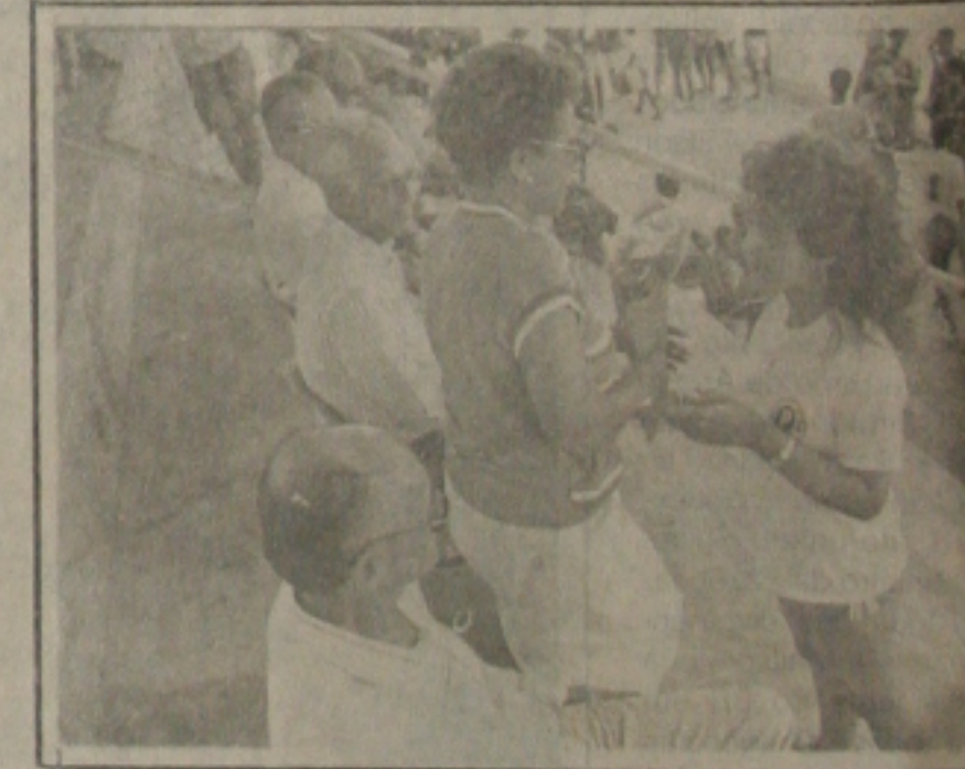
Homenagem dos atletas.