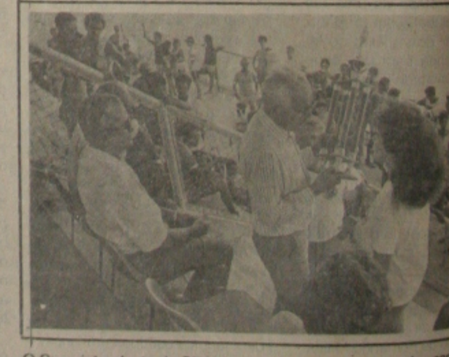
O Superintendente do Sesi faz entrega do troféu a equipe campeã.