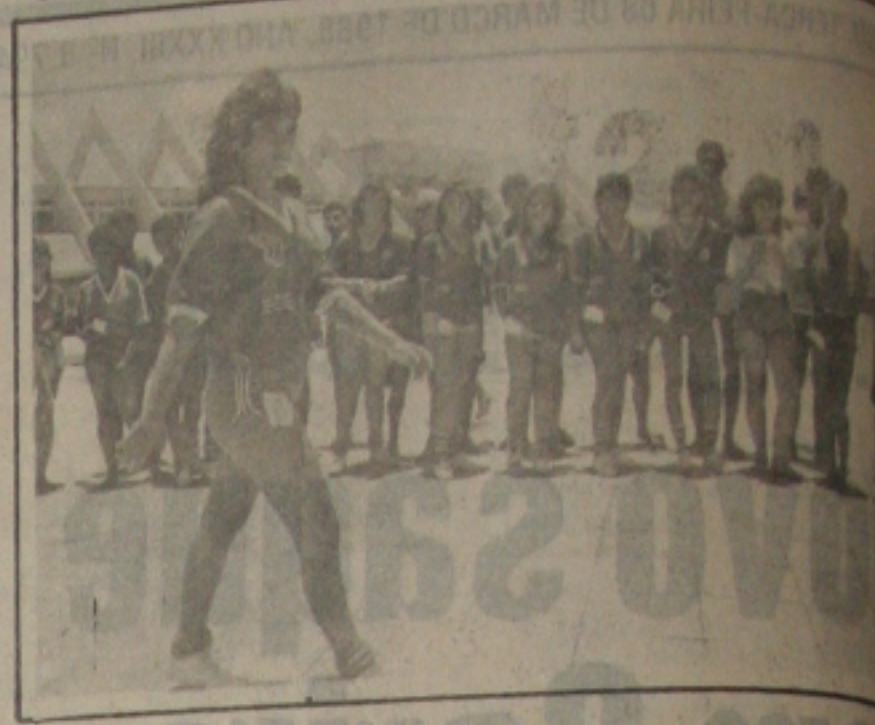
A beleza da mulher sergipana também esteve presente na abertura do I Metropolitano de Futebol promovido pelo Sesi.

Fez questão de afirmar que o Sesi não promete, "mas realiza benefícios em prol do trabalhador sergipano, tendo também uma preocupação com o lazer". Citou como exemplo a realização do III Torneio Intermunicipal, do qual participaram os 74 municípios sergipanos, representados por mais de 600 equipes.