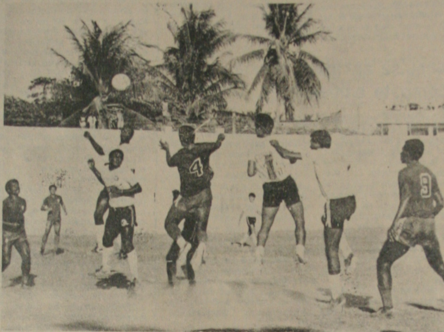
O ataque do Confiância deu trabalho à defesa do Maruense.