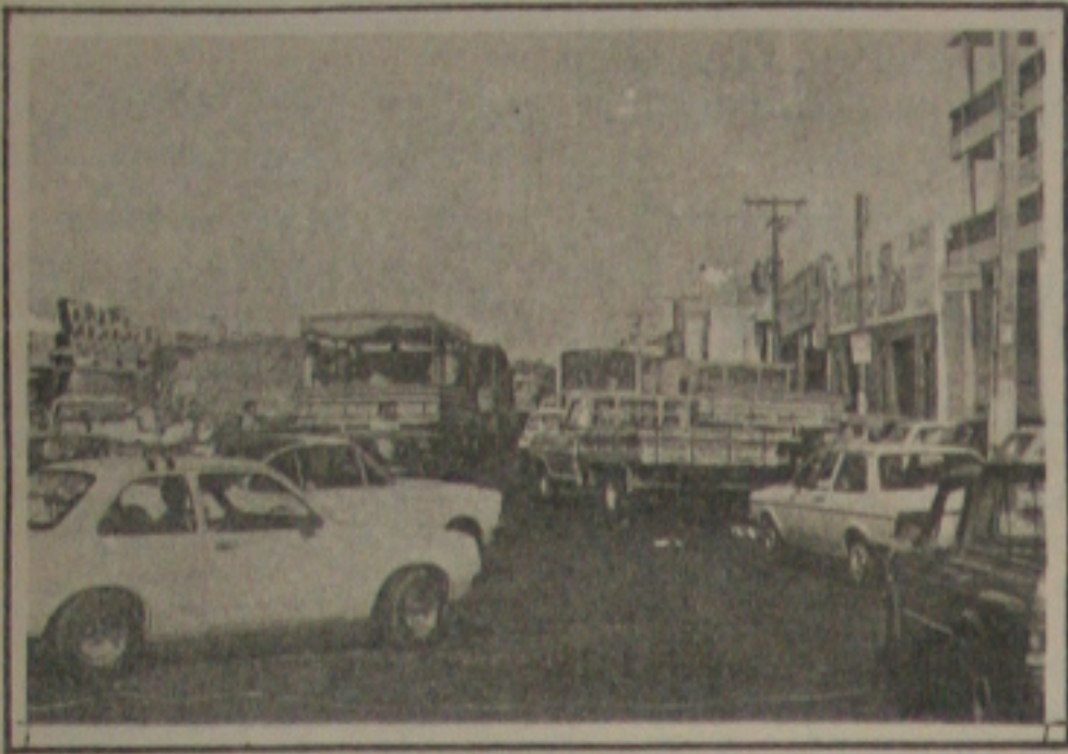
A desorganização no trânsito nas imediações do Mercado Municipal é uma constante.