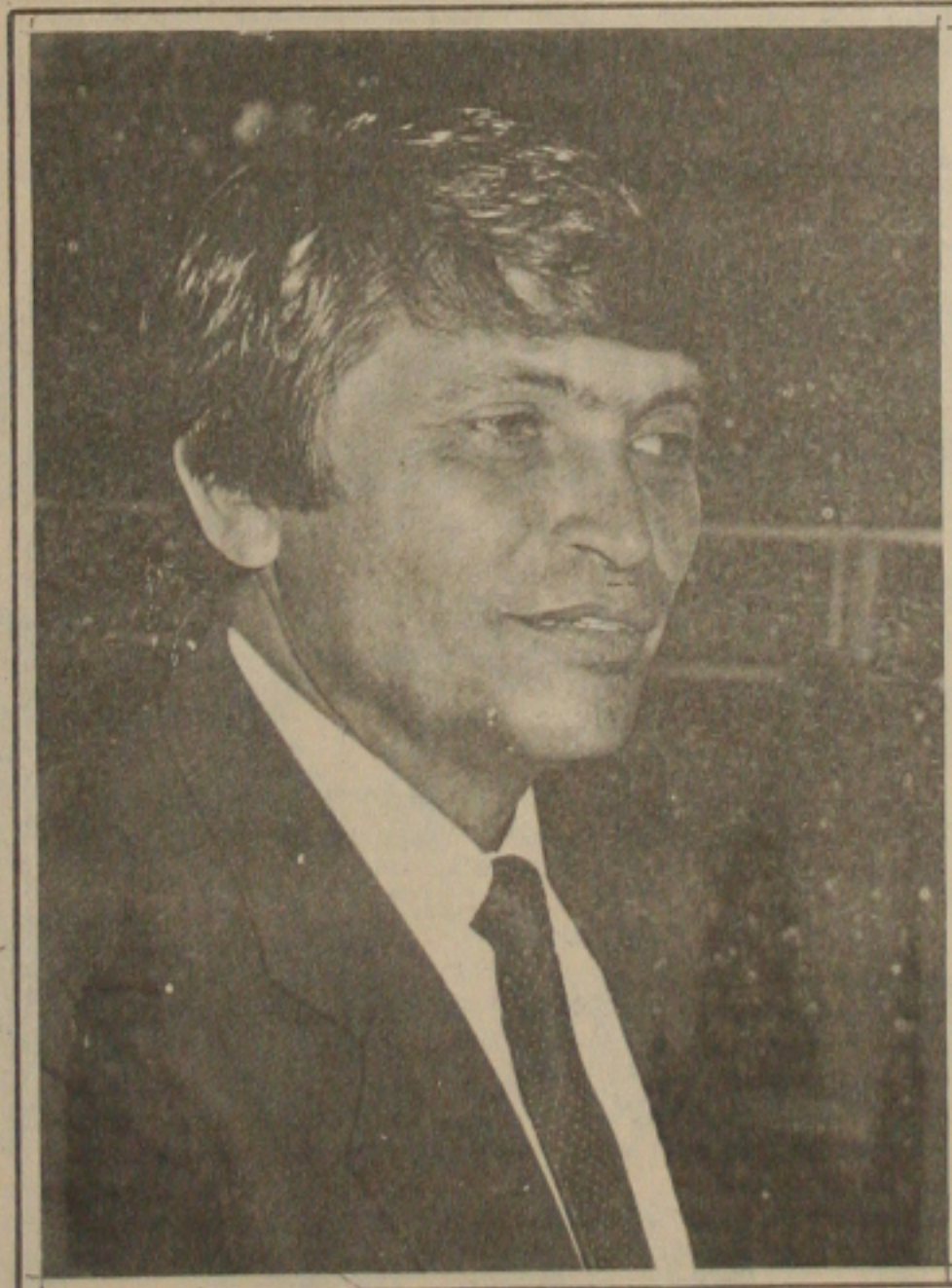
Falcão anunciou o aumento dos barnabés, afirmando que

tudo está sendo feito, no sentido de melhorar a situação destes.