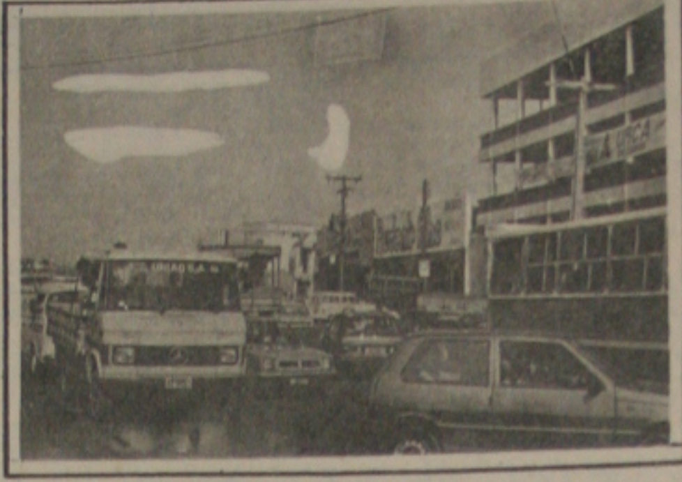
Há quem afirme que a Prefeitura e o Detran devem tomar medidas conjuntas.