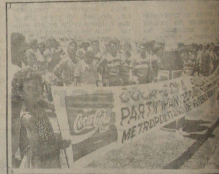
Equipes formadas antes do início das competições.