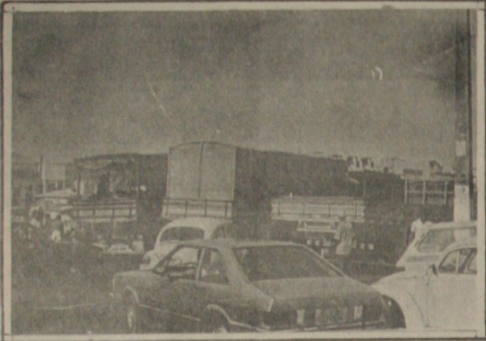
Orientar e não multar, é o que os guardas do Detran deveriam fazer.