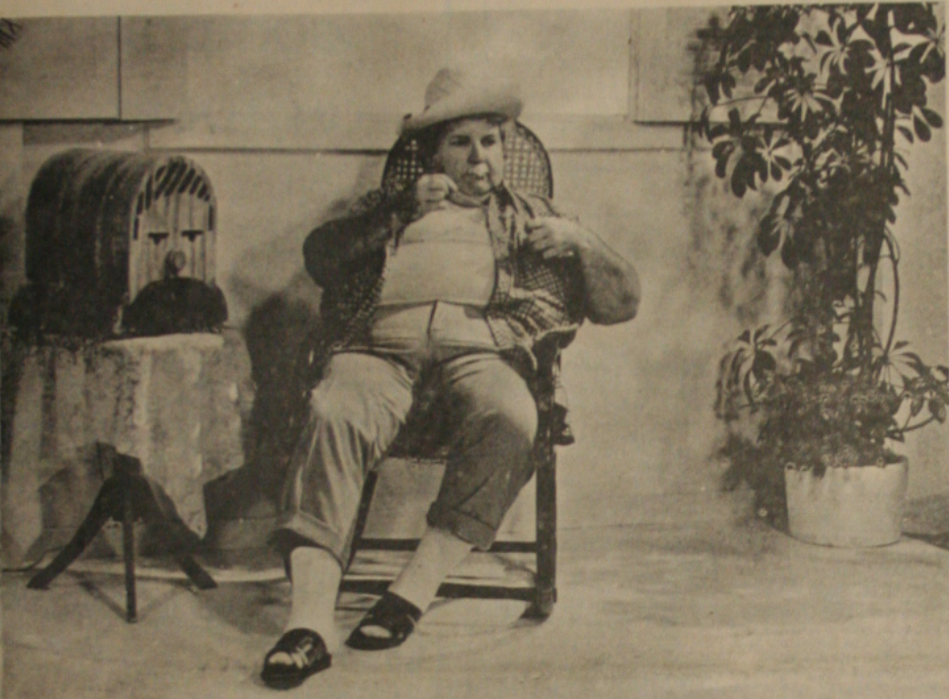
...terá uma "Conversa ao pé do rádio".

...o mês de novidades... ...tema Brasileiro de Televisão... ...Além do esperado programa humor... ...Veja o Gordo, que apresentado por Jô Soares... ...gundas-feiras às 21h30, a do dia 7, estarão sendo... ...os também novos desenhos animados, novas séries e o... ...an, uma verdadeira coquetada década de 60 que estanda... ...do vídeo.