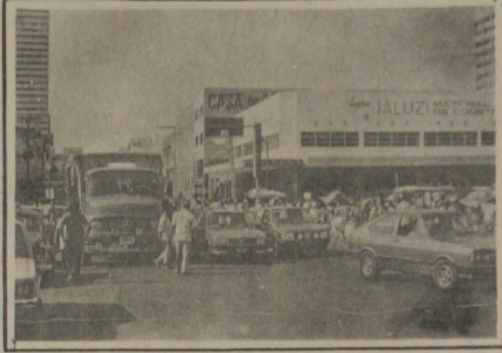
Um estacionamento compensaria a falta de educação no trânsito por parte de alguns motoristas.

Não é bom o tráfego de veículos e de pedestres nas proximidades do Mercado Municipal Thales Ferraz, "Camioneiros", motoristas de táxis e de carros particulares invadem a sinalização de trânsito e os "comioneiros" que transportam passageiros para o interior do Estado acabam sem condições de estacionar seus veículos nos locais apropriados.