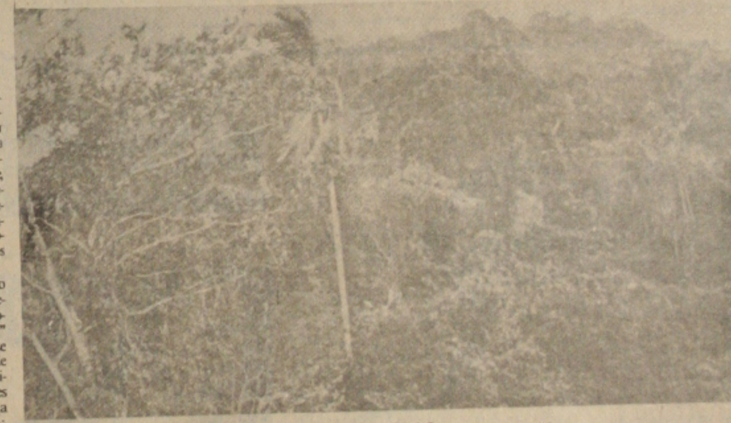
Menos juros, menos serviço, menos dívida externa, etc.

países em desenvolvimento, como o Brasil, dotado de extraordinária reserva florestal e ao mesmo tempo detentor de monumental dívida externa, estejam realmente dispostos a isso. No mínimo, por uma questão de inteligência.