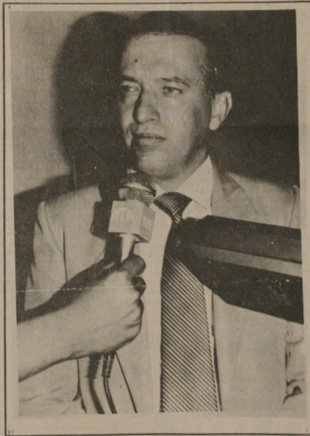
Governador do Estado do Estado, Antonio Carlos Valadares.

No próximo dia quinze de março ao completar um ano e governo, através do CEAG/SE, o governador Antonio Carlos Valadares, e o CEBRAE, no ano da micro empresa, estarão entregando aos empresários de Sergipe, durante a inauguração do Centro de Interesse Comunitário José Hugo Castelo Branco, o balcão do empresário.