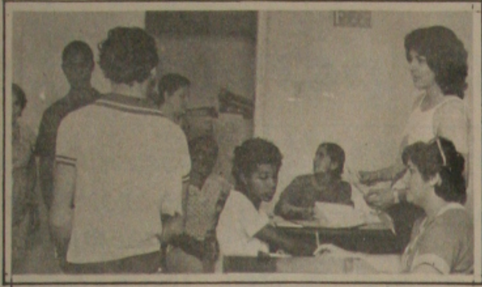
A procura de empregos aumentou, em Aracaju.