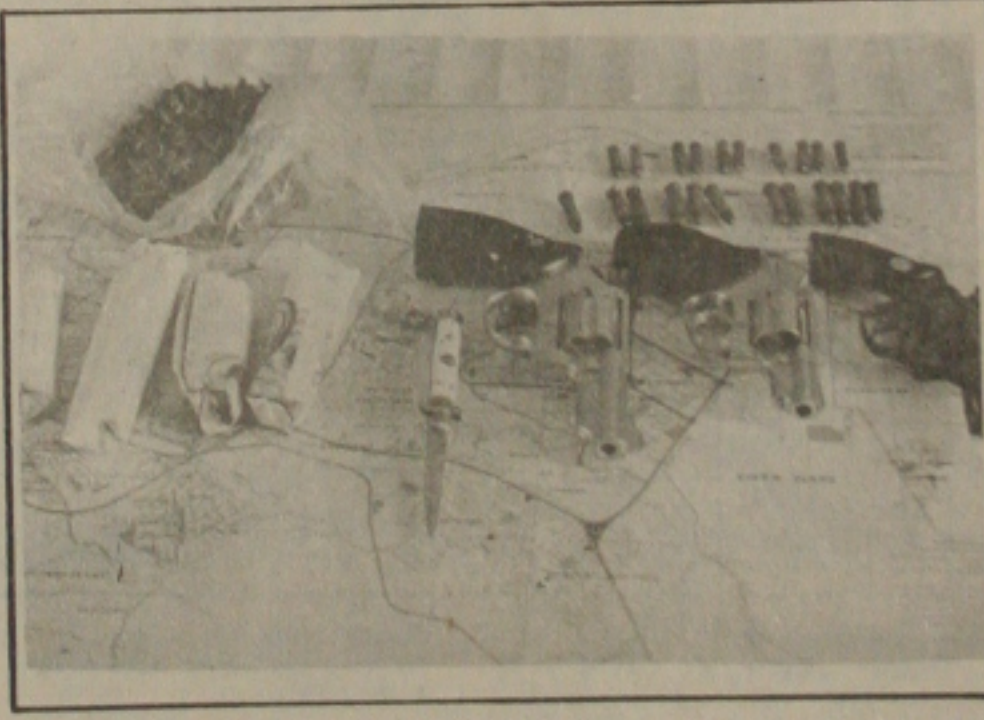
Os objetos apreendidos em poder dos assaltantes.