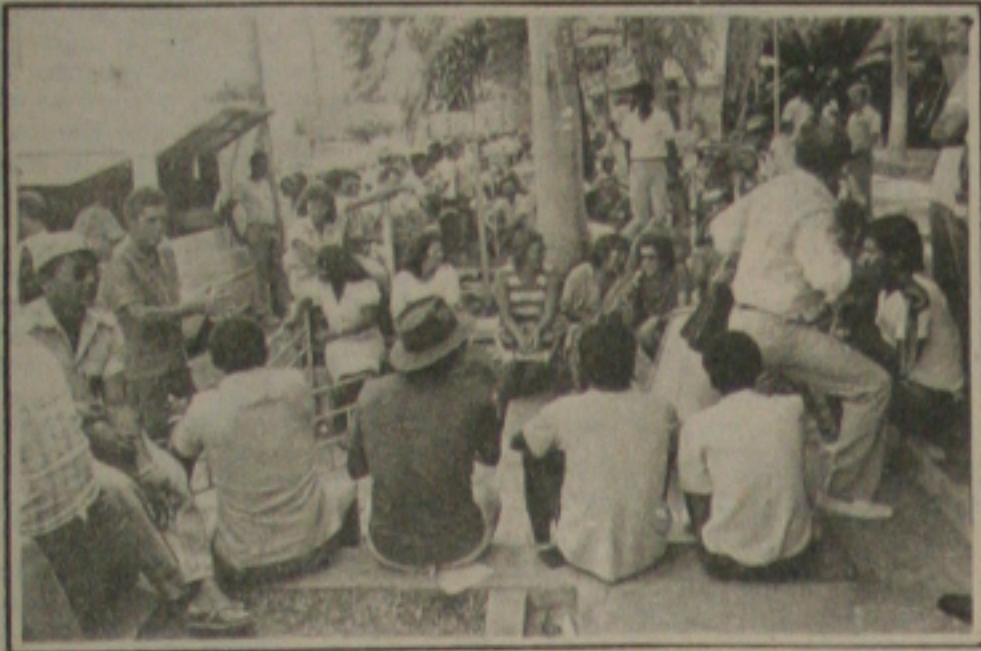
Funcionários da DESO, em greve.