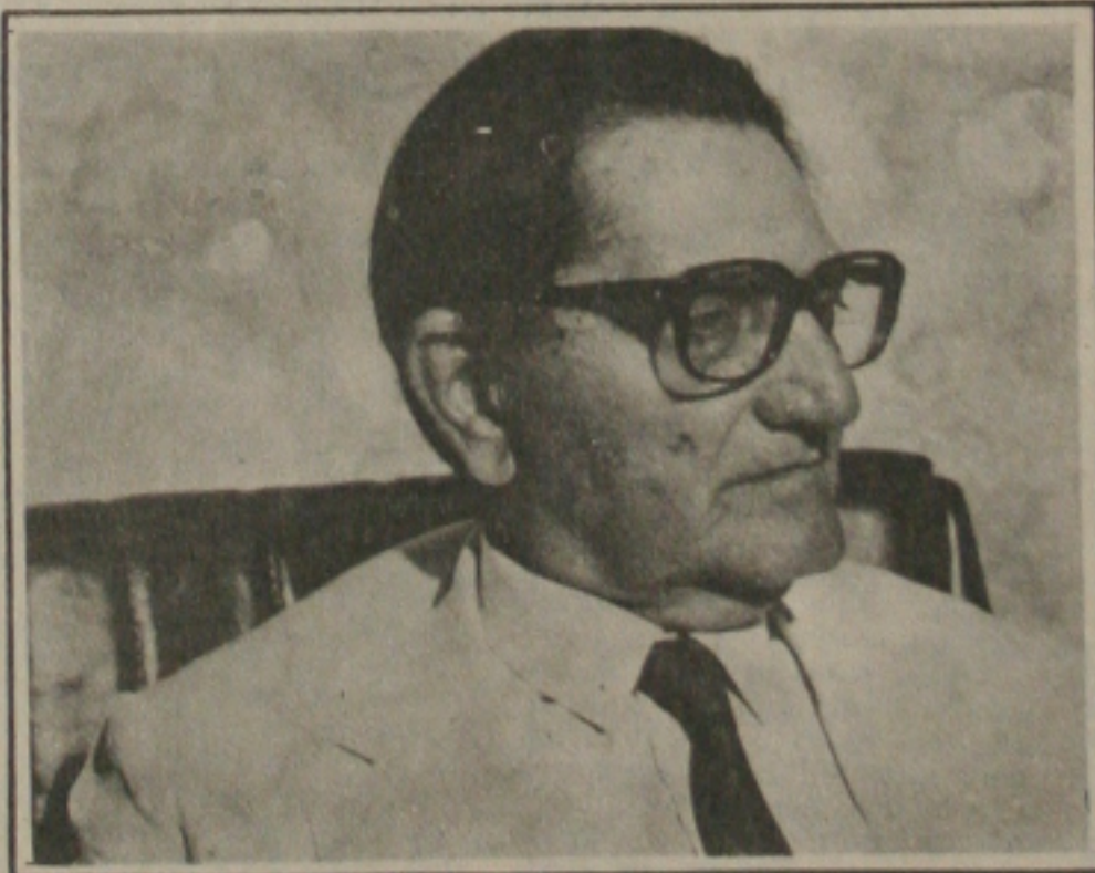
Presidente do Tribunal de Justiça do Estado de Sergipe, Desembargador Antônio Machado.

O Tribunal de Justiça do Estado de Sergipe, já realizou a tomada de preços, objetivando a aquisição de um computador de médio porte, para agilizar serviços administrativos, afetos àquele Poder, dentro da filosofia de Modernização, instituída pelo Presidente do Tribunal de Justiça do Estado de Sergipe, Desembargador Antônio Machado.