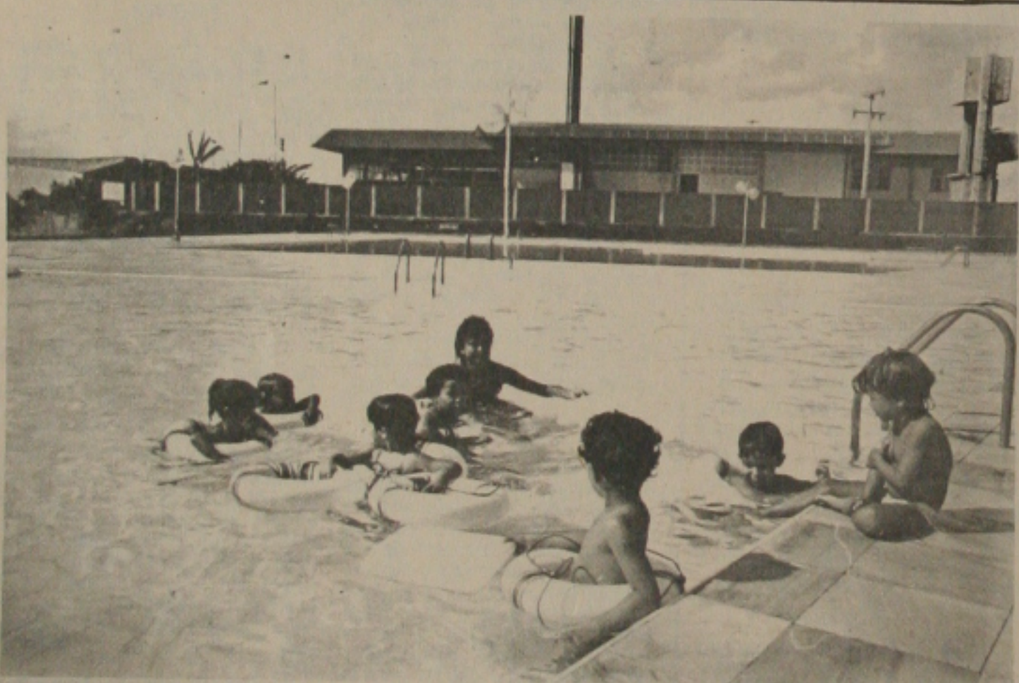
A garotada aprende a nadar no Sesi.