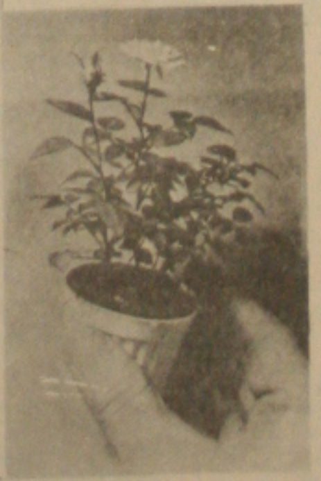
O cultivo das rosas é destaque de Manchete Rural.

Em outra matéria, Manchete Rural foi até uma plantação de rosas para trazer para o telespectador informações sobre a sua colheita. Todas as dicas para tornar economicamente viável a plantação de rosas. Em termos econômicos, qual a cor que tem mais mercado? A rosa é uma flor delicada que deve ter, antes da colheita, a venda garantida. Todas as perguntas terão respostas no programa deste domingo.