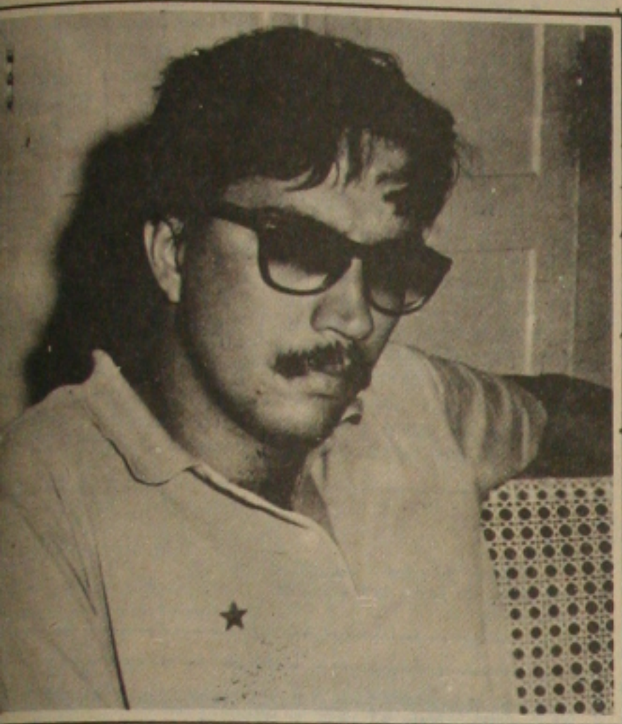
de val exigir de Valadares divulgação da pesquisa do Ibope.