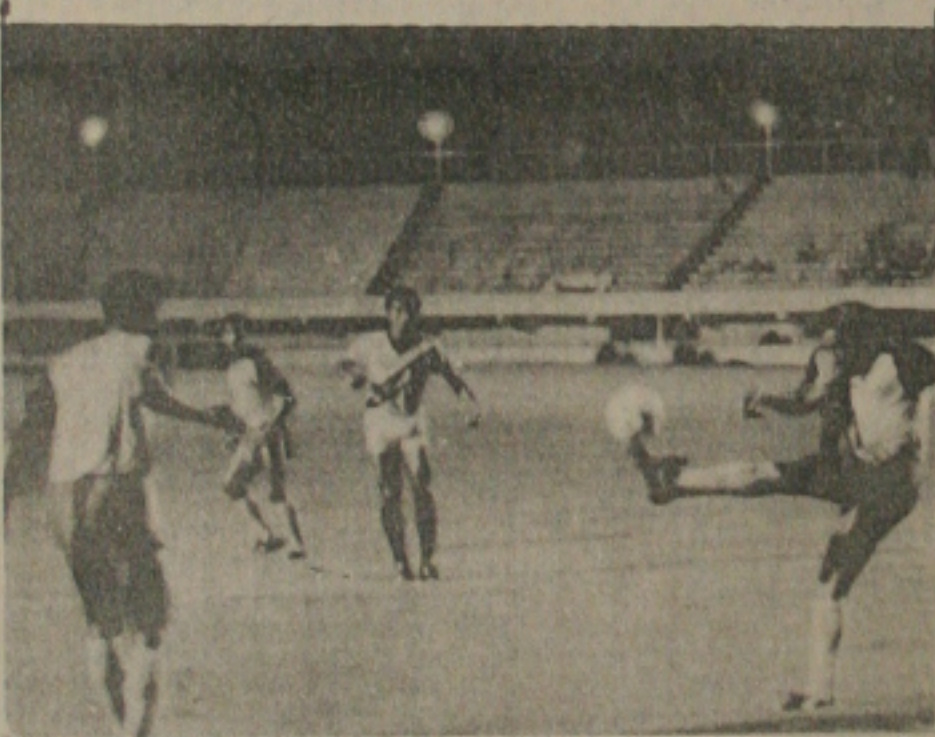
Estanciano foi melhor e venceu a partida contra o Vasco num jogo em que o campo estava vazão.