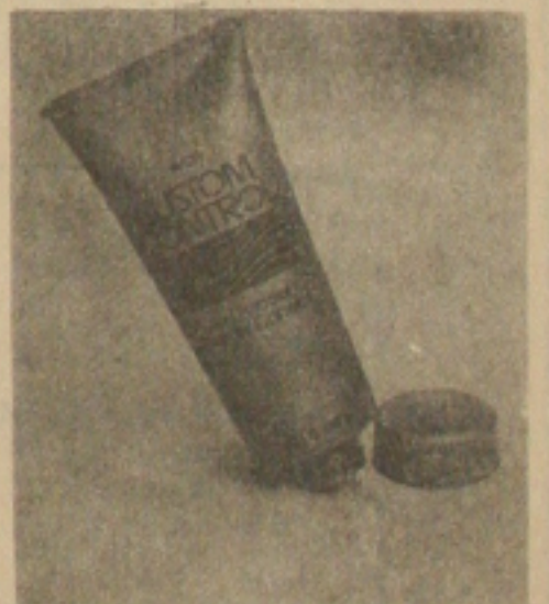
CUSTOM CONTROL GEL PARA CABELOS.... Cz$ 149,00