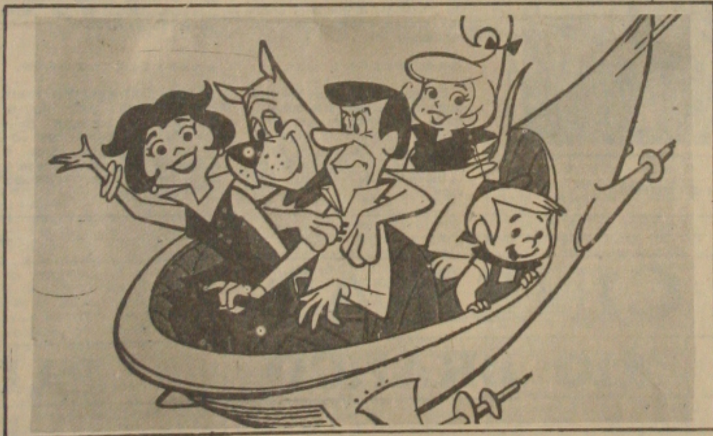
...Os Jetsons são destaques em "Show Maravilha"