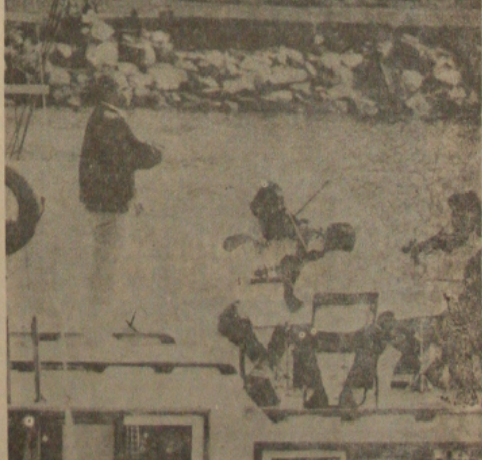
Radamés Gnattali e a Suíte Aquarela , interpretada pela OSB, sob regência de Isaac Karabtschevsky são destaques desta semana.