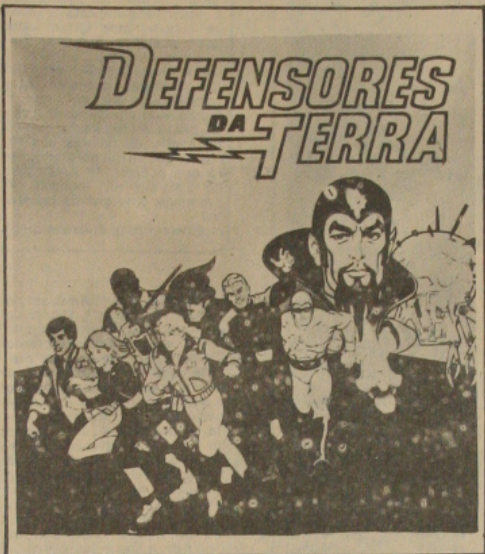
Os defensores da terra e...

Outras séries inéditas que representam diversão garantida para as crianças são A turma , Pole position , Honey, Honey , Silver Hawks e Os Fantasmas .