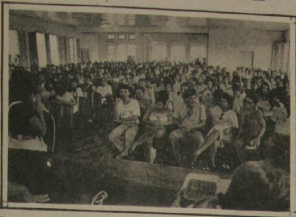
Servidores da Saúde decidem prosseguir greve hoje.

Durante assembleia geral realizada na tarde de ontem, os servidores da Saúde decidiram manter o movimento grevista até a próxima quinta-feira quando será realizada uma nova assembleia geral às 10 horas da manhã no Instituto Histórico e Geográfico. Durante o dia de hoje, os representantes da categoria tentarão uma audiência com o Governador Antonio Carlos Valadares, no Palácio Olímpio Campos, com o intuito de conseguir o pagamento das três parcelas da Isonomia salarial referente ao Sistema Único e Descentralizado de Saúde (SUDS).