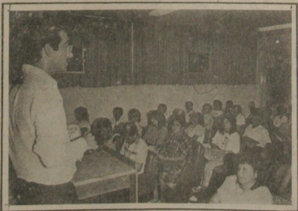
Flagrante da abertura do evento. (foto Lulz Carlos Moreira).

Teve início nesta segunda-feira dia 04 de abril, às 19:30 horas, o Ciclo de Palestras sobre Imposto de Renda promovido pelo Conselho Regional de Contabilidade de Sergipe em convênio com o NESAF, destinado a Técnicos da área Contábil e financeira, com o objetivo de atualizar esses profissionais quanto as recentes alterações sobre o assunto.