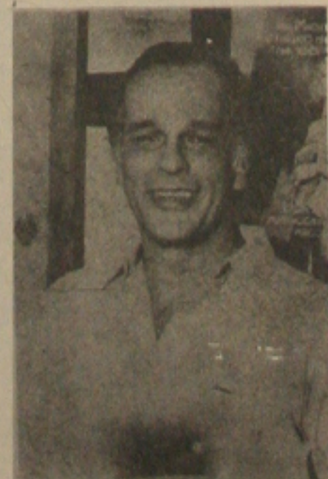
Fernanda Montenegro e Nelson Pereira dos Santos são destaques da segunda parte de Gente Muito Importante — Os Artistas.

Ainda na segunda parte de Gente Muito Importante , Marcelo Mastroiani, o grande astro italiano e protagonista de inúmeros filmes de Fellini; Yves Montand, o cantor e ator francês, que ultimamente deixou de lado as artes para se dedicar exclusivamente à política, o seu mais recente amor, e Vittorio Gassman falam do seu trabalho, da vida e da arte. A arte que os une.