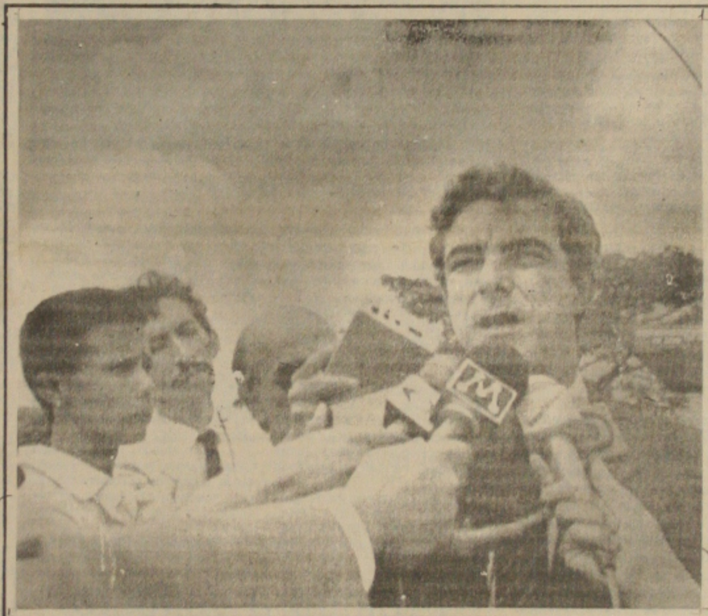
Brasília - Ministro Costa Couto fala à imprensa, após encontro com o Presidente José Sarney, no Palácio da Alvorada.

Durante a sua convenção, o PFL também elegeu seus 71 membros efetivos, 24 suplentes e os 10 suplentes à Convenção Nacional da agremiação partidária, através de uma chapa única.