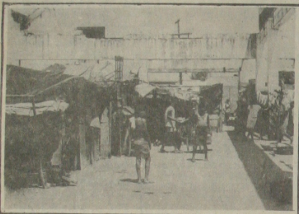
Favela localizada na rua Santa Catarina, no bairro Siqueira Campos.

Vem crescendo de maneira assustadora a favela da rua Santa Catarina, localizada no Bairro Siqueira Campos. O problema vem se arrastando através dos anos sem que as autoridades tomem uma providência no sentido de tornar possível o alojamento dos favelados, que ali se encontram totalmente abandonados.