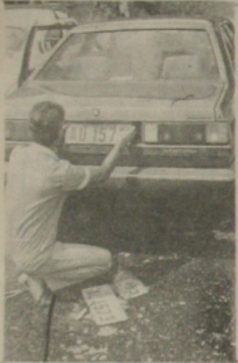
Mais dois carros com chassi adulterados foram descobertos pelos peritos.