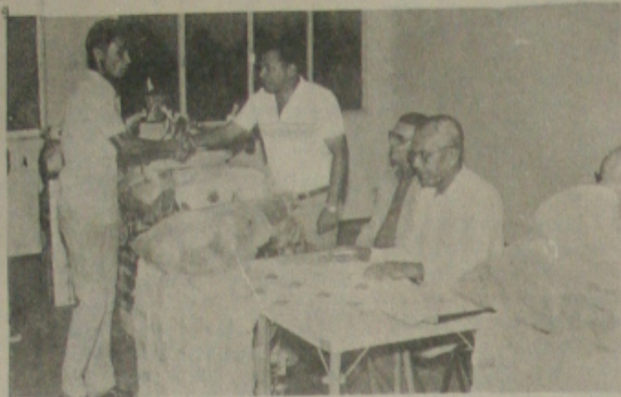
SESI EM EVIDÊNCIA

O Serviço Social da Indústria-SESI, sempre seguindo o seu principal objetivo que é o social. E dentro do social, ou seja, a valorização do trabalhador, está o incentivo ao esporte amador. A foto ilustrada pelo