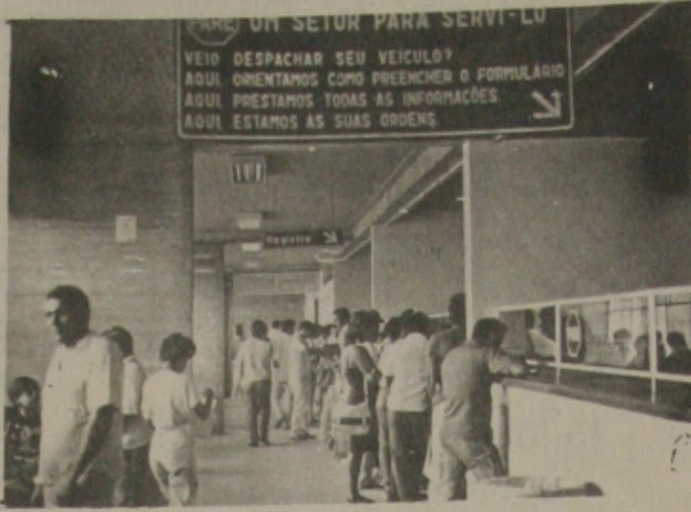
Aqui é onde legaliza os carros roubados.