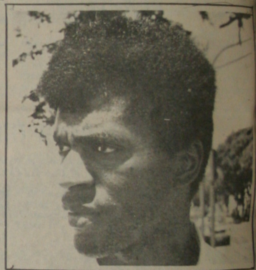
... e mostraremos isto ao público amanhã à noite no Teatro Atheneu.