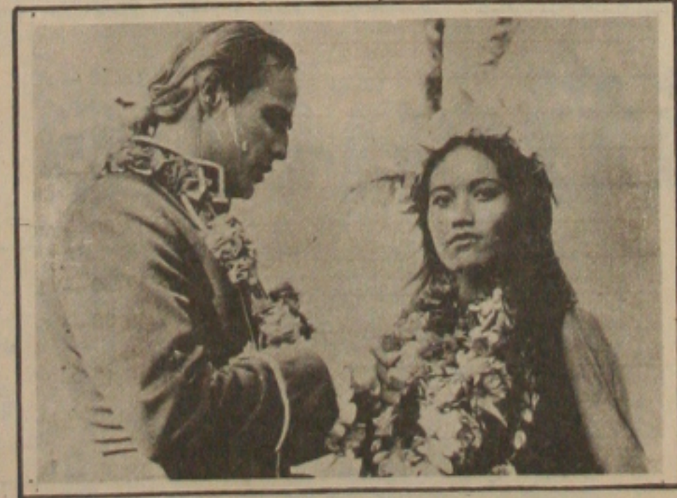
Marlon Brando em cenas de O Grande Motim.

ROBIN HOOD DE CHICAGO Título Original: Robin and the Se- ven Hoods Nacionalidade: Americana Ano de Produção: 1964 Direção: Gordon Douglas Elenco: Franck Sinatra, Dean Mar- tin, Sammy Davis Jr., Peter Falk, Bar- bara Rush, Victor Buono, Bing Crosby Hank Henry, Allen Jenkins, Edward G. Robinson. Chicago, anos 20. Com o fim da car- reira do poderoso chefe Big Jim (Robi- nson), o gangster Guy Gisborne (Falk) decide assumir o controle da ci- dade, mas encontra a forte resistência do protegido de Big Jim, Robbo (Sina- tra) e seus asseclas John (Martin), Will (Davis Jr.) e Six Seconds (Henry). Estabelece-se a rivalidade entre as duas quadrilhas com brigas e amea- ças mútuas. A filha de Big Jim (Rush) oferece 50 mil dólares a Robbo para vingar o pai, mas o dinheiro vai parar