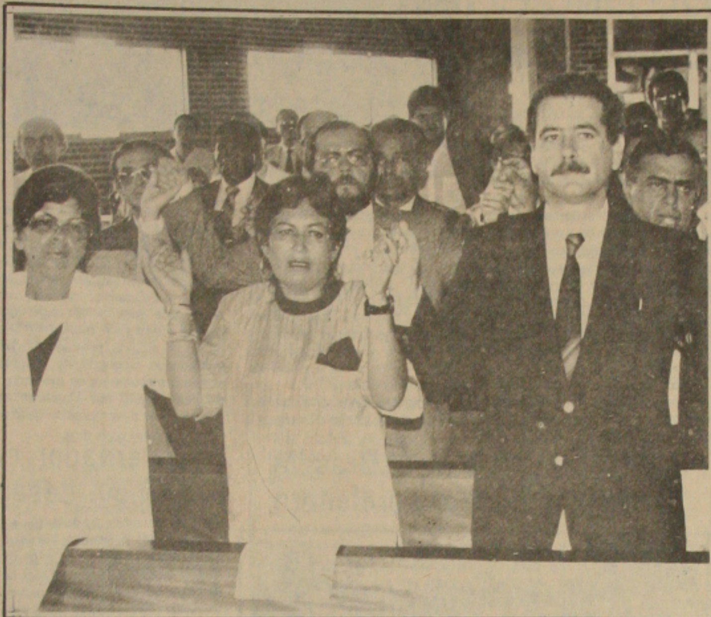
Diversas autoridades estiveram na Igreja dos Capuchinhos.

Durante a missa que praticante lotou a Igreja São Tadeu, o Governador em exercício, Benedito Figueiredo, leu um trecho dos apóstolos, o mesmo recitando com o Secretário José Sizio da Rocha e outros militares do Governo Antônio Carlos Valadares, muitos dos quais comungaram durante o ato religioso celebrado em memória a Tancredo Neves - o tir da democracia.