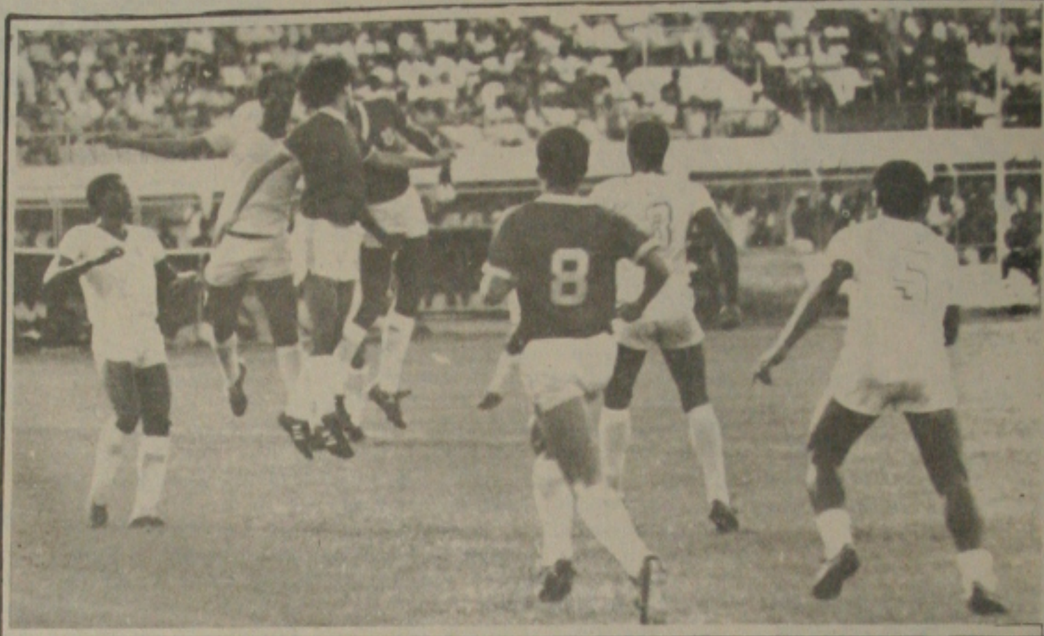
Domingo é dia de clássico no Batistão. Sergipe e Confiança decidem a Copa Cidade de Aracaju.