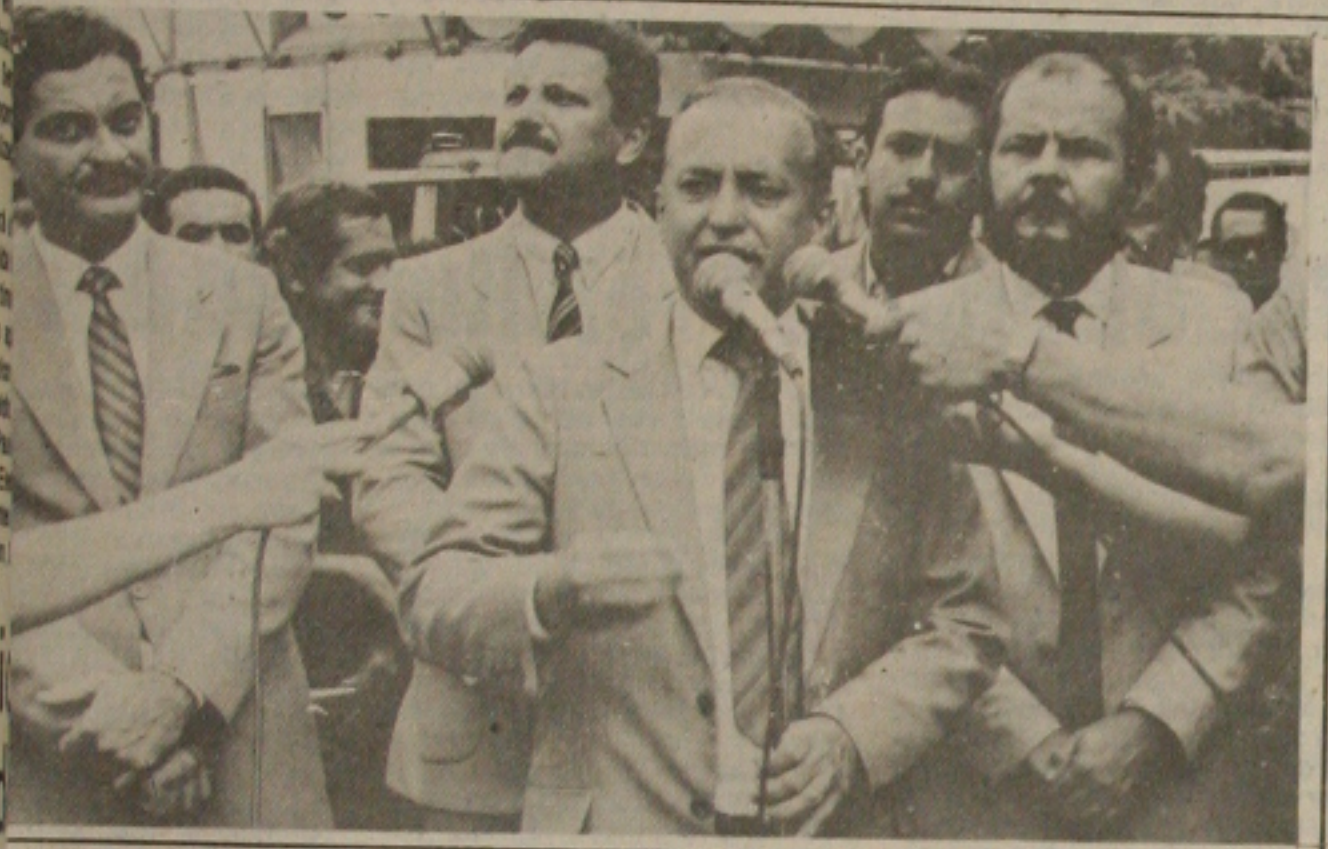
Valadares discursou na Praça Fausto Cardoso.

"Quem disse ontem que eu estava impedido de ir às ruas hoje está decepcionado, pois aqui estou na praça junto com o povo". Foi o que afirmou o Governador Antonio Carlos Valadares, na Praça Fausto Cardoso, na manhã de ontem, após vistoriar 26 tratores e implementos agrícolas adquiridos pelo Governo do Estado para o setor agrícola sergipano, dando prosseguimento ao Projeto Campo Verde.