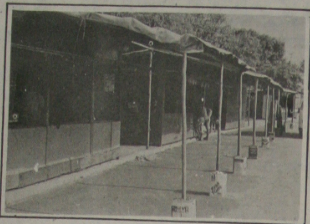
As barracas estão agora na Praça dos Expedicionários, mas o movimento ainda está fraco.

As conchurrentes barracas que aparecem pela cidade nos meses de maio e junho, já podem ser notadas, repletas de fogos de artifícios dos mais variados tipos. É a chegada do "São João" que se aproxima, trazendo uma oportunidade de ganho para os pequenos comerciantes e diversão para o resto da população.