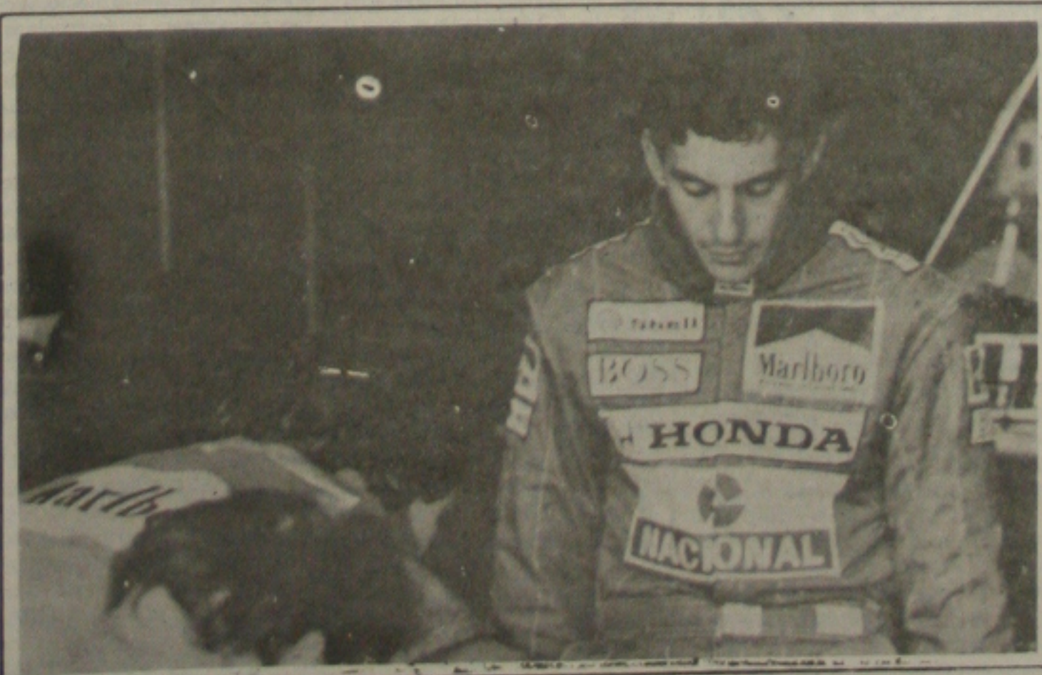
Senna observa a montagem do McLaren.

Nesta edição, você leitor encontrará a GAZETINHA a cores, com Pedrito Barreto, programação de TV, filmes na TV, e todas as outras seções que fizeram a GAZETINHA o caderno de variedades preferido. Ainda nesta edição, os CLASSIFICADOS GS, o melhor caderno de anúncios classificados da cidade, com tudo o que você procura para comprar, vender, alugar ou trocar. Um bom domingo leitor.