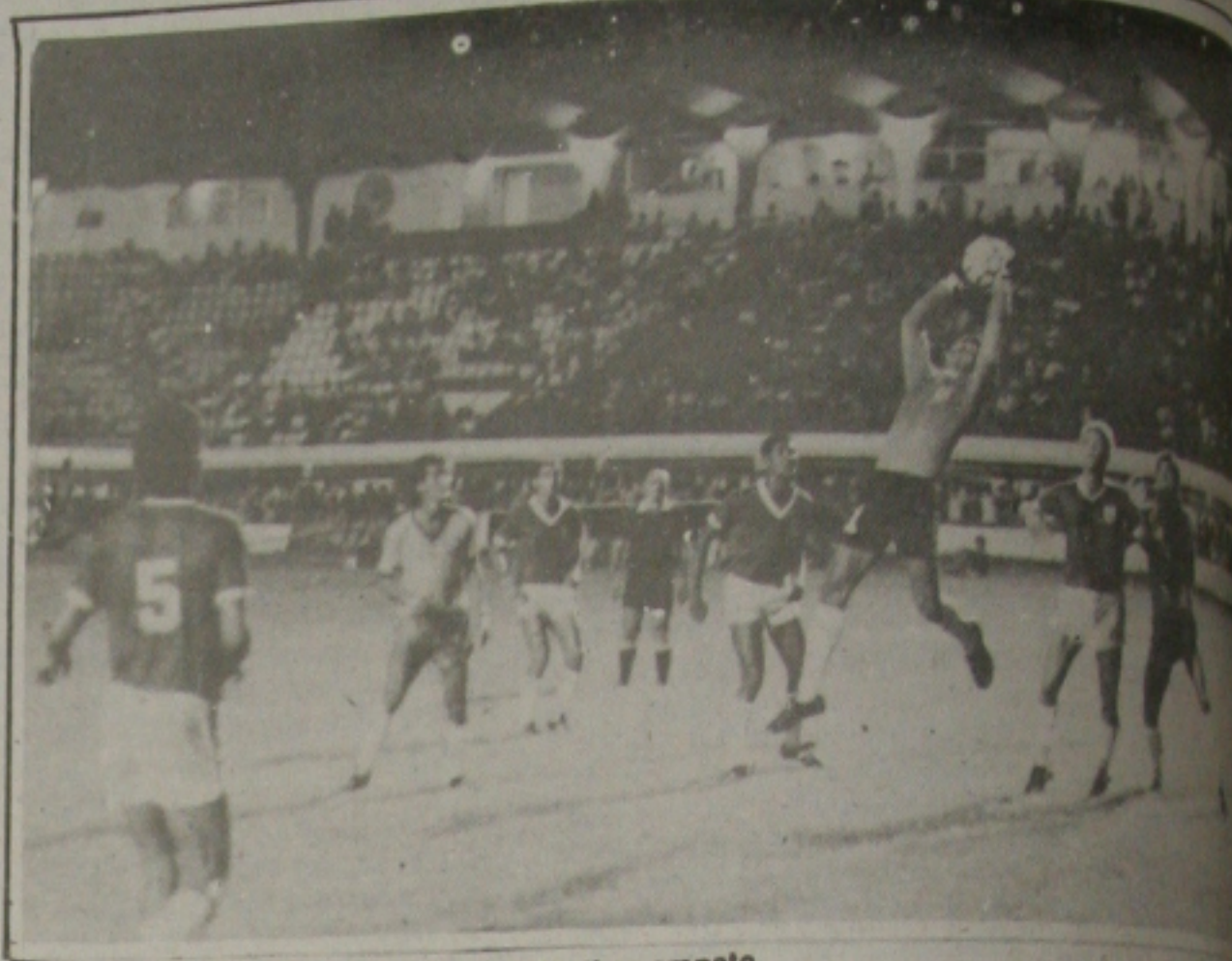
A defesa do Sergipe esteve bem e garantiu o empate.