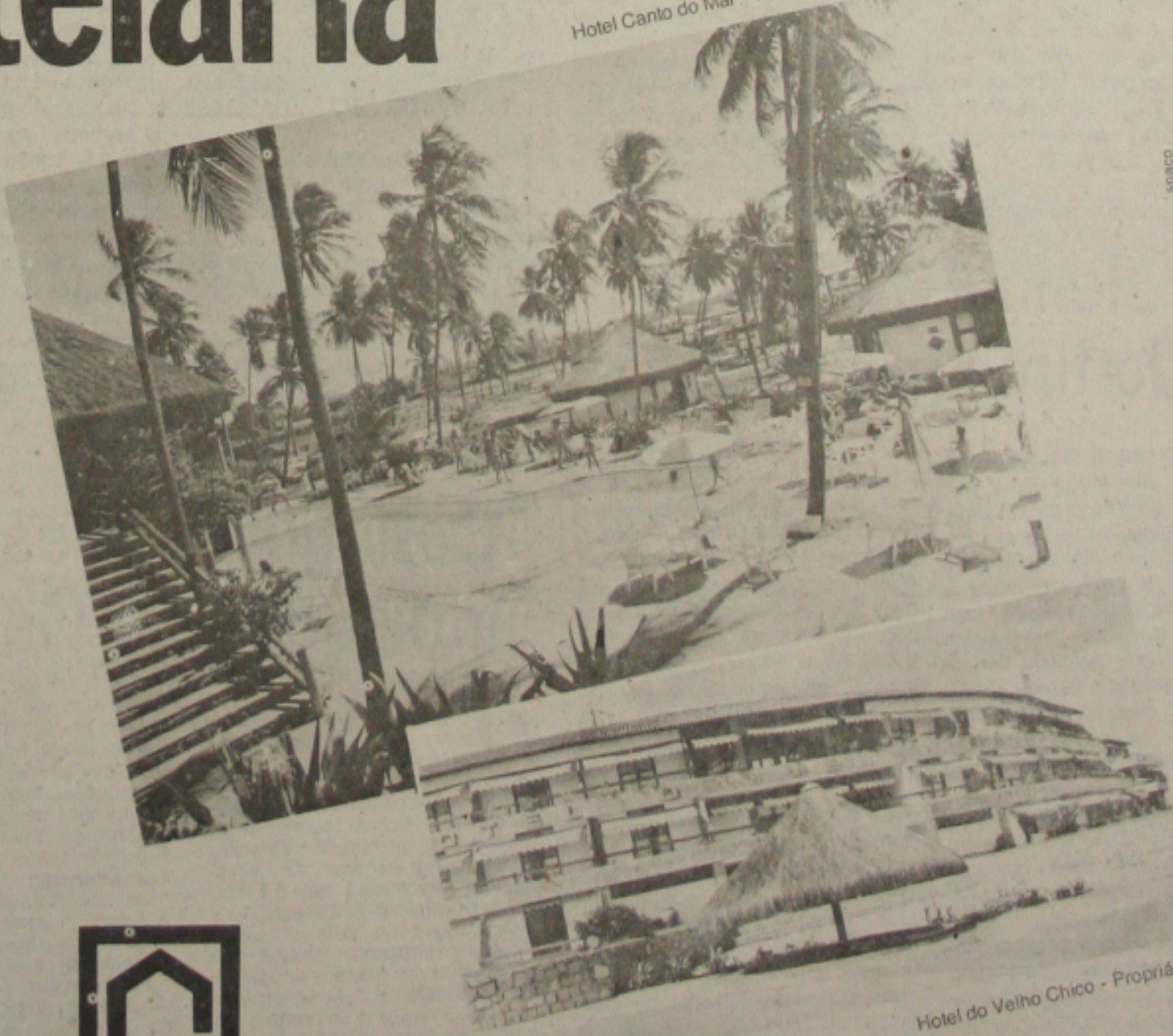
Hotel do Velho Chico - Propriá