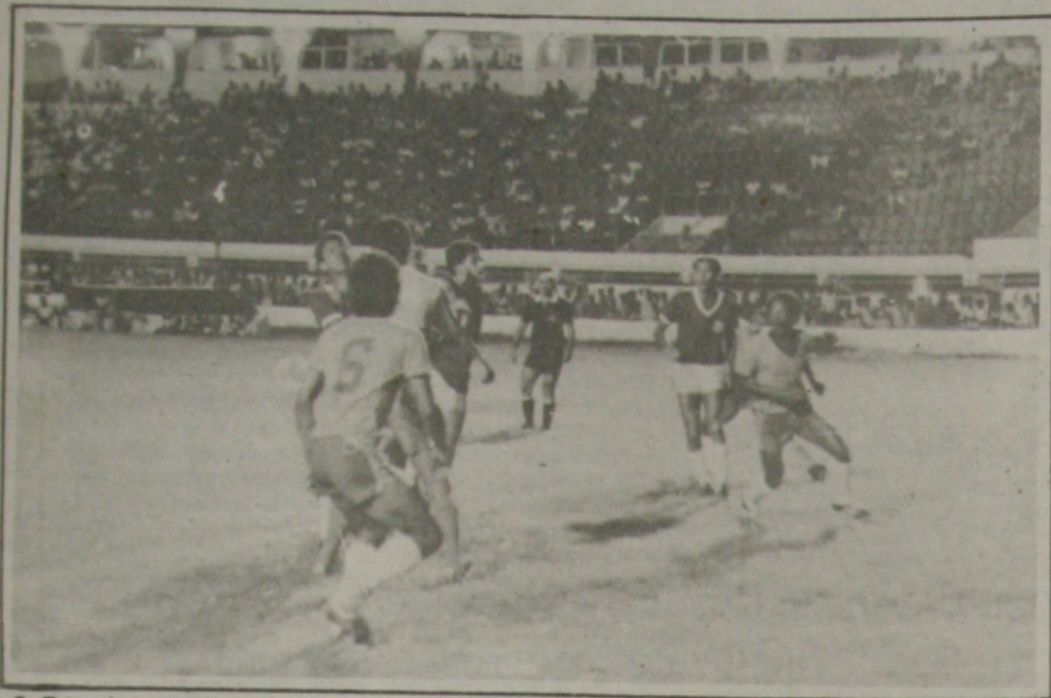
O Estanciano mostrou ser um time decisivo.