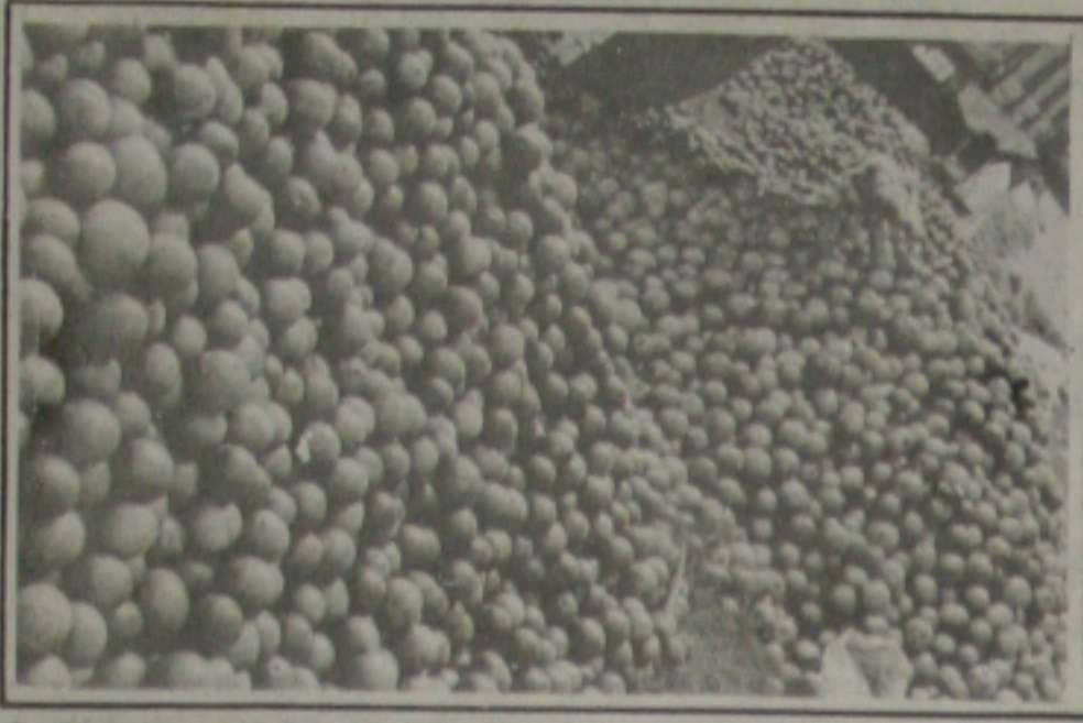
As laranjas estão reaparecendo na Ceasa.