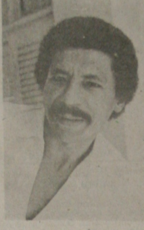
Veludo morto com mais de 50 tiros.