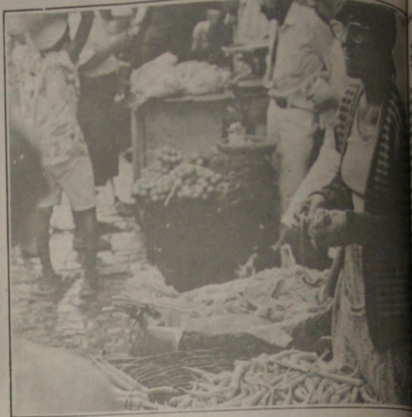
As feirantes dizem que não estão tendo lucro.

justificou os aumentos consecutivos, dizendo que, eles não têm culpa, pois são os fornecedores que renovam os preços da mercadoria, alegando o aumento dos combustíveis. Explicou ainda que, a maioria dos produtos vem de outros Estados. Como a batatinha, a cenoura e o tomate, que vêm de Pernambuco; a ce-