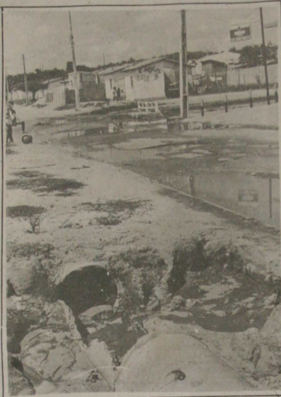
As ruas estão esburacadas e a rede de esgotos danificada.