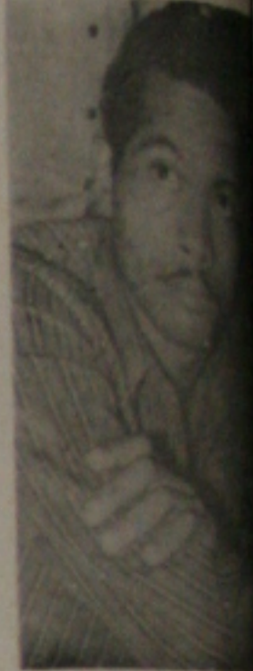
com Sena voltaram