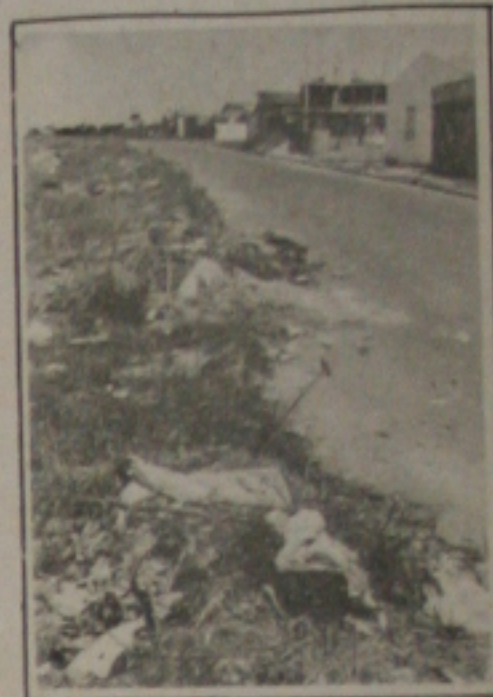
A coleta de lixo deixa muito a desejar.