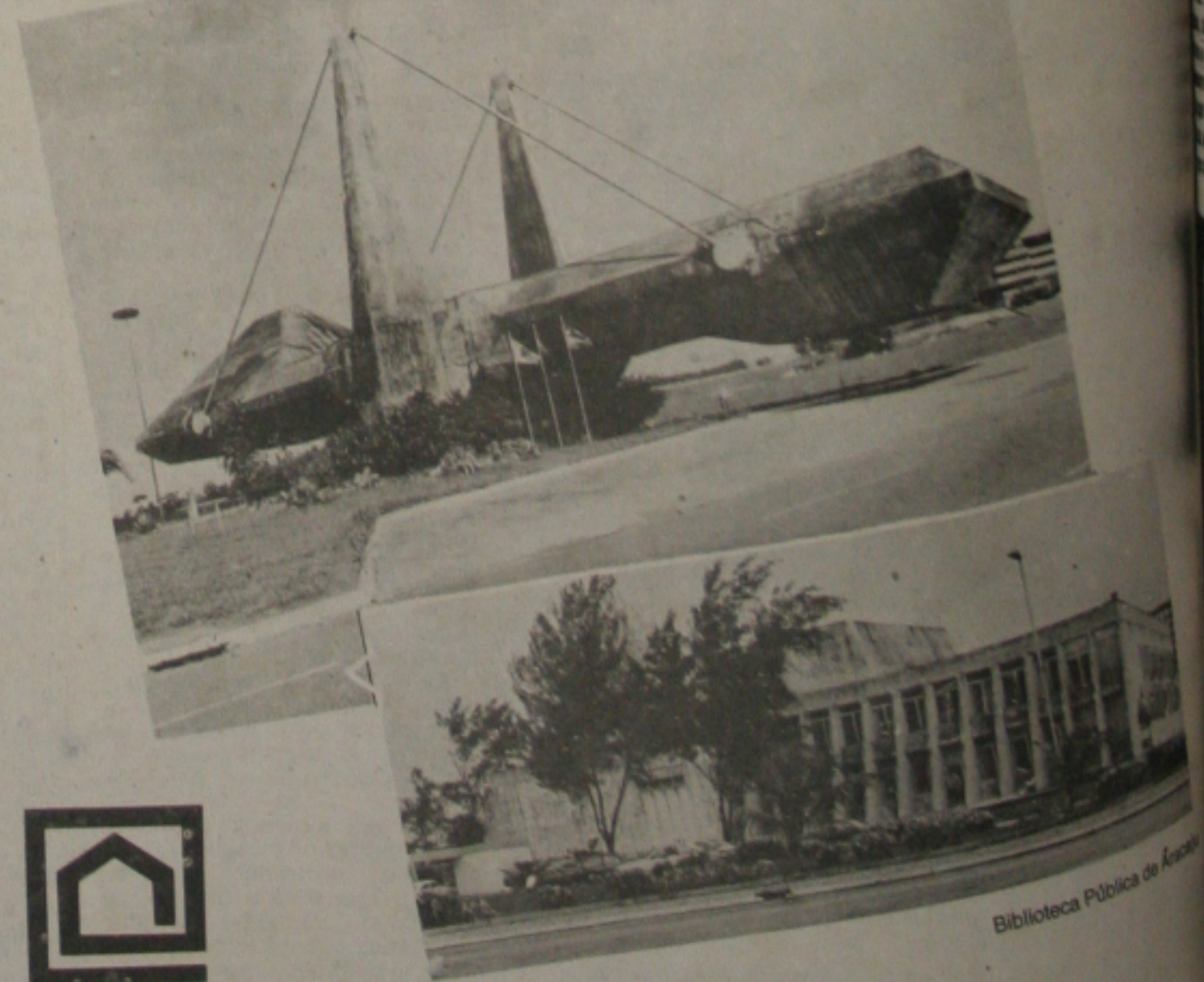
Balança do Centro Administrativo - Salvador.