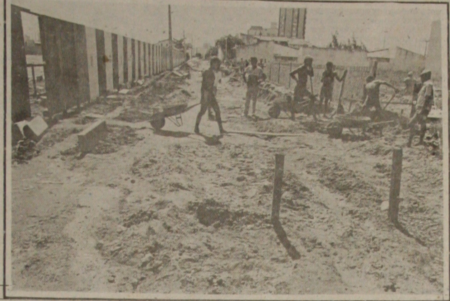
Rua Teófilo Otoni está sendo "concluída".

CEF informou ontem que, em razão do feriado de segunda-feira, dia 29 de maio, a Sena foi transferida para a terça-feira, dia 31.