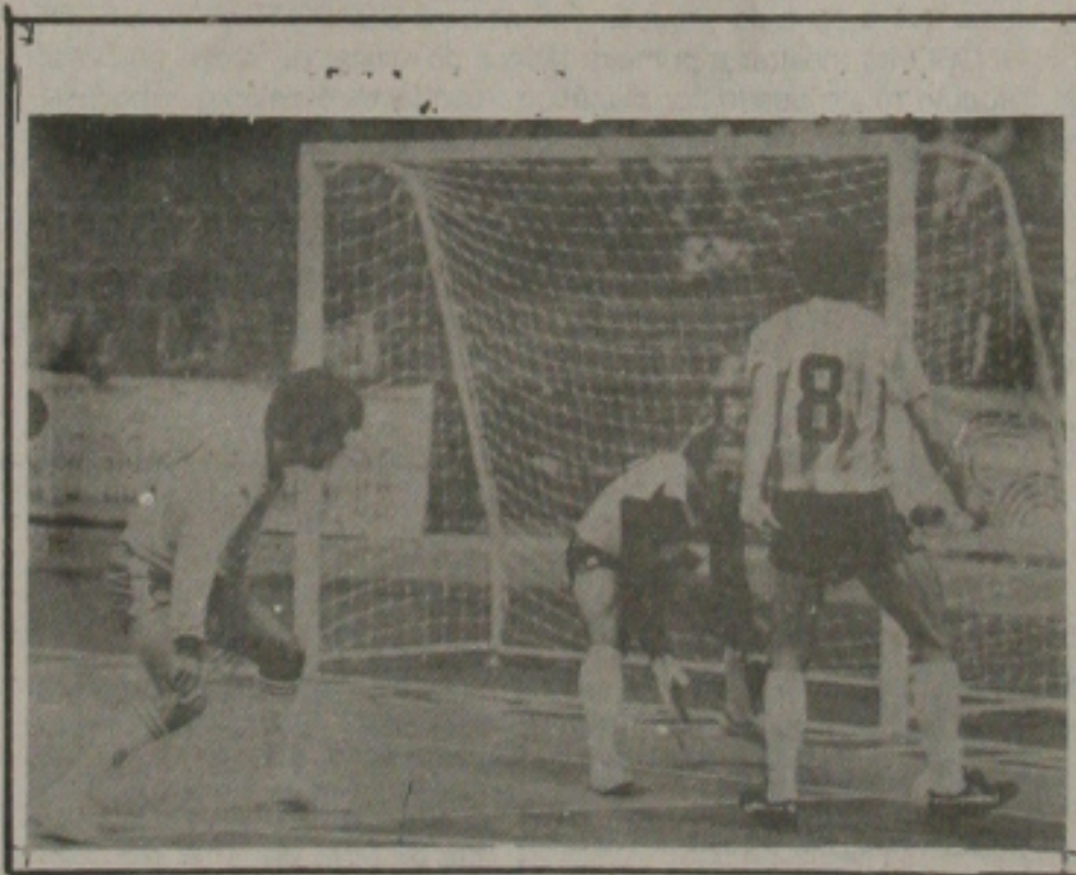
As melhores equipes de futebol de salão, com transmissões exclusivas.

O Torneio Master de Futebol de Salão, evento que reúne as principais equipes de futebol de salão, será transmitido entre os dias 28 de maio e 5 de junho, com a narração de Alberto Léo, diretor do Departamento de Esporte da emissora. Participarão do torneio as equipes do Bradesco, Tigre, General Motors, Curitiba, Banorte, Perdígão, Enxuta, Banespa, Bordon e Bangu.