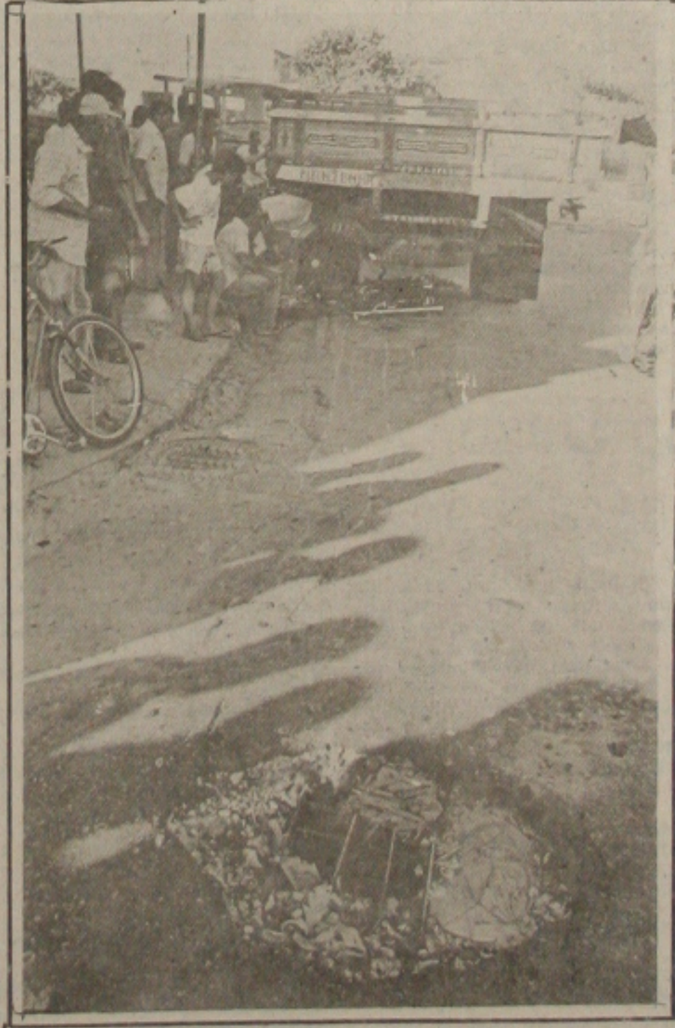
A moto foi esmagada pelo caminhão.