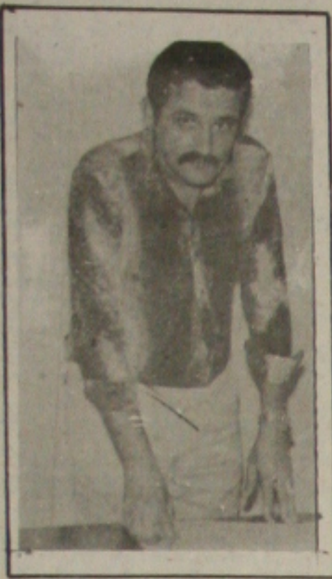
Machado diz que os constituintes querem a prorrogação, mas têm medo do povo, agora, e nas próximas eleições.

dos ferrenhos defensores municipais este ano, é postulante a sucessão Ignácio Barbosa, o líder da Assembléia Legislativa, José Carlos Machado, que dificilmente o pleito, acrescentando que muitas vezes estão com medo de assumir a prorrogação dos mandatos municipais, pois sabem que o povo, mais uma vez, não vai gostar.