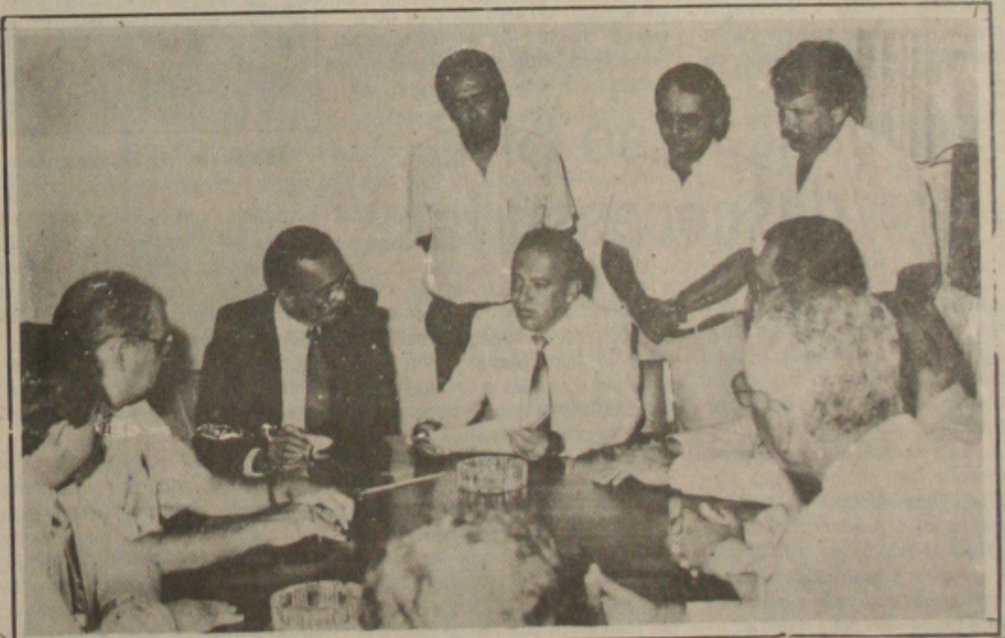
Dirigentes das entidades que congregam o empresariado sergipano, foram ontem ao Palácio Olímpio Campos, e entregaram ao Governador Valadares documento cumprimentando pela forma como o governador conduziu o processo de decretação da intervenção estadual nas Prefeituras de Aracaju e Capela. (pág. 05).

Ontem, por volta das 23 horas, checou as redações um release em que o Secretário Normam Oliveira, negou que o Governo esteja promovendo "trem da alegria".