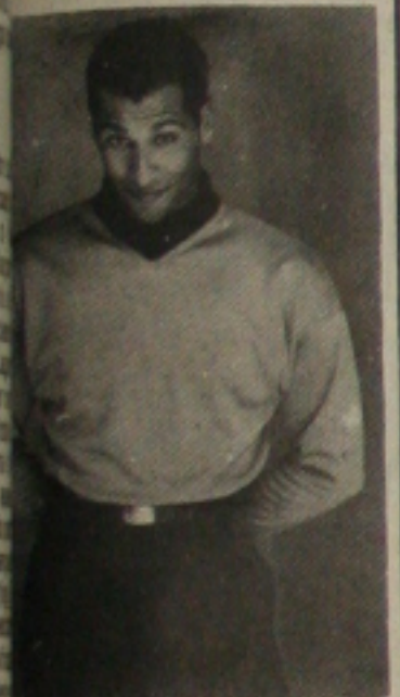
Pullover decote "V" e de gola Olímpica em malha mohair. Calça em gabardine.

Padrões: Xadrezes (tradicional, escocês, madras, chevron, pied de poule, príncipe de galles), mesclas, bicolores, aspectos fepados, estampas minimalistas e padronagem clássica masculina em geral.