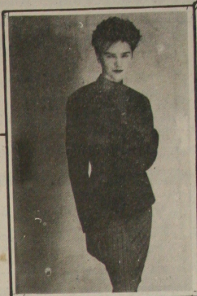
Saia e blusa em tecido stretch com lycra e algodão listrado. Paletô acinturado.

Nesta estação as calças reaparecem em quantidade, como sempre, quando existe um momento de indecisão quanto a que comprimento adotar. Elas podem ser largas com pregas em tecido no estilo masculino, ou em jerseys e crepes, ou justas, feitas nos novíssimos tecidos "stretch".