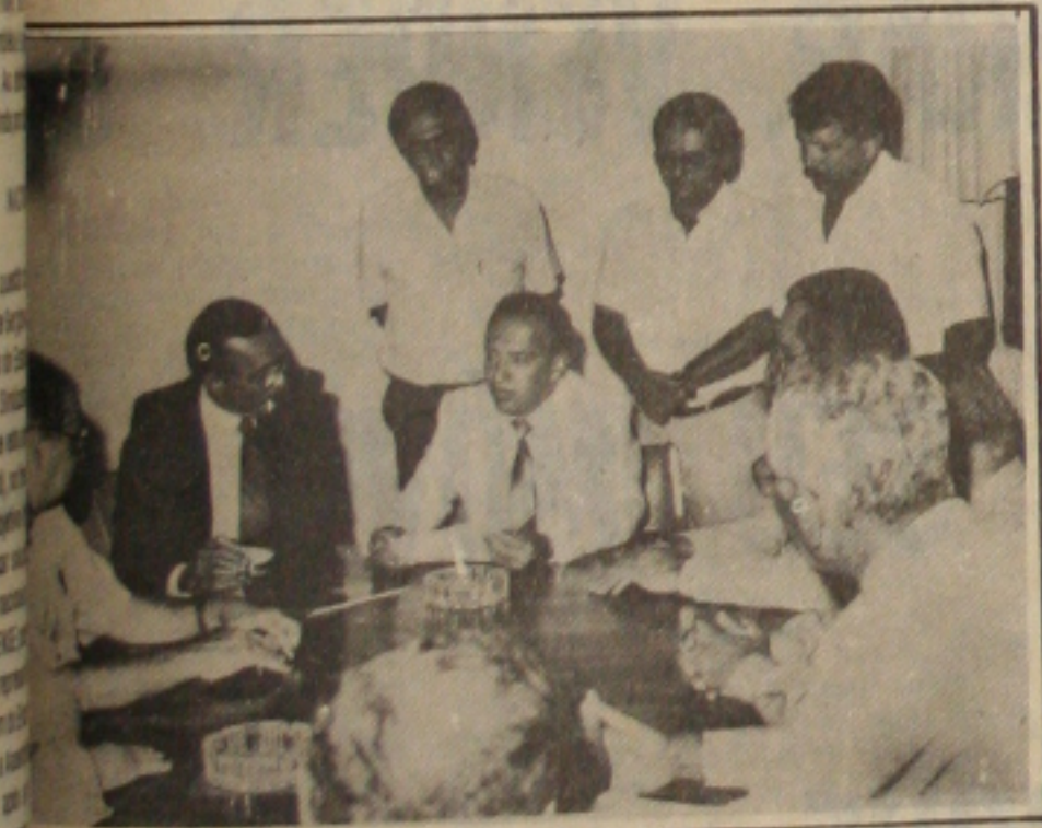
Governador recebe a solidariedade dos empresários

O Governador Antônio Carlos Valadares recebeu ontem à tarde, em seu gabinete, no Palácio Olímpio Campos, uma comissão de lideranças empresariais sergipanas que lhe foram entregar um documento de solidariedade pela postura que adotou no episódio da intervenção na Prefeitura de Aracaju. No documento, os empresários elogiam a seriedade com que o Governador encaminhou a questão e a escolha de um técnico para, na função de interventor, promover o saneamento das finanças municipais. Valadares disse à comissão de empresários que em seu lugar qualquer Governador tomaria decisão semelhante, se quisesse respeitar a Constituição e agir como um magistrado.