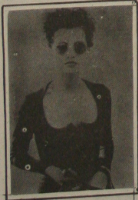
Decote coração no vestido/lua em malha dupla "stretch" em acrílico lã.

Severidade Sóbrio e austero, com alguns toques de alta costura totalmente atualizados, abotoamentos e barras assimétricos, pregas localizadas, transpasses, mangas volumosas, saias amplas e punhos brancos sobre tons sombrios.