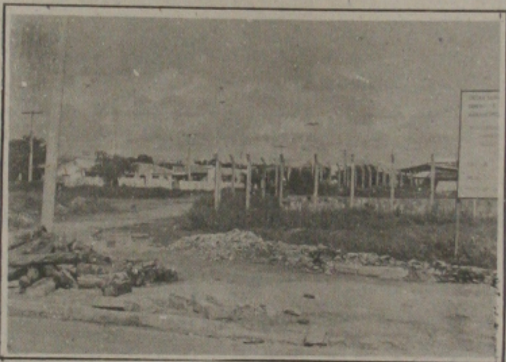
Moradores do JK aguardam conclusão das obras da praça.

Os moradores dos Conjuntos JK e Sol Nascente, continuam aguardando a decisão da Prefeitura de Aracaju, em concluir as obras de construção da praça central daqueles núcleos habitacionais, que há mais de um ano está em andamento, mas sofreu uma paralisação inexplicável para seus moradores.