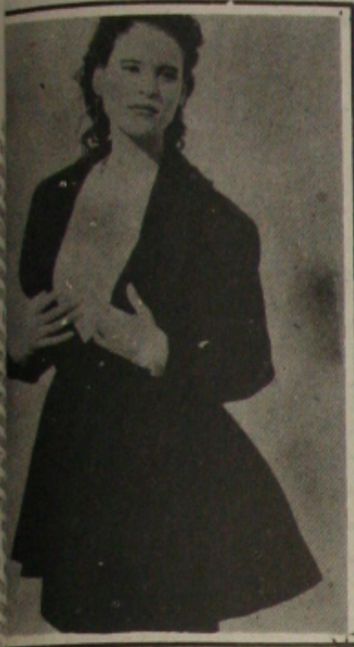
Curta redingote godê com gola xale e saia reta. Ambas em malha (quase tecido) usadas com t-shirt em viscose.

Inverno 88 dá continuidade a um novo estilo na moda iniciado no Verão de 87. Inspirado na Alta Costura, principalmente a dos anos 50, marca o afastamento definitivo da angulosa influência da alfataria masculina, que influenciou por tanto tempo a maneira de vestir feminina desta década.