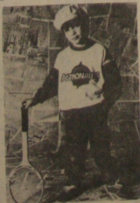
Linha Young Astronauts Adidas

Os modelos são encontrados nos tamanhos 33 a 45 e nas cores: