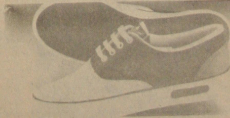
Linha Yachting Adidas

Detalhes como mangas em cores contrastantes, frente fechada por botões de pressão oxidados e punhos, golas e bainhas em canelado bicolor dão à linha College muita harmonia.