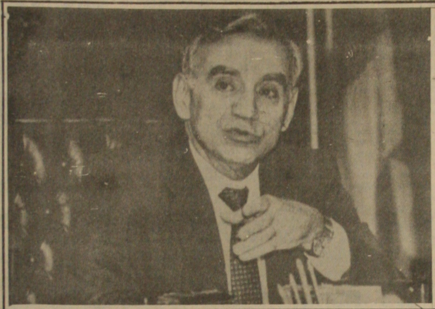
O Presidente da Petrobrás Osires Silva, demitido por criticar a política econômica do Governo.