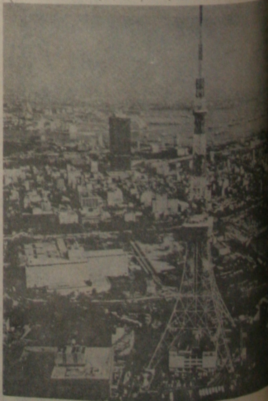
A magia do Japão é revelada na série que a Rede Manchete apresenta de 20 a 24 de junho, sempre às 22:30h.