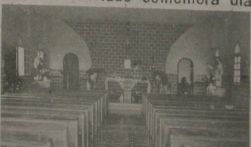
A festa dos padroeiros São Paulo e São Pedro será comemorada por um tríduo, ou seja, por 3 dias, iniciando amanhã, dia 30 e prosseguindo até o próximo domingo dia 03 de julho, na Igreja São Pedro e São Paulo, localizada na Praia 13 de julho. Há

O produtor beneficiado pelo programa, além de receber o lote de animais recebe assistência técnica dos médicos veterinários e dos técnicos agrícolas da SUDAP que mantêm escritórios em todas as cidades.