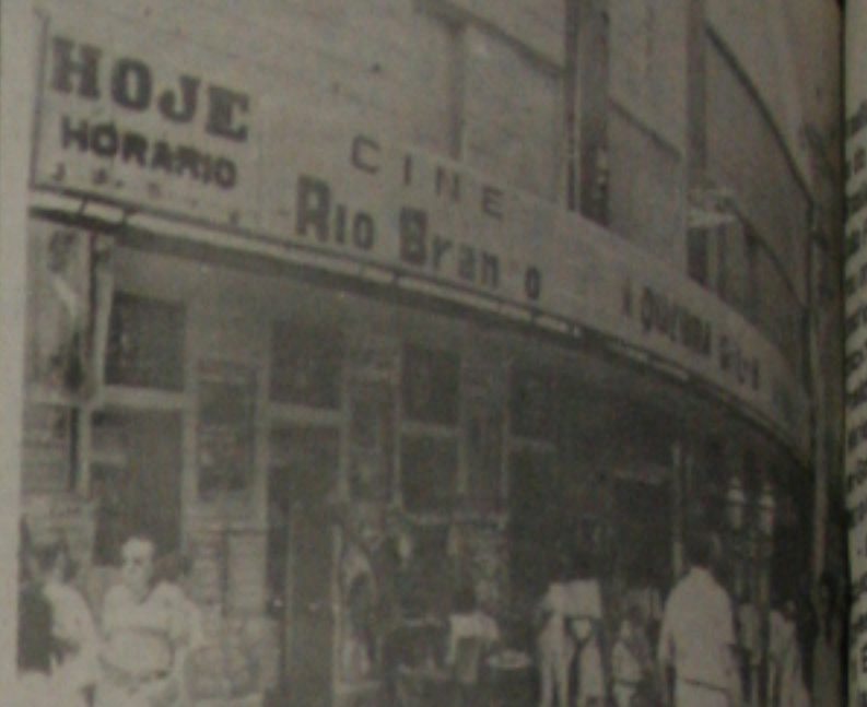
O prédio onde funciona o Cine Rio Branco poderá ser tombado.

O tombamento do prédio onde funciona hoje o Cine Rio Branco, palco das grandes manifestações culturais do Estado, será definido dentro dos próximos trinta dias. O processo está nas mãos do Governador Antonio Carlos Valadares, desde a última quinta-feira para que ele dê a palavra final sobre o assunto.