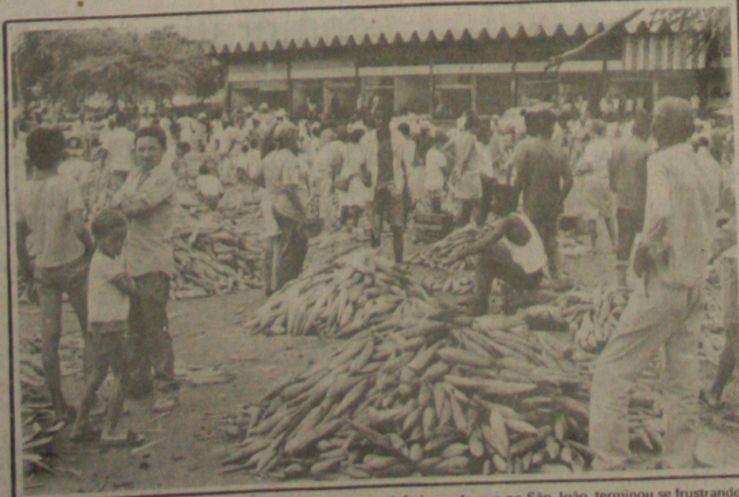
Quem esperava comprar milho no São Pedro a preços inferiores do que no São João, terminou se frustrando. É que a quantidade de milho recebida ontem pela CEASA foi bem inferior a procura e com isso os preços estiveram bem acima dos da semana passada. O atilho foi vendido entre 25 e 80 cruzados, enquanto que mão ficou entre 300 e 1 mil e 500 cruzados. (Página 2)

Embora sem estimativa para julho, o presidente do IBGE supõe que a inflação continuará em níveis "indecentes" nos próximos meses, variando entre 18 e 20 por cento. Não acredita que as promoções no comércio, com congelamento de preços em redes de supermercado, possam contribuir para uma queda significativa na inflação. "Se houver influência, será de décimos percentuais".