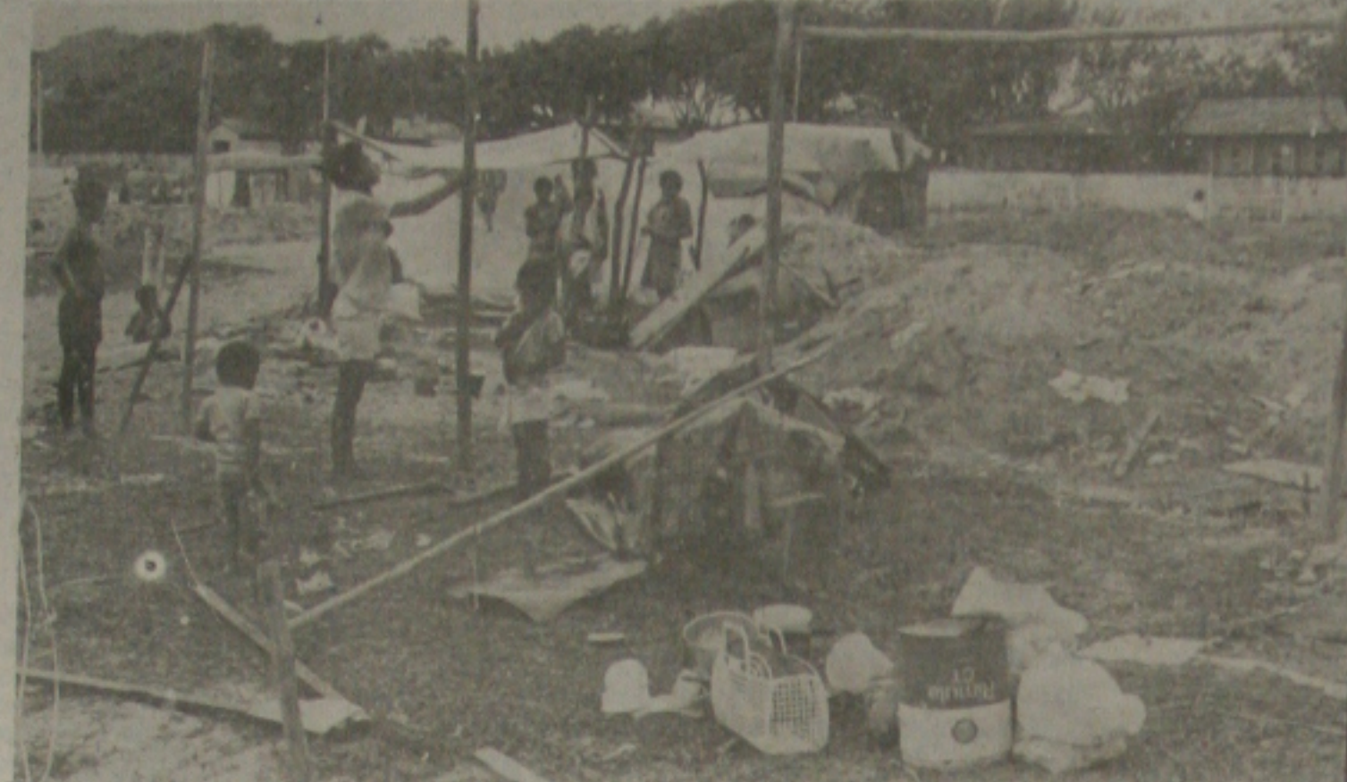
Os sem teto alojados em terreno baldio.

Os sem tetos despejados das casas construídas em regime de mutirão no Conjunto Sirl em Nossa Senhora do Socorro, hoje alojados precariamente num terreno baldio na rua Alagoas com frente as instalações do CSU, estão vivendo um clima tenso face às ameaças constantes das Polícias Militar e Civil que insistem em "visitá-los" durante a noite afirmando que as famílias a qualquer momento podem ser despejados do local mediante autorização judicial já que a proprietária do terreno, a Sociedade Anônima Constâncio Vieira, ganhou a causa na Justiça.