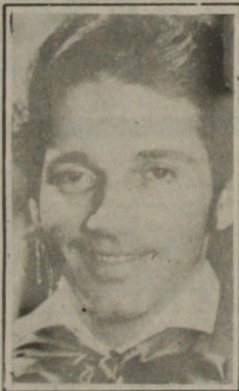
Beija e João Mendonça: a nova paixão de Araxá.

Josefa, já que é madrinha de Teresa Tomázia — a primeira filha de Beija — e agora será avó da segunda. Mesmo com a partida de Avelino — depois que Josefa resolve dar vazão à sua paixão entregando-se ao rapaz, José desconfia das atitudes da esposa. Numa noite em que Josefa se recusa a conversar com ele, José diz que já sabe de tudo e a chama de traidora. Josefa não tem como se defender. O marido afirma que não vai expulsá-la de casa para não tornar maior a vergonha da família. Mas diz que, a partir daquele momento, só falarão o que for essencial, pois Josefa matou todo o seu amor. Mesmo muito triste, Josefa concorda com a decisão do marido. Augusta continua a sofrer as consequências de suas maldades. O marido — Costa Pinto — não lhe dá mais atenção e passa as noites na casa de Cadinha da Serra, enquanto a filha Carminha só consegue vê-la raramente, escondida do marido. Mesmo assim, a maldosa Augusta só tem um propósito: encontrar o ouro que Costa Pinto guarda em algum lugar, para poder vingar-se do marido.