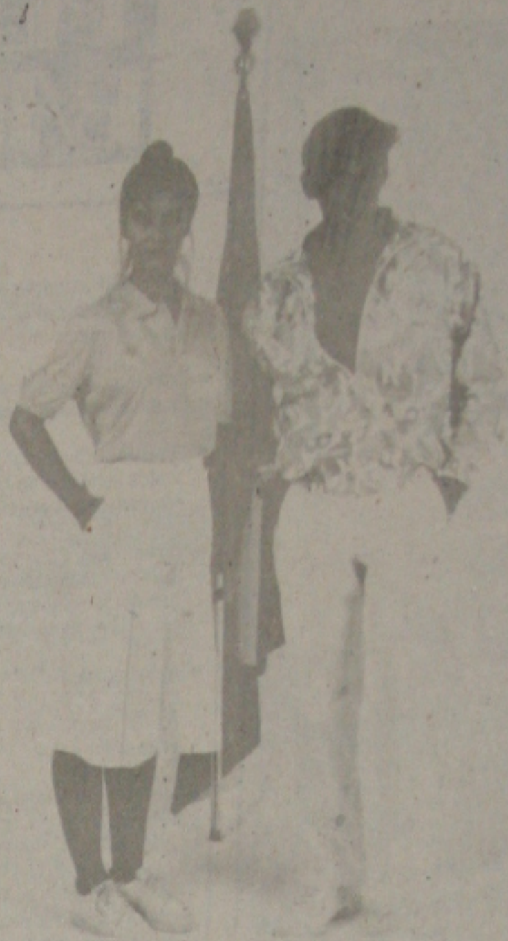
Roupa para o Desfile de Abertura, criada pela Adidas.

O COB — Comitê Olímpico Brasileiro apresentou no dia 23 de junho, Dia Olímpico Internacional, os uniformes que os atletas brasileiros estarão usando durante os Jogos Olímpicos de Seul.