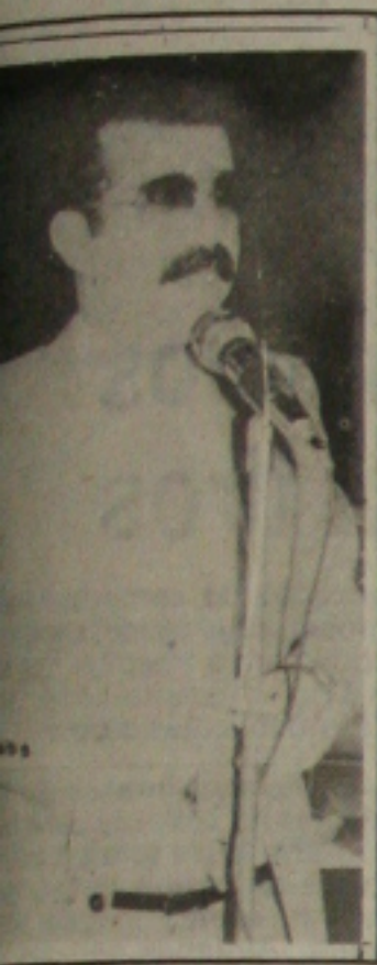
Reinaldo Moura, secretário do PSB em Aracaju, realizará até amanhã para se definir o ingresso no PSB e disputar a eleição municipal de Aracaju.

Reinaldo tem até amanhã para definir o ingresso no PSB e disputar eleição