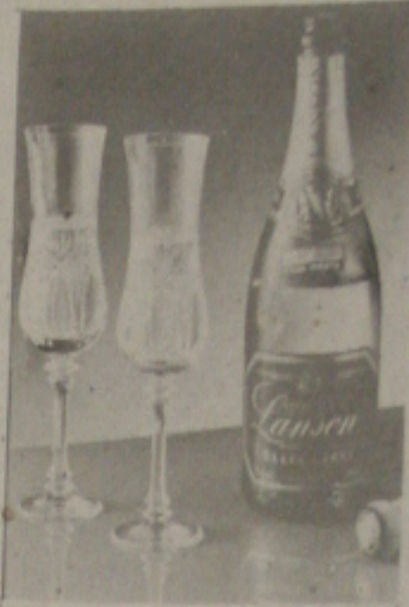
Champanhe, o drinque mais romântico do mundo.