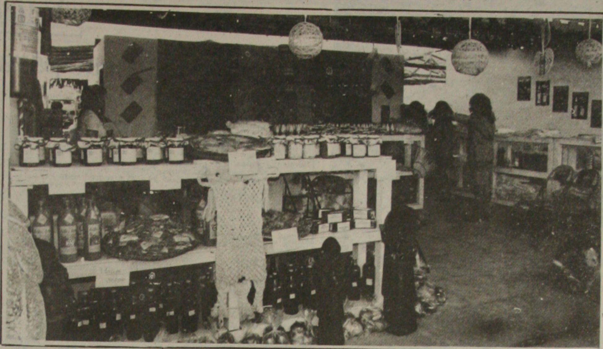
Barraca de Sergipe, na Feira dos Estados realizada em Brasília