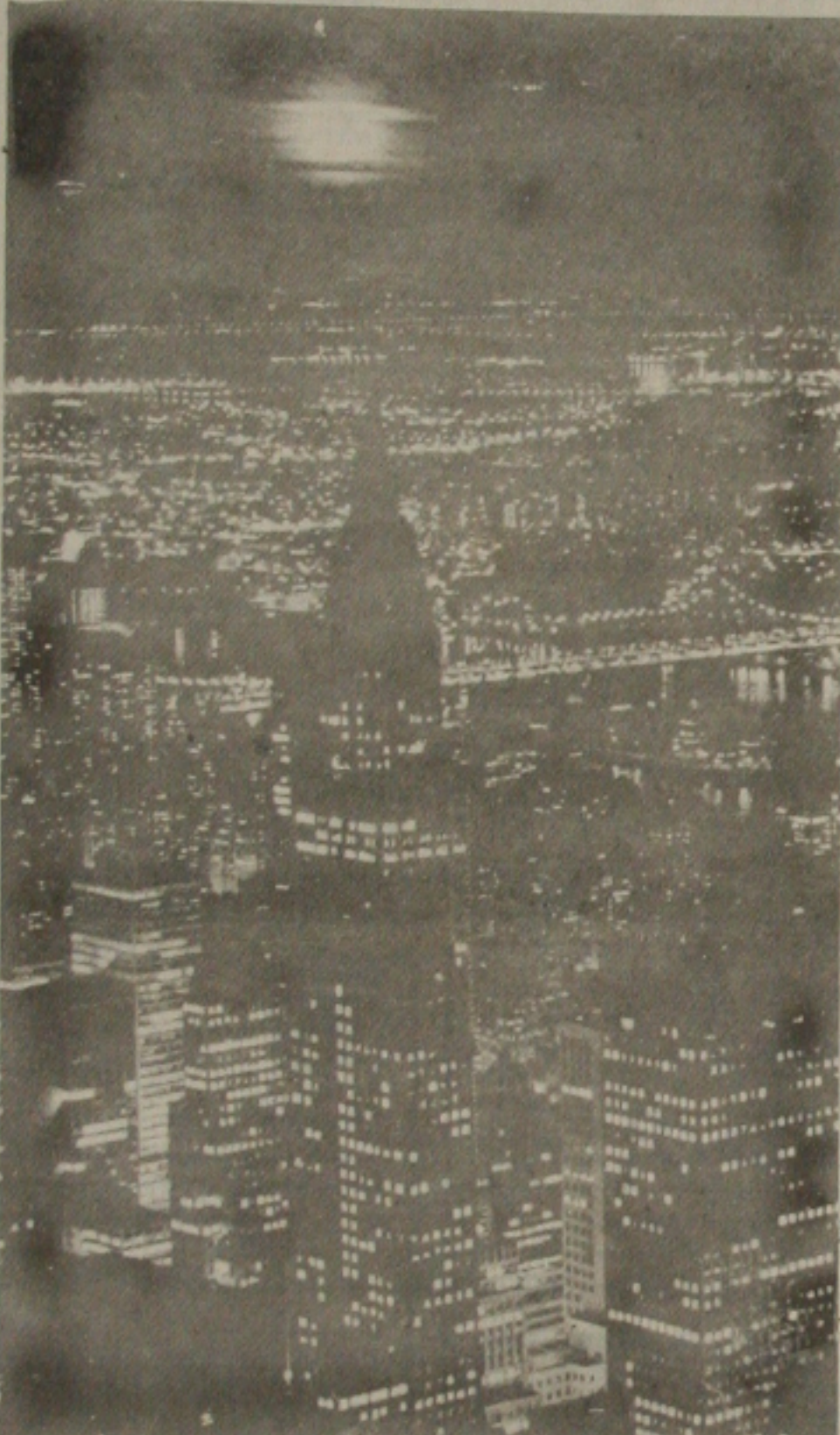
Todo o charme e agitação cultural de Manhattan estão no novo programa da Rede Manchete.