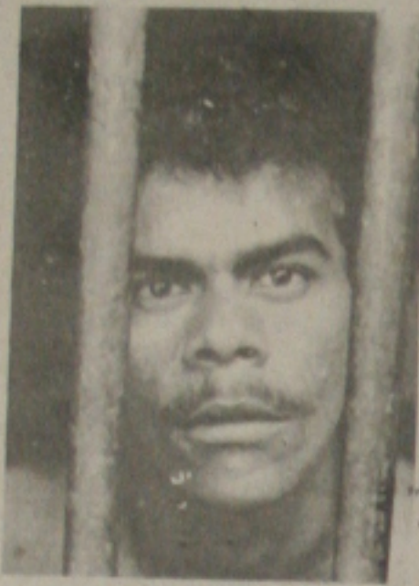
Traficante é preso com doze cartuchos de maconha

tos após a prisão, devendo o marginal seguir ainda hoje para o Reformatório Penal, onde aguardará a decisão da Justiça.