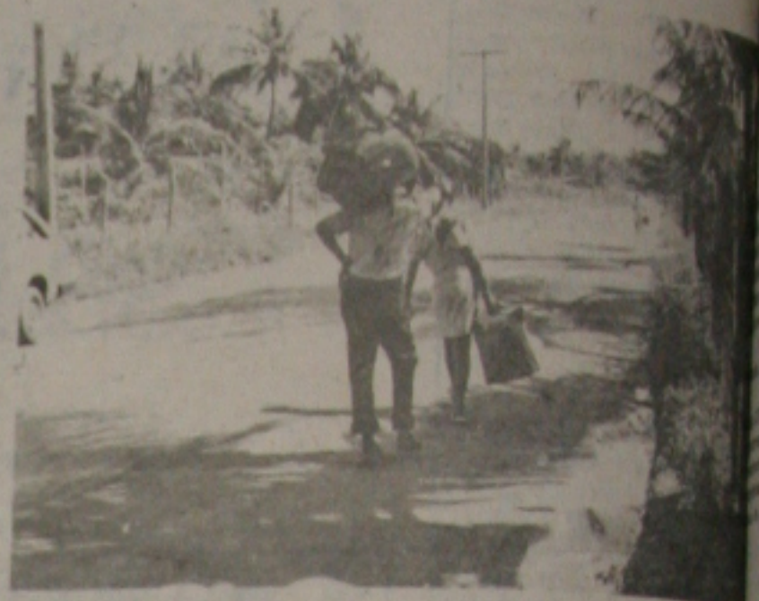
Os moradores do povoado Areia Branca andam até cerca de 2 quilômetros, devido a esta situação.