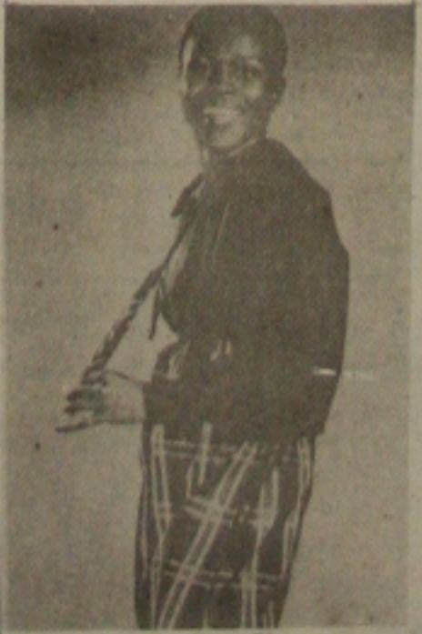
Cicely Tyson lutando contra preconceitos em Só Uma Velha e Doce Canção .