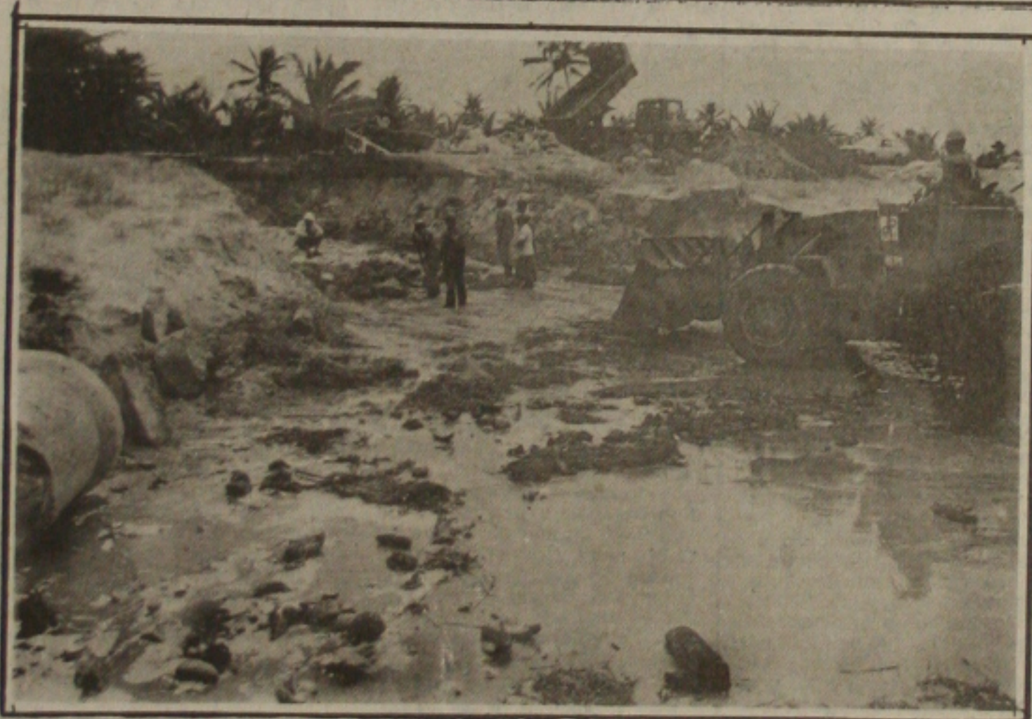
Rodovia José Sarney interditada parcialmente em decorrência das chuvas que caem em Sergipe.

Aracaju - Realizate 1,01 por cento CDB 215,07 CDB 214,96 CDB 214,96 CDB 214,96 CDB 214,96 CDB 214,96 CDB 214,96 CDB 214,96