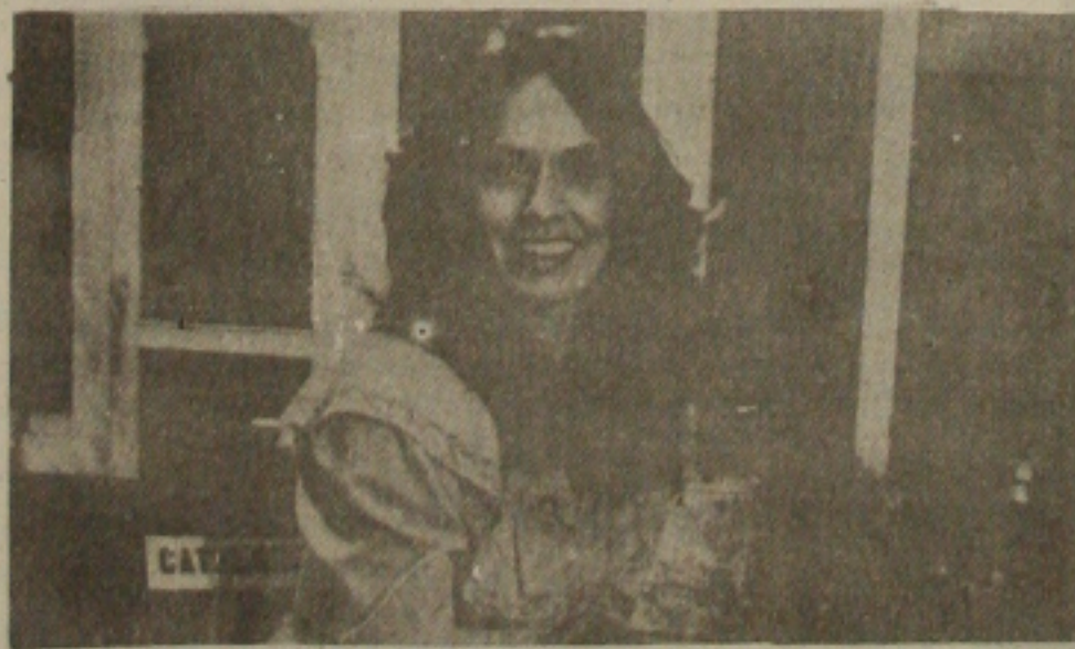
O Rebelde das Cordeiras traz Catherine Bach.