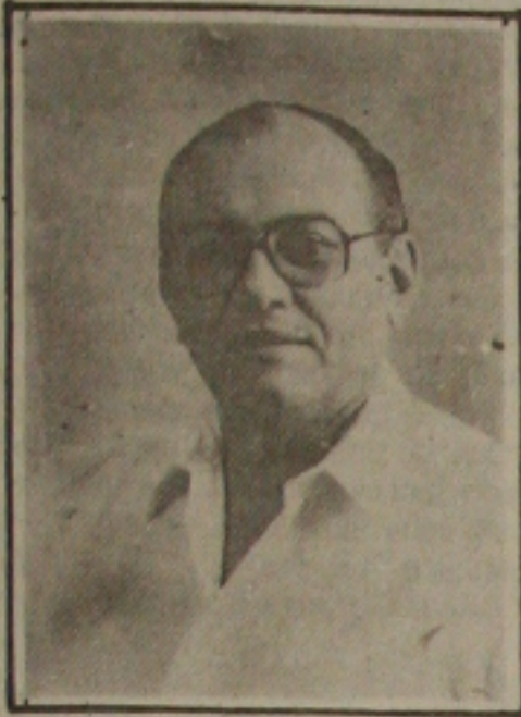
Teixeira afirmou que o "acórdão" passará democraticamente por uma discussão nas bases partidárias.