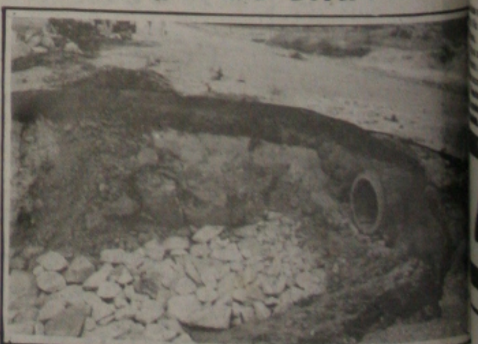
Erosão interdita a Rodovia José Sarney.

Para recuperar a pista o DER não contratou nenhuma firma. Todos os 15 homens que estão desenvolvendo as atividades são funcionários do próprio órgão, inclusive todo o maquinário num total de seis caminhões, 1 carre-