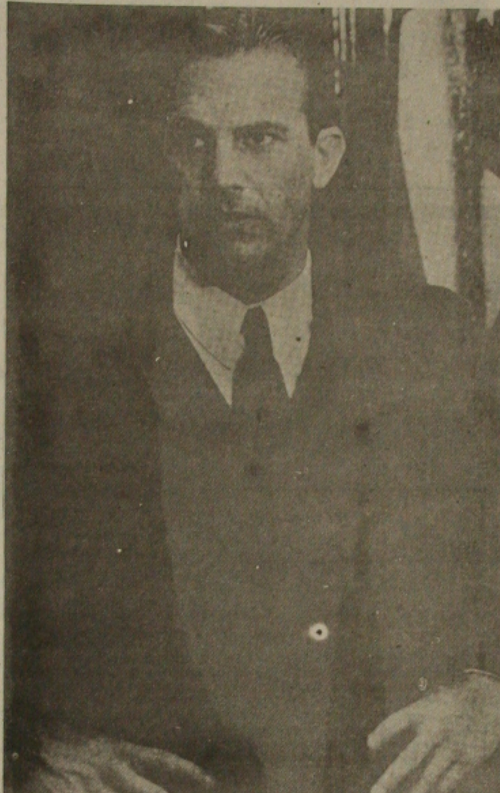
Kevin Costner está no Teste de Vídeo.

O programa vai cumprir o que prometeu e dar continuidade à promoção que vai dar uma permanente para os telespectadores do programa. A permanente dará a chance ao feliz sorteado de frequentar, inteiramente de graça, durante três meses, os cinemas da cadeia Art Filmes, contemplando telespectadores de Fortaleza, Recife, Salvador, Belo Horizonte e Rio de Janeiro. Assistindo ao programa, o cinéfilo vai saber como participar do concurso e então poderá botar banca e, é lógico, economizar o dinheiro do seu passatempo predileto.