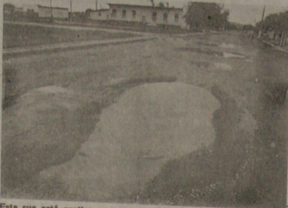
Esta rua está praticamente intransitável.