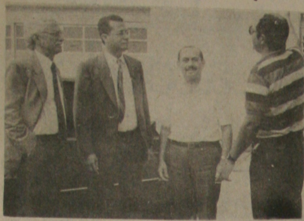
A colheita de lixo está irregular, no Conjunto Bugio