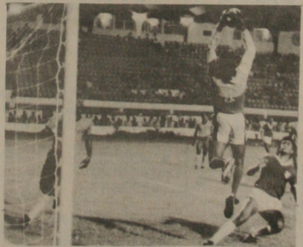
O Estanciano vem em busca de uma vitória no Batistão.