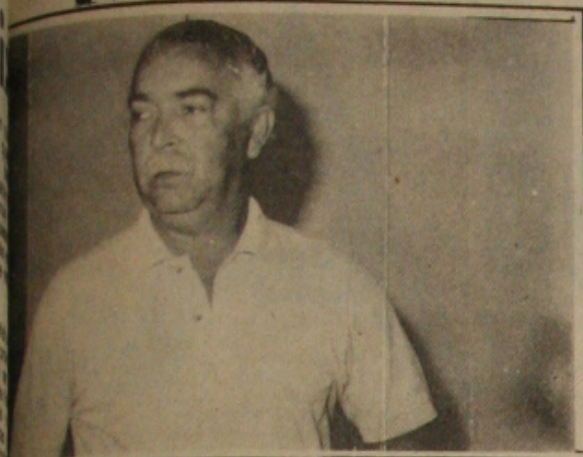
Integrantes de desonestos. A não ser que resolva se retratar publicamente.