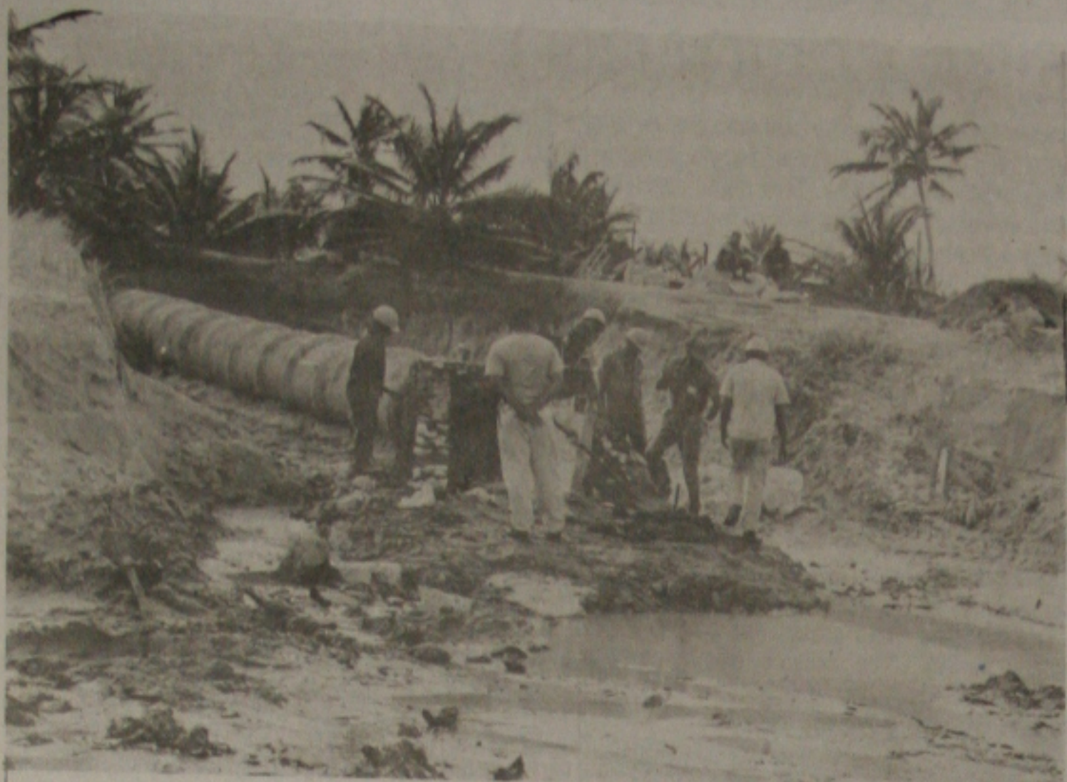
Trabalho de recuperação da pista José Sarney.