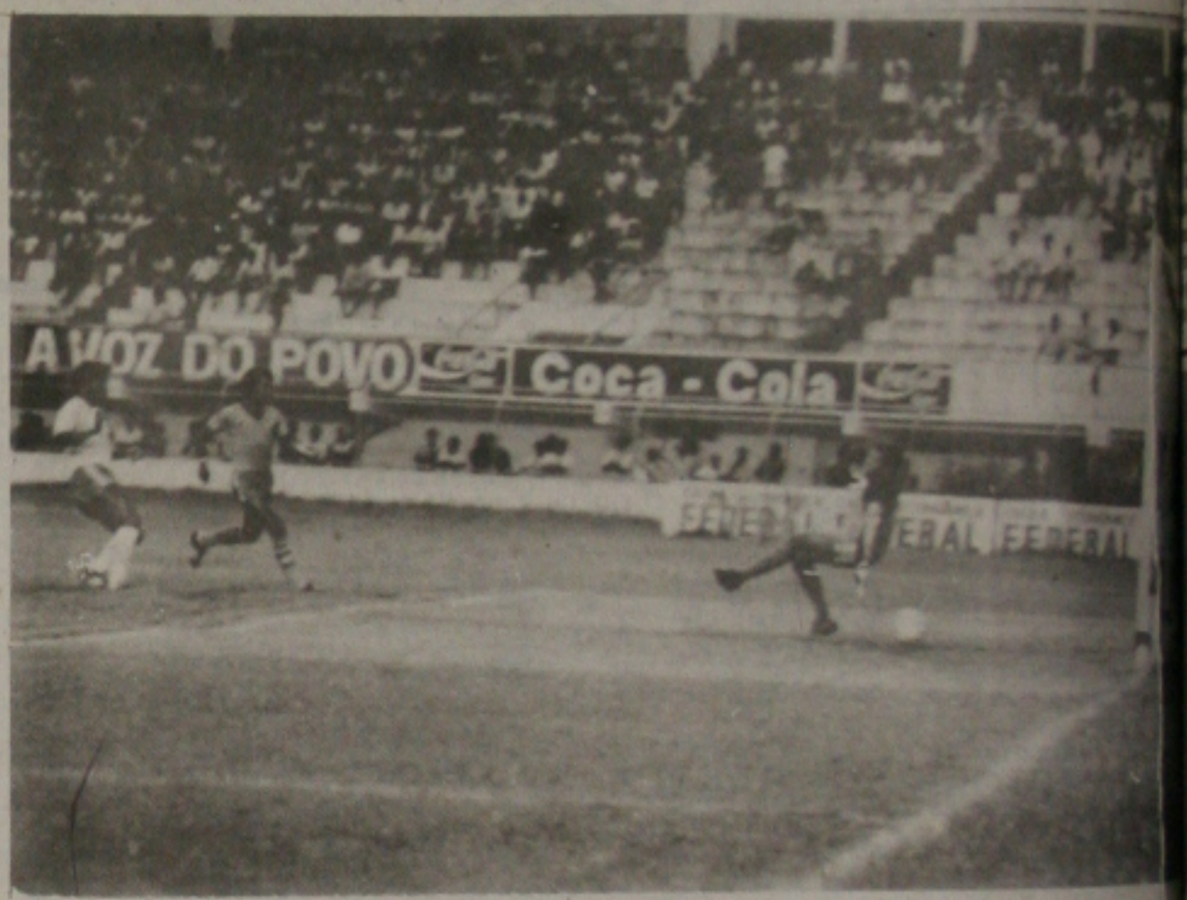
...E na saída de Márcio coloca a bola no canto esquerdo. Um bonito gol.