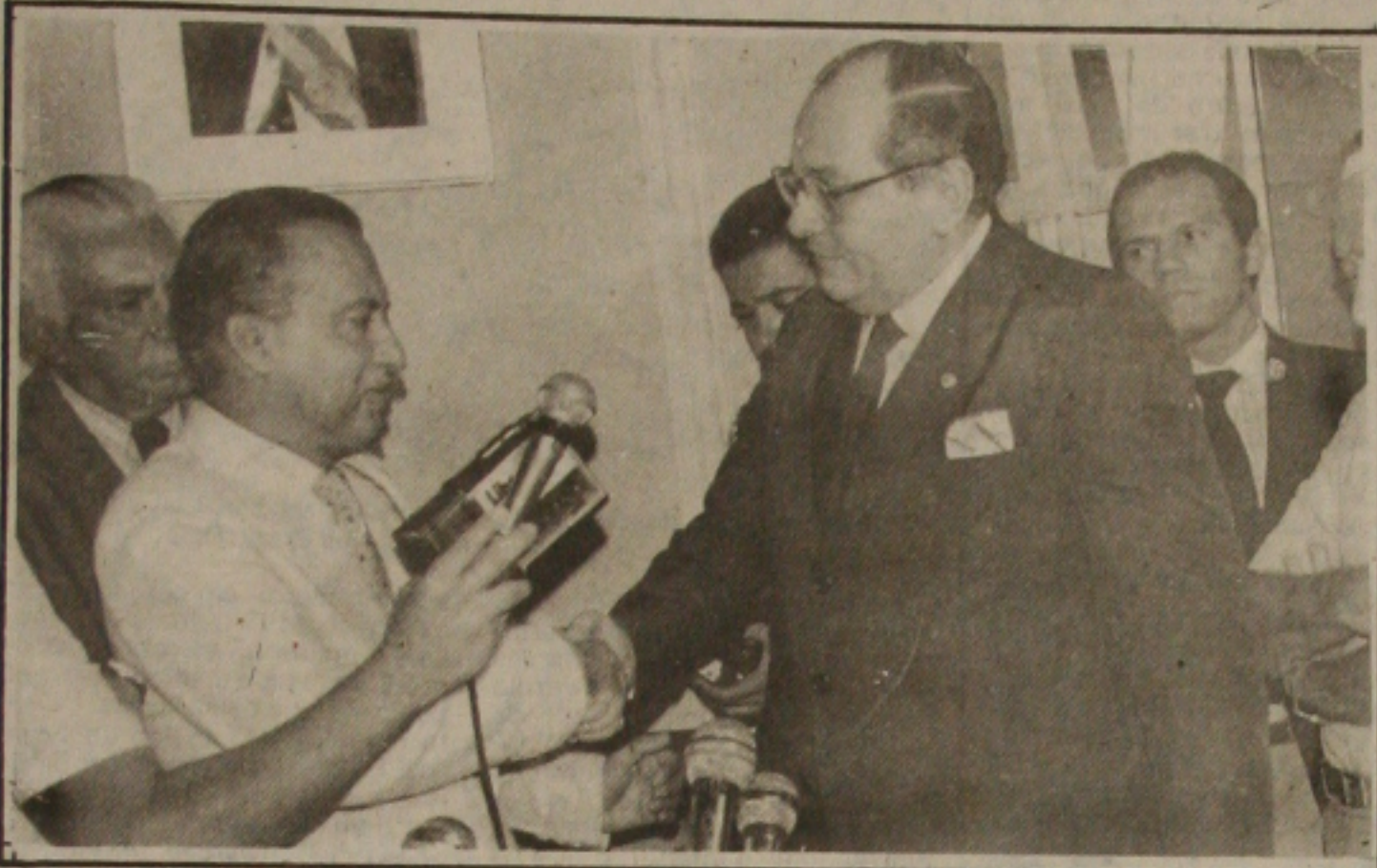
O cumprimento do Governador Valadares a Teixeira marcou o fechamento do acordo PFL e PMDB. (Página 5 e Informe GS).