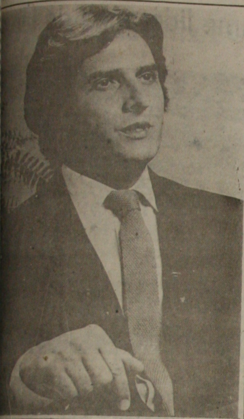
Governador Fernando Collor pede ajuda.

Maceió (AG) - Subiu para 59 o número de mortos e para 35 mil o de desabrigados, em Alagoas, em consequência das fortes chuvas que caem no Estado há uma semana. Uma ponte caiu na BR-316, a 50 Km de Maceió, e uma outra ameaçada de desabar na mesma rodovia. O Governo do Estado lançou ontem a campanha "Alagoas pede socorro" e abriu três contas para as doações em dinheiro: no Banco do Brasil (91.000/7) na Caixa Econômica (0840.003.700/7) e no Banco do Estado de Alagoas (404.550/6).