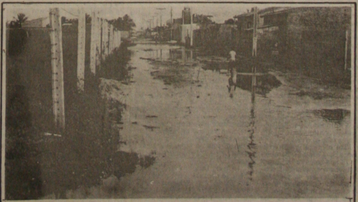
Mais de 400 casas já desabaram e duas mil pessoas estão desabrigadas no Interior do Estado. Em Aracaju os bairros da periferia estão inundados, como mostra a foto na Coroa do Meio. (As consequências das chuvas nas págs. 2 e 4).

Segundo familiares do menor, eles foram pressionados pelo Delegado Edson Trindade, para que não prestassem a queixa-crime no Juizado de Menores, e que chegou apresentar uma outra versão visando inocentar o policial. (Noticiário Policial na Pág. 08).