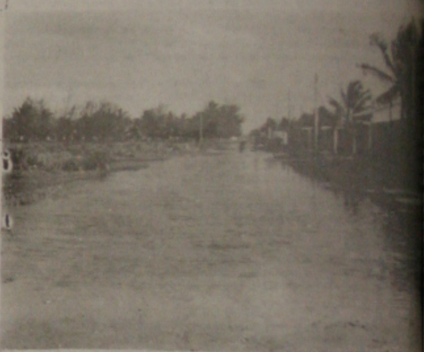
As ruas de acesso da Coroa do Melo estão totalmente alagadas.

A maioria das casas localizadas na Coroa do Melo estão ilhadas. Desta vez, tanto o rico como o pobre estão sofrendo com o mesmo problema, pois as casas bonitas, os apartamentos e os barracos dos invasores estão inundados, sem que a Prefeitura Municipal de Aracaju tome as devidas providências. Casos de meningite já foram constatados, em consequência do acúmulo de água dos esgotos.