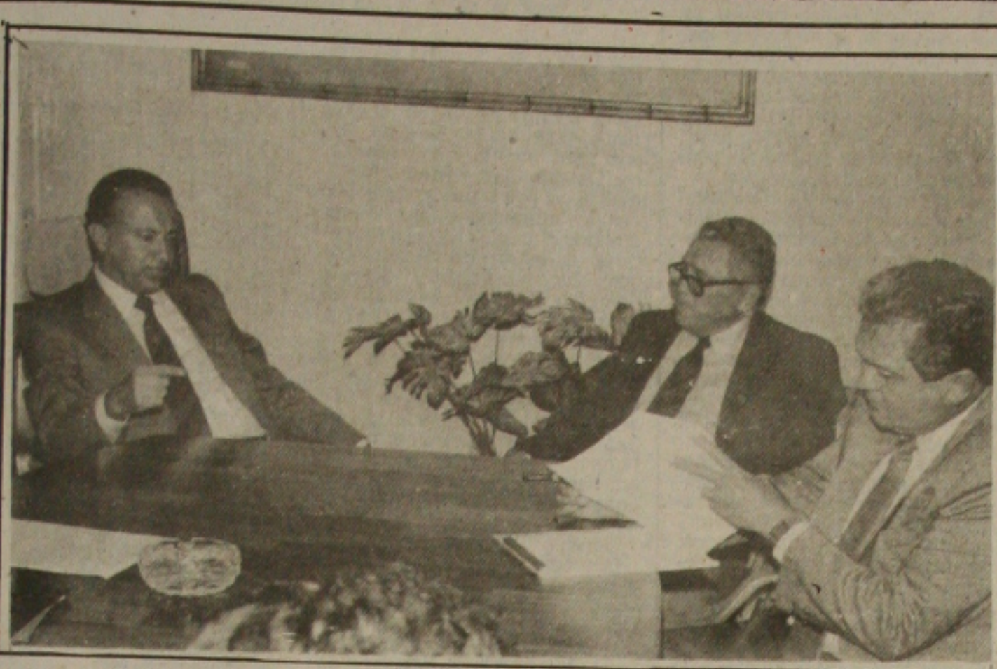
O Governador Valadares entregou ao Ministro Interino do Interior, Jaime Santiago, relatório sobre as chuvas caídas recentemente no Estado.

Aracaju - reajuste 1,05% Cz$ 219,49 Cz$ 220,59 Cz$ 314,00 17,88% Cz$ 1.598,26 Cz$ 1.788,0585 Cz$ 8.376,00 Cz$ 12.444,00