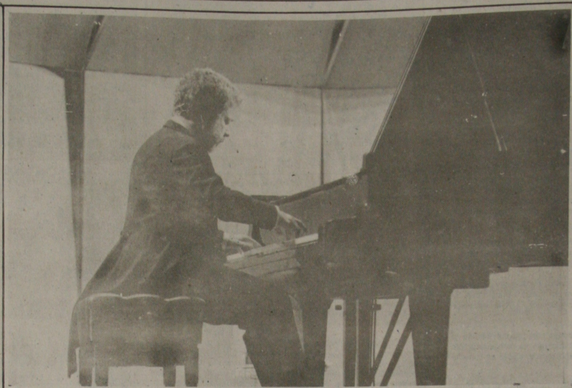
O pianista Nelson Freire em recital no Auditório de Campos do Jordão, dentro do Festival Carlton de Inverno. 8/7/88, 19horas.