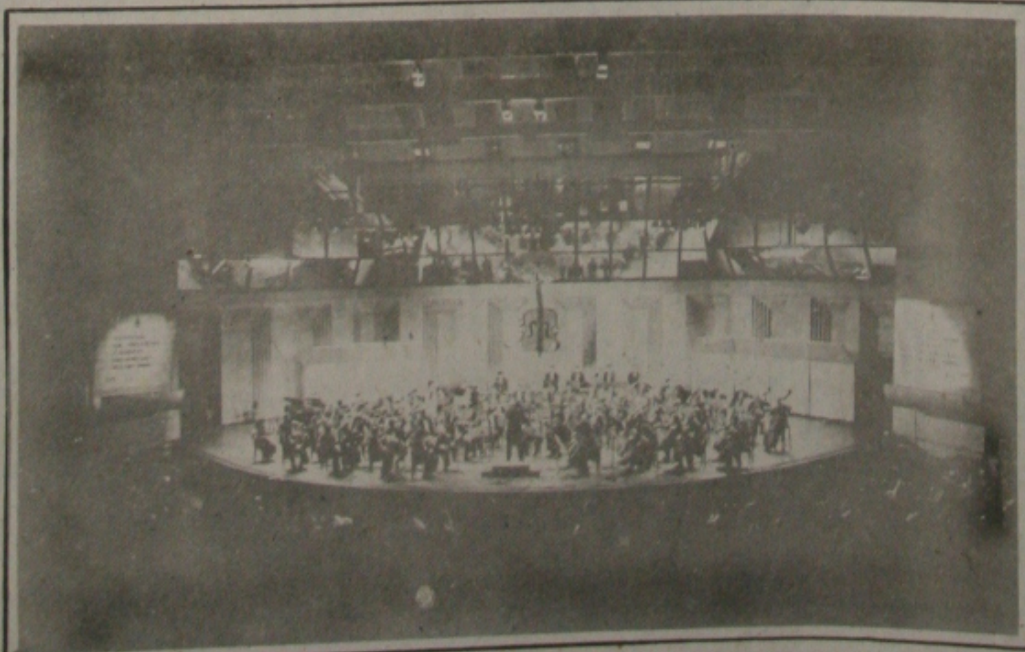
A Orquestra Sinfônica da Paraíba estréia no eixo Rio-São Paulo dentro do Festival Carlton de Inverno em Campos do Jordão, com um programa Mozart, Villa-Lobos e Prokofieff. Auditório, 9/7/88, 21h30.