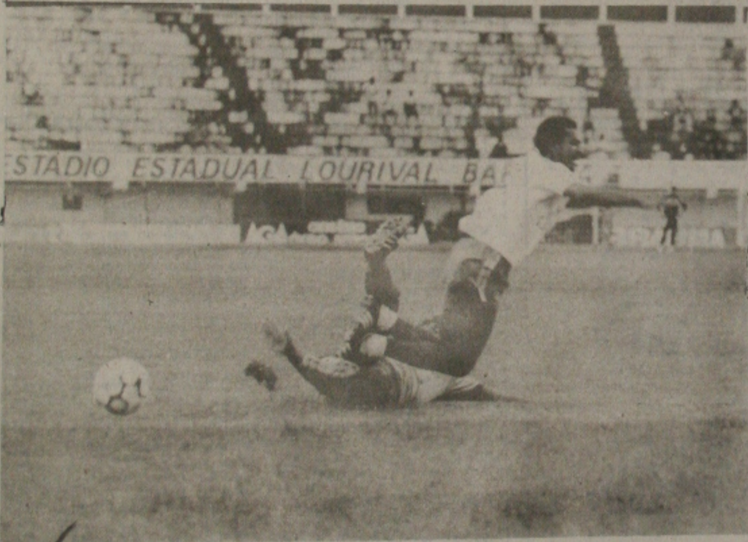
Aidalr pode perder a vaga de titular no Confiança.