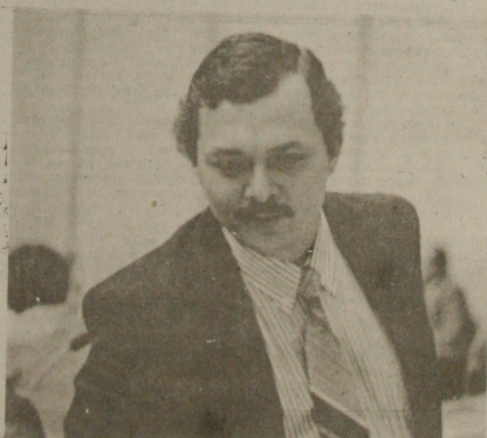
Machado pediu pressa aos candidatos na entrega dos documentos e acredita que o PFL vai

fazer mais de 50 prefeituras com apoio de Valadares.