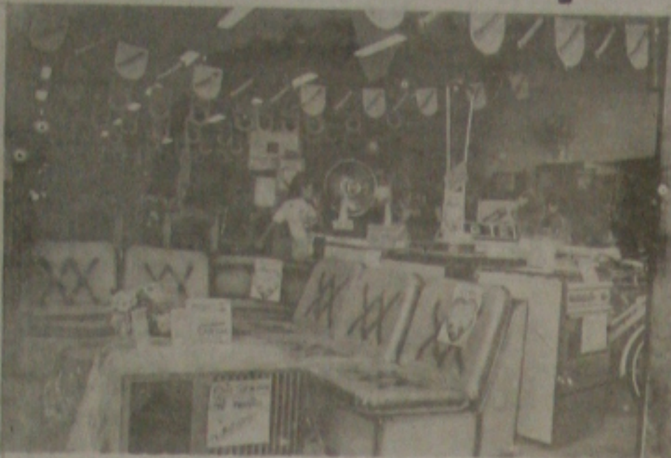
Caem as vendas de eletrodomésticos.

A aceleração da inflação a perda do poder aquisitivo e, às vezes, a "Usura" de determinados comerciantes são os principais motivos para a centuada queda verificada nos últimos dias no comércio de Aracaju, principalmente no ramo de roupas e eletrodomésticos.