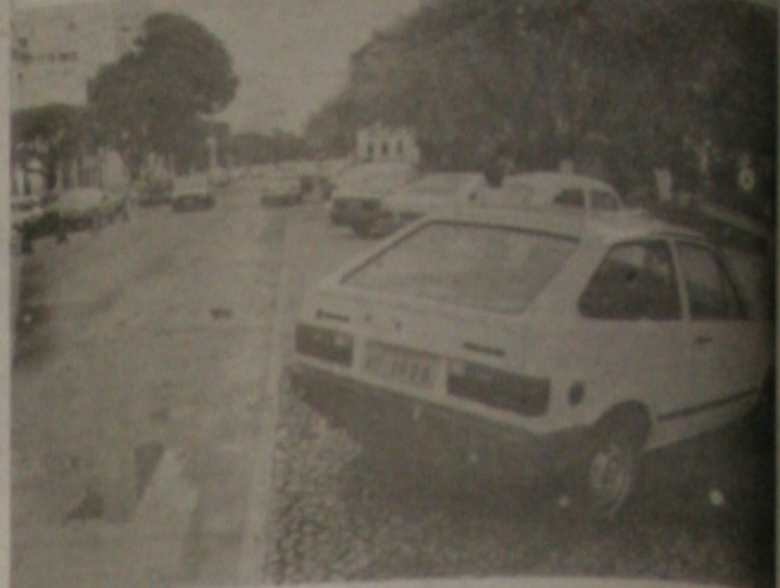
Apesar de já se ter como certa a elevação da multa mínima cobrada pelo DE-