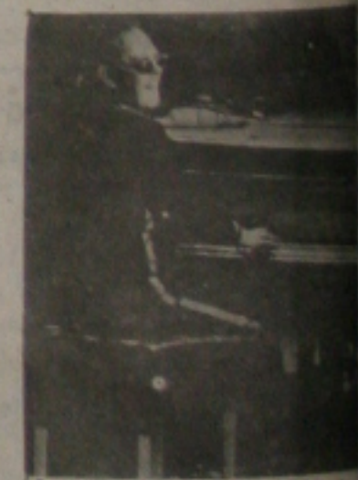
A consagrada ópera-rock Tommy.

1987 foi um ano marcante para Elton John: Depois de um imenso tour de 200 apresentações pelo mundo todo — que durou aproximadamente 16 meses —, Austrália. Nessa mesma ocasião, problemas na garganta levaram-no a suspender todas as apresentações marcadas