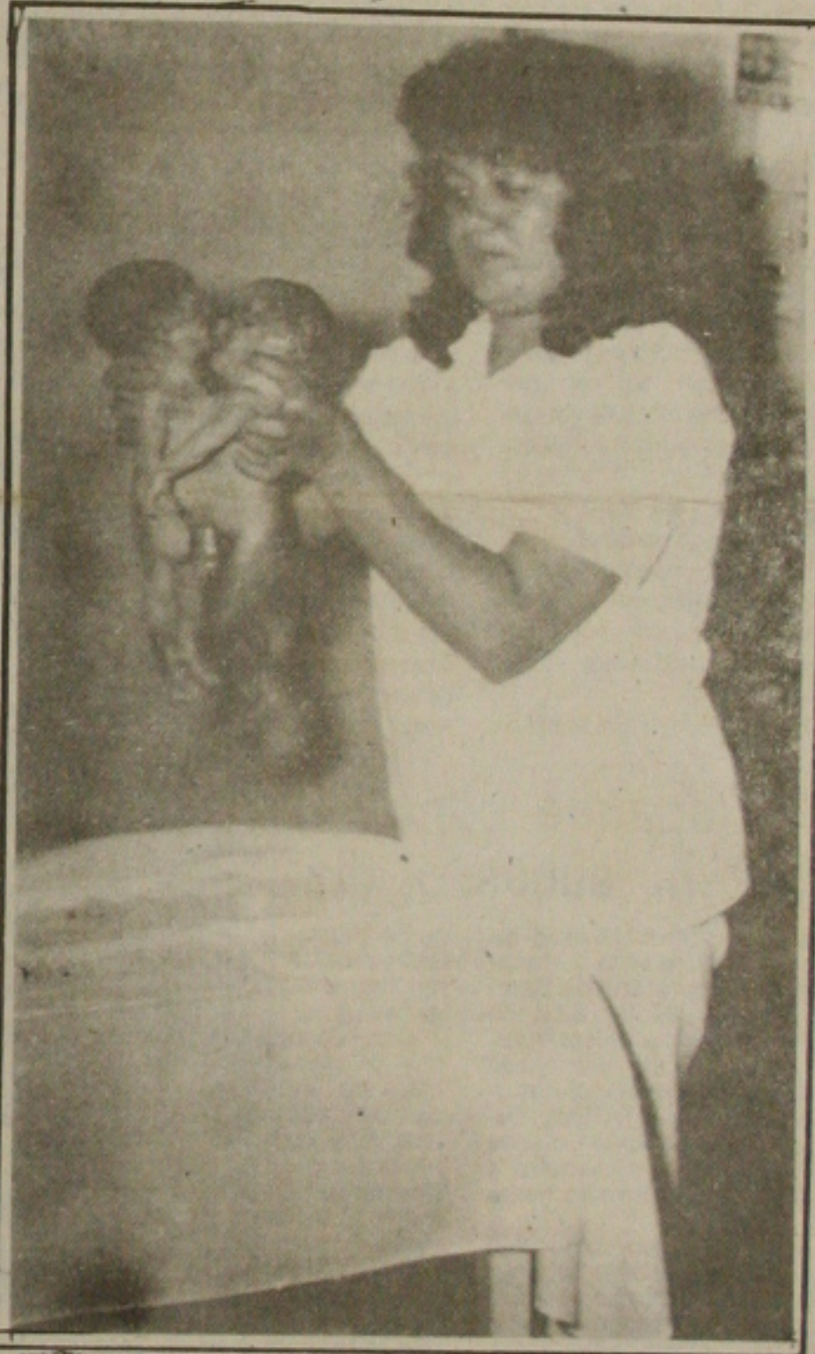
As duas crianças pré-maturas nasceram ligadas pelo tronco.

várias agências tiveram que ser fechadas por falta de dinheiro. A direção do Banese recorreu ao Banco do Brasil em Salvador e hoje excepcionalmente começa o expediente às 8 horas, para atender aos funcionários Públicos. (Pág. 4)