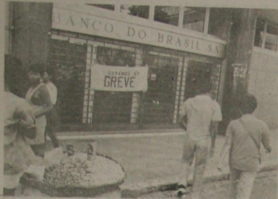
Banco do Brasil permaneceu fechado ontem.

Os bancos tanto da rede privada como da oficial estavam ameaçados de paralisar o atendimento ao público por falta de recursos que são liberados através do Banco do Brasil. Tudo isto em consequência da greve dos funcionários do BB que permaneceram paralisados no dia de ontem. Porém, o movimento nas demais agências bancárias da capital acabou ficando normalizado no dia de ontem porque os gerentes se preveniram solicitando recursos às tesourarias regionais em alguns casos, no Estado da Bahia, e em outros em Pernambuco, o que viabilizou a operacionalização.