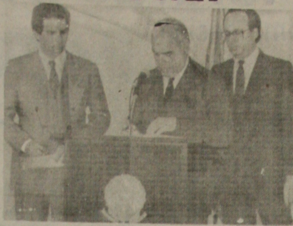
Presidente José Sarney empossa o Ministro Jader Barbalho na Previdência Social.