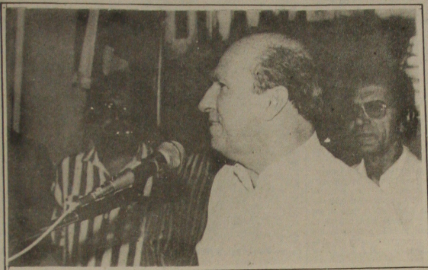
Maia acredita na vitória e promete fazer uma administração com seriedade e voltada para os interesses principais do arcajuano.