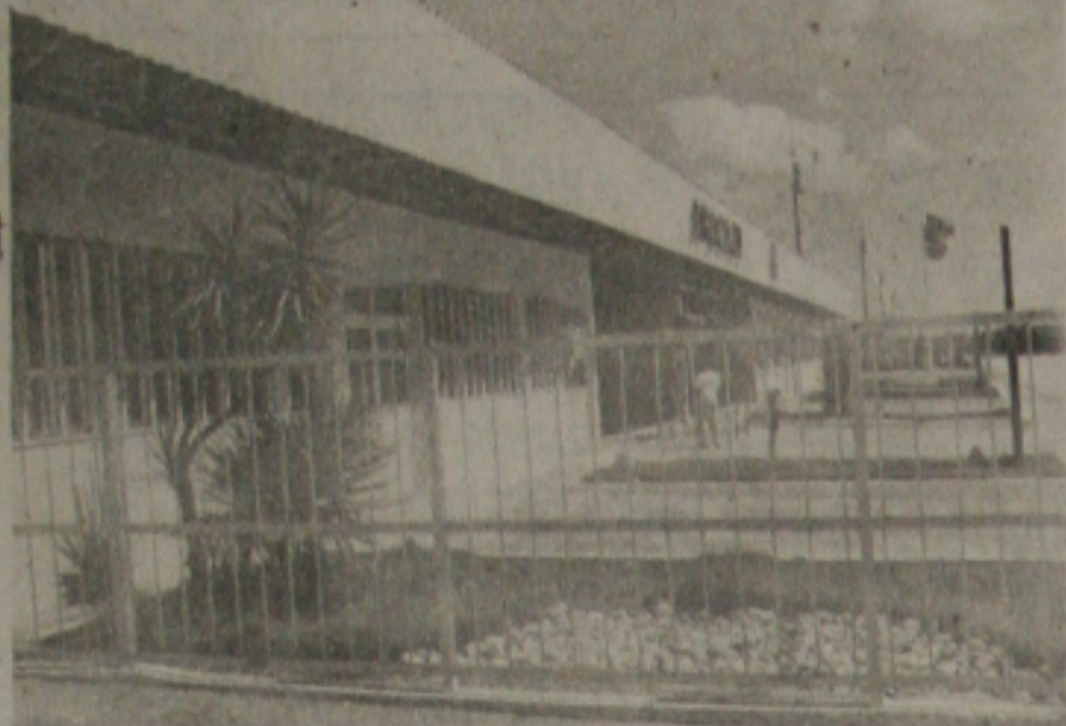
Aeroporto de Aracaju terá serviços de restaurante classe A.