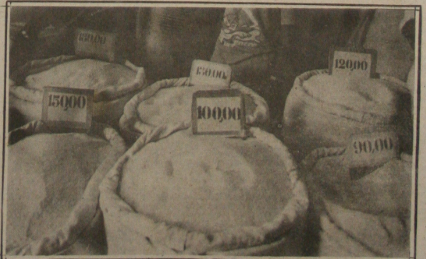
Com a disparada da inflação, os produtos alimentícios atingiram ontem nos mercados e feiras livres, preços insuportáveis. A população reclamou muito, mas teve que comprar farinha de até 150 cruzados o quilo e feijão de 100 cruzados, enquanto que o tomate chegou a ser vendido por 60 cruzados o quilo. (Pág.4)

ber a visita do Maruínense, no Presidente Médici. O jogo mais importante será mesmo no Batistão, onde se espera uma quebra de recorde de público e renda. (Esportes pag. 8)