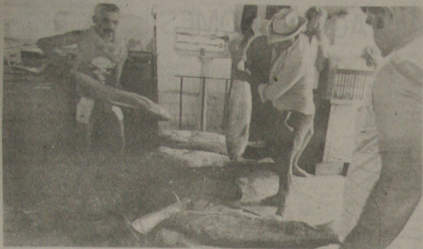
O peixe sofre constantes majorações no mercado municipal.

São constantes os reajustes de hortifrutigranjeiros, carne e peixe no Mercado Municipal Thales Ferraz. Há períodos que os preços são majorados semanalmente a exemplo do peixe de água doce e salgada, porém em outras etapas os preços ficam estabilizados durante 15 dias. Ontem, os preços não tiveram reajustes se comparado a semana passada. A carne bovina por exemplo custou durante o dia de ontem entre Cz$ 300 a 350 o quilograma. Porém quem estiver disponível para caminhar basta procurar diversas bancas no Mercado que encontrará os produtos com um preço inferior, dependendo também da qualidade do alimento. A batata inglesa variou entre Cz$ 60 e 70 cruzados, o tomate de Cz$ 60 a 90 poderia ser encontrado até por Cz$ 25 o quilograma, porém quem esti-