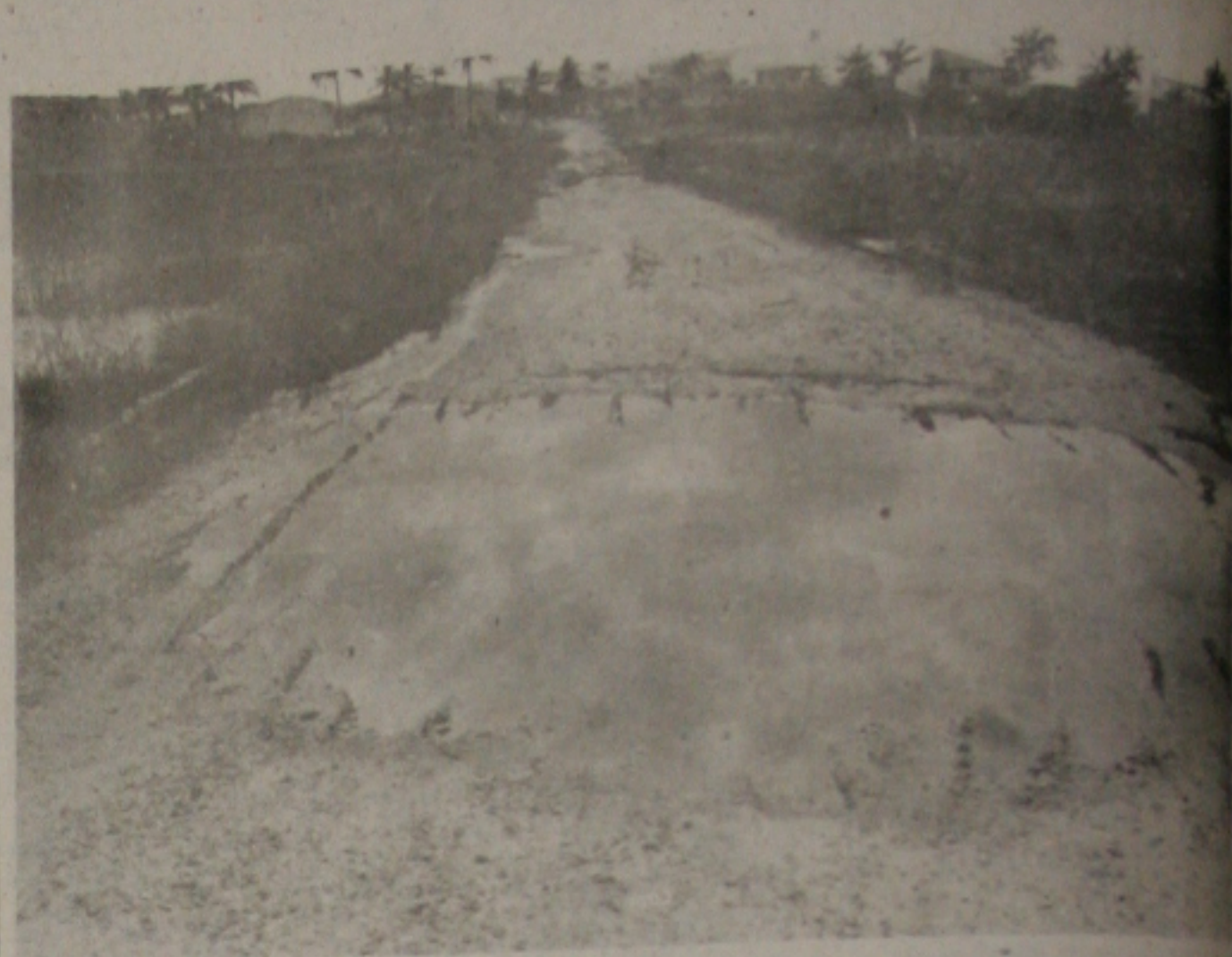
As ruas estão praticamente intransitáveis.

Esgotos a céu aberto, águas estagnadas, buracos, falta de iluminação, de saneamento básico e acúmulo de lixo são um dos problemas enfrentados diariamente pelos moradores do Loteamento Parque dos Coqueiros, localizado no Distrito Industrial. Providências já foram pedidas à Prefeitura Municipal de Aracaju, no sentido de que solução o problema, mas até o presente momento nenhuma atitude foi tomada.