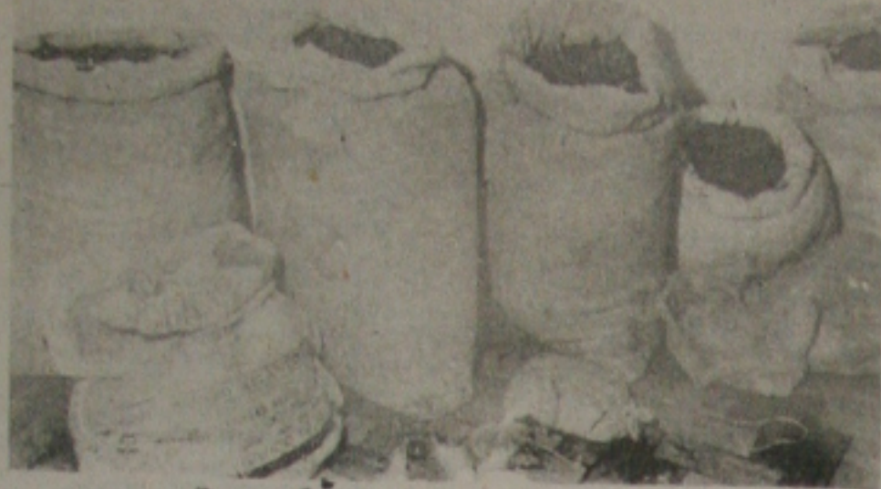
Maconha apreendida pela Polícia