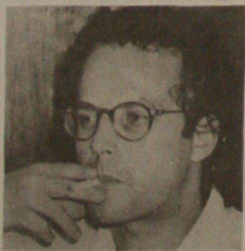
O diretor artístico Jaime Monjardim é o idealizador do programa Nas Ondas do Rádio.

serão reeditados pelo elenco de artistas que apresentarão Nas Ondas do Rádio, dando roupagem nova a uma iniciativa que já tinha lugar garantido nas programações radiofônicas das décadas de 30, 40, 50 e 60: os anúncios e textos publicitários.