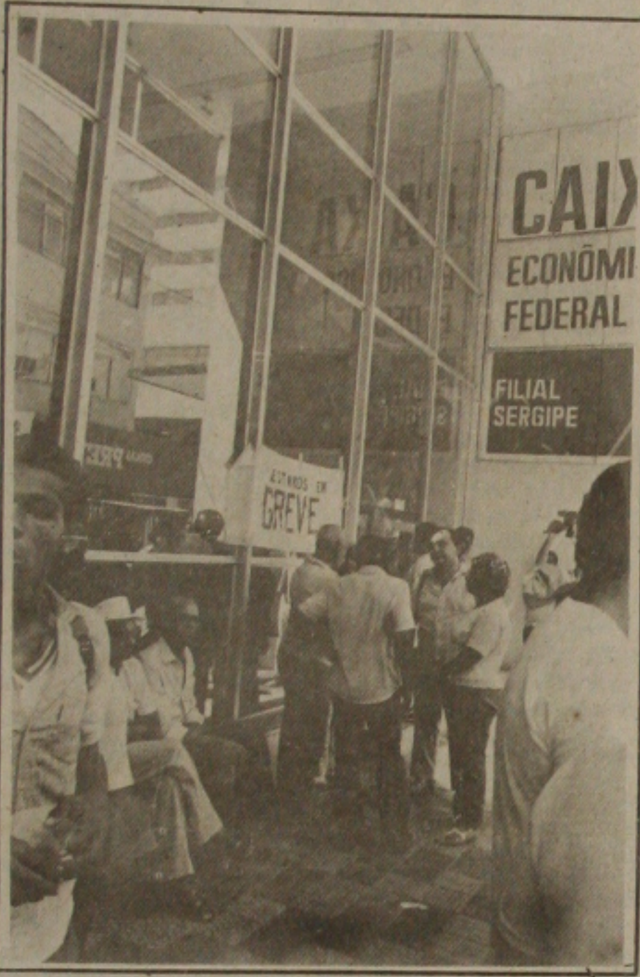
As agências da Caixa Econômica Federal voltam hoje a funcionar normalmente em Sergipe.