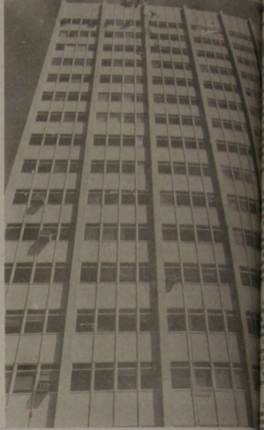
Prédio pertencente à Previdência Social de onde já caíram esquadrias de alguns andares, por falta de conservação.

Na última quinta-feira, dia 28, caíram duas pouco antes do meio dia. As esquadrias, segundo o servidor, que é agente de vigilância e tem presenciado a maioria das quedas, foram colocadas no prédio na época da construção e nunca foram trocadas. Ele garante já ter comunicado a administração, mas afirma que nada tem sido feito.