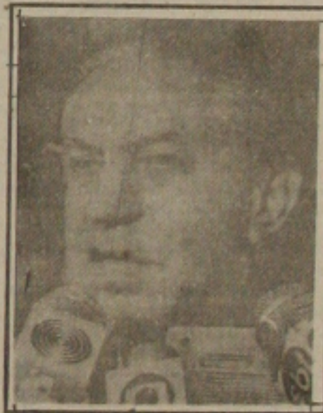
Ministro José Hugo Castelo Branco

Ao tomar conhecimento da morte do seu auxiliar, o Presidente José Sarney lamentou e imediatamente decretou luto oficial em todo País por três dias, assim como, determinou em acordo com os familiares de José Hugo, que o corpo fosse velado no Ministério da Justiça, como homenagem póstuma ao ilustre homem público, que há mais de dois anos estava submetendo a tratamento médico na tentativa de impedir a evolução do tumor, detectado em abril de 1986.