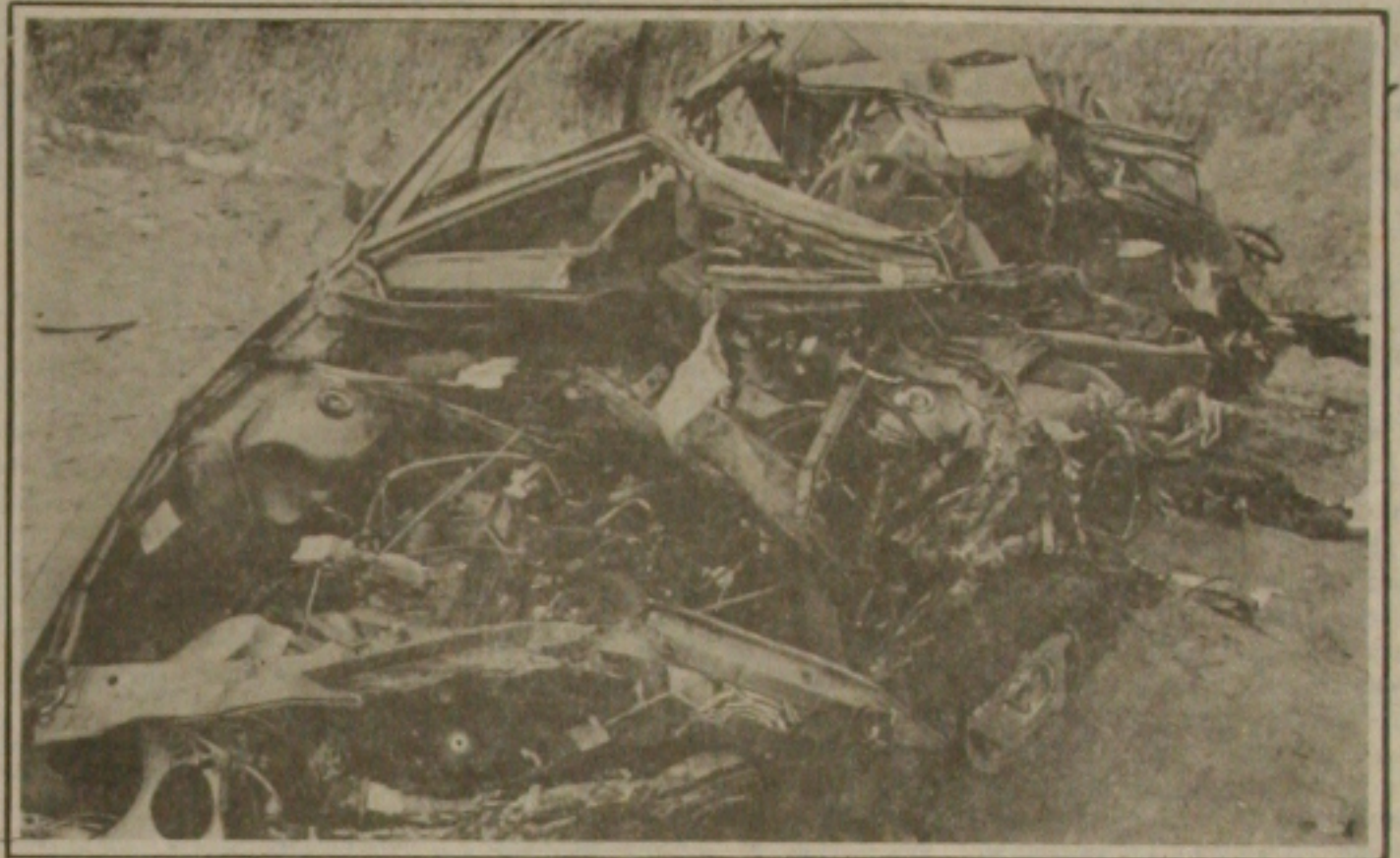
Após o violento choque com o caminhão, o santana ficou completamente destruído.

O veículo ficou completamente destruído, pois, além de bater de frente com o caminhão, foi atingido na traseira pelo Volkswagen Voyage, placa AT 3821 de Sergipe, que trafegava no mesmo sentido. (Noticiário Policial na Página 06).