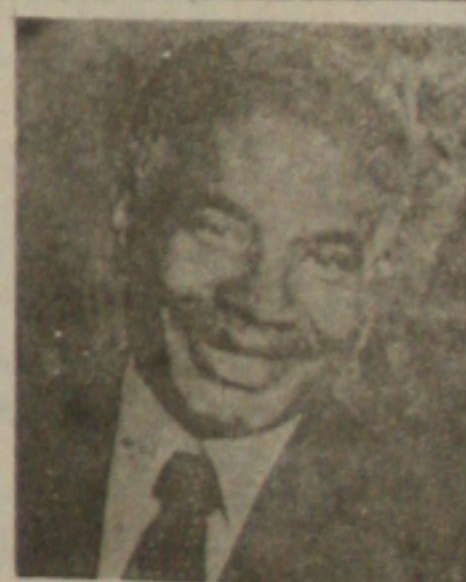
Cenas do filme Somos Todos Filhos de Deus.

07:00 H-Color bar com música 07:40 H-Programação educativa 07:55 H-Viva a vida 08:00 H-Repórter manchete 11:55 H-Minuto olímpico 12:00 H-Manchete esportiva 12:15 H-Repórter jornal 12:30 H-Jornal da manchete 13:00 H-Cinemania 14:00 H-Vesperal da sábado 16:00 H-Milk shake 18:00 H-Rock especial 18:55 H-Minuto olímpico 19:00 H-Manchete esportiva 19:10 H-Repórter jornal 19:30 H-Mania de querer 20:30 H-Jornal da manchete 21:30 H-Dona beija 22:25 H-Minuto olímpico 22:30 H-Sala vip