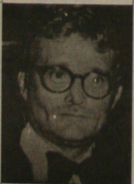
Bo Hopkins em A Barcaça Perdida.

The Runaway Barge-ano, 1975. Direção de Boris Sagal. Com Bo Hopkins, Tom Matheson, Jim Davis, Nick Nolte. Duração: 73 minutos. Dois rapazes ficam presos numa barcaça que carrega explosivos e que corre o risco de bater contra uma represa a qualquer momento. Sábado-13/08-14:00h.