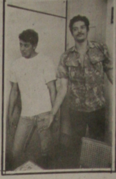
"Bolaço" e "Sorria" presos como cúmplices do duplo homicídio.