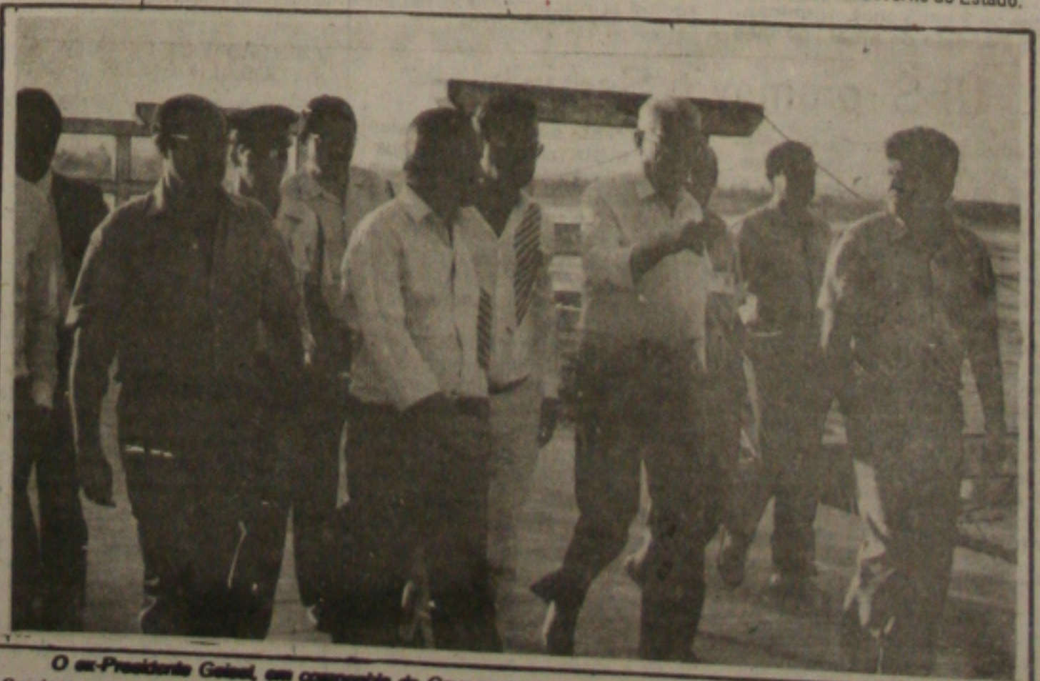
O ex-Presidente Geisel, em companhia do Governador Valadares, visitou ontem o canteiro de obras do Porto de Sergipe.

Ele contudo, considera inviável o comprimento do organograma de obras da Hidroelétrica de Xingó para 1992, sua conclusão. "O nosso esforço agora é atrair agora o apoio das grandes empresas e lutar, em seguida, para que as obras sejam concluídas em 1993", enfatizou o Presidente da Chesf. (Pág. 4)