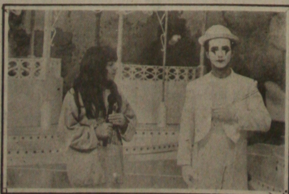
"Charlito" um dos personagens