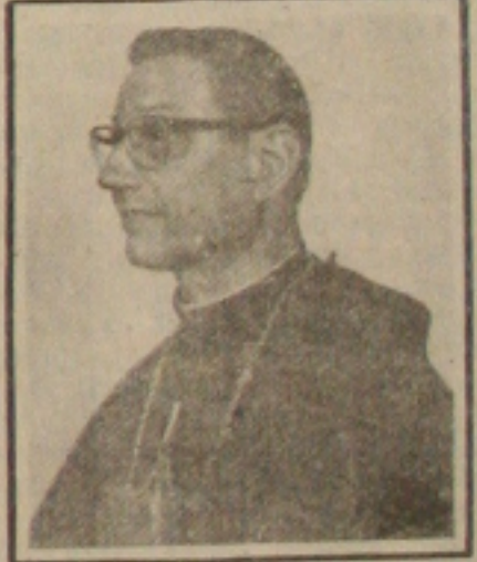
Dom João Messi, Bispo Auxiliar

Será no próximo domingo, dia 11, às 9 horas, na Catedral Metropolitana, a solenidade de posse do novo Bispo Auxiliar da Arquidiocese de Aracaju, o Bispo italiano, Dom João Messi, que chegará a Sergipe, nesta quinta-feira, desembarcando no Aeroporto de Aracaju, às 13:30 horas, procedente de São Paulo. Para a solenidade de posse, que acontecerá durante a missa dominical na Catedral Metropolitana, o Arcebispo Dom Luciano Cabral Duarte, está convidando todo Clero, as religiosas, os membros de todas as associações religiosas, dos movimentos dos leigos e, em geral, todos os católicos para participarem e a todos pede suas fervorosas orações pelo êxito dos trabalhos pastorais do novo Bispo Auxiliar entre nós.