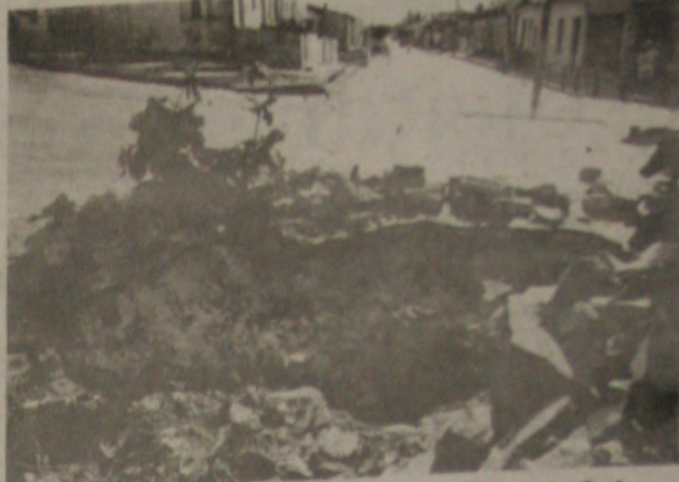
Moradores pleiteiam restauração de rua.