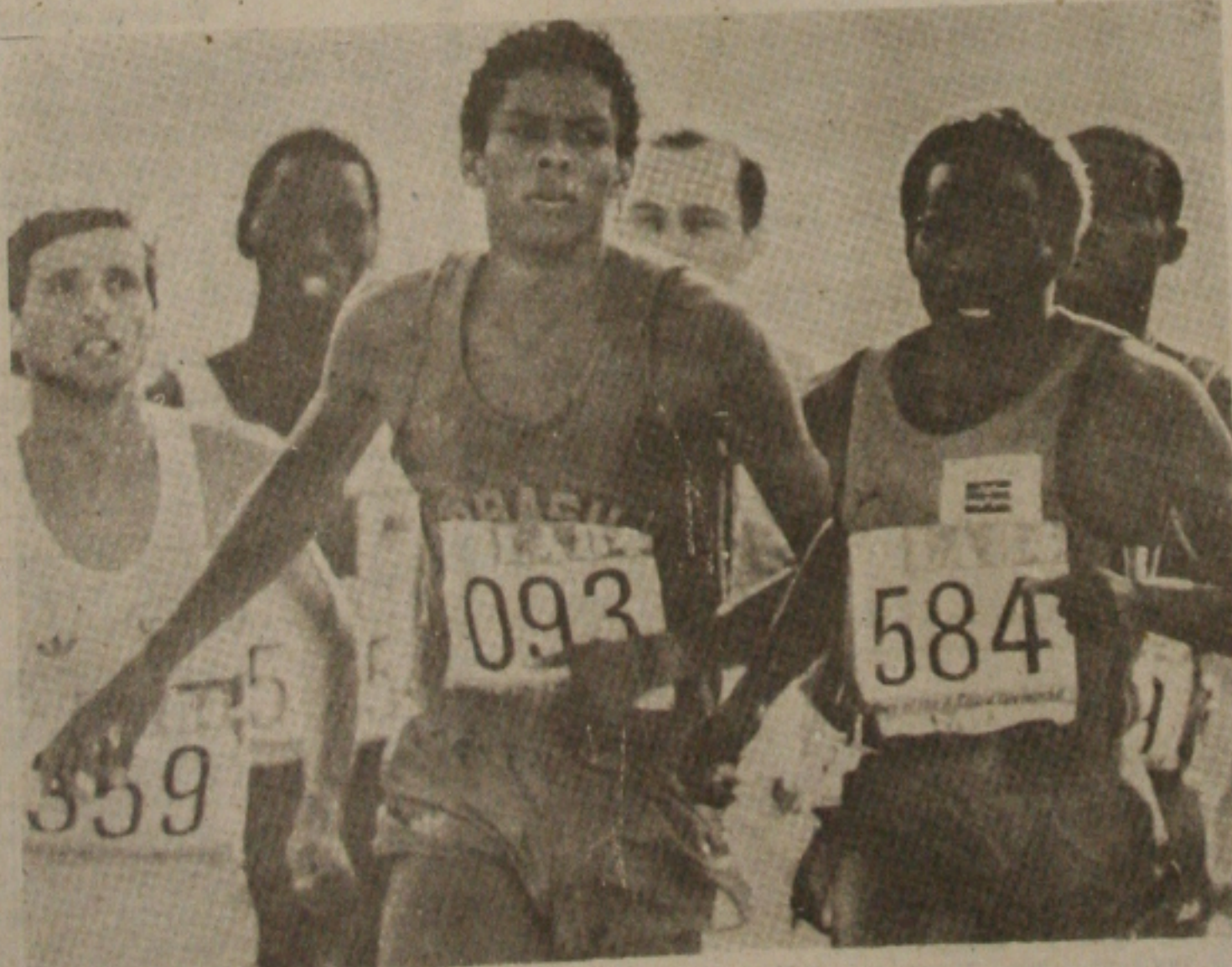
Nossos atletas e as competições.

Com o desfile de atletas de vários países, um recorde na história das Olimpíadas, a festa será realizada no Estádio Olímpico de linhas arquitetônicas modernas e os desenhos de antigos coreanos, que levou sete meses para ser construído e tem capacidade para abrigar 100 mil pessoas. Os desfiles de abertura realizados em Londres, nas Olimpíadas de 1908 e, numa homenagem especial, a delegação da Grécia sempre abre esta festa. Também cabe a um atleta grego a primeira parte do revezamento que conduz a chama Olímpica de sua terra natal até o local da competição, ficando com um atleta do país que participa dos Jogos a tarefa de acender a pira Olímpica.