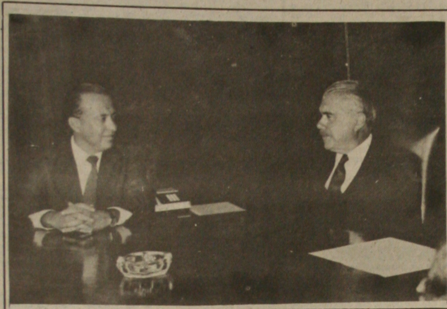
Na audiência que manteve com o Presidente José Sarney, o Governador Valadares conseguiu recursos a fundo perdido para Sergipe.

Os funcionários do Hospital João Alves Filho decidiram que não vão permanecer em greve por tempo indeterminado, rejeitando a contra-proposta aprovada na reunião que aconteceu ontem entre o Secretário do Trabalho, Secretário da Saúde, Presidente da Fundação Hospitalar, advogado da CUT e representantes dos servidores.