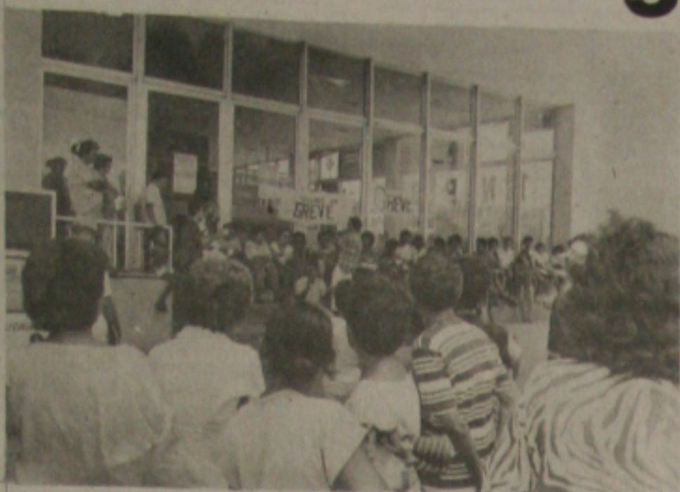
Previdenciários entraram em greve.

Preenchimento de carnês do IAPAS; marcação de consultas; exames; farmácia do INPS; inscrições de beneficiários; e outros serviços prestados pelos previdenciários do IAPAS, INAMPS e INPS estão suspensos por tempo indeterminado, desde o dia de ontem, quando iniciou o movimento paralisando a nível nacional. A categoria reivindica correção, atualização e incorporação dos 100%; adiantamento do PCCS (197% de reposição); pagamento imediato das URPs confiscadas; piso igual ao mínimo calculado pelo DIEESE; reajuste mensal de acordo com o índice do DIEESE; regularização da jornada de seis horas diárias de trabalho; reversão das punições de grevistas de outros movimentos; isonomia salarial com o pessoal do Ministério da Saúde; e outros benefícios.