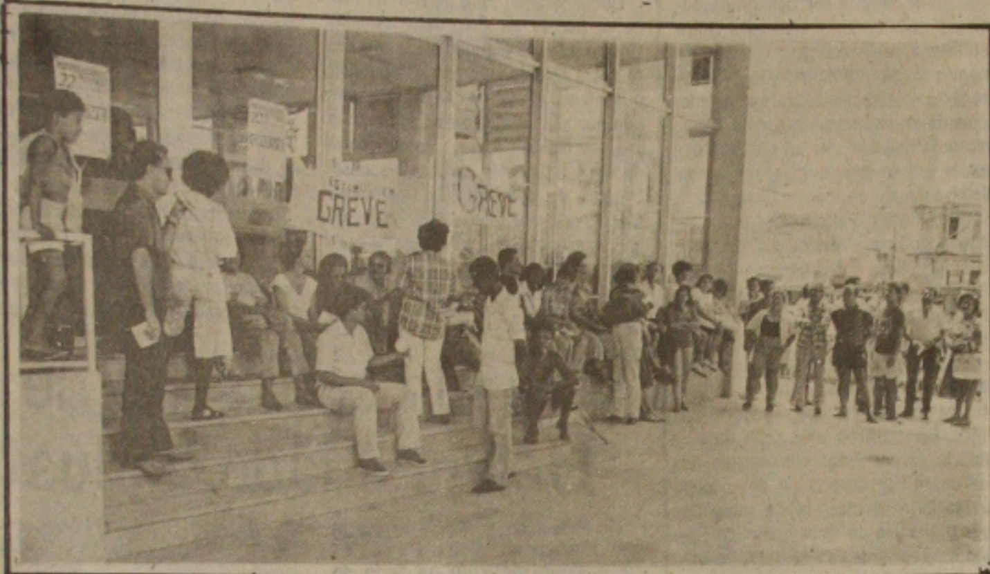
Na porta do Edifício da Previdência, os grevistas concentraram a mobilização pela greve geral.