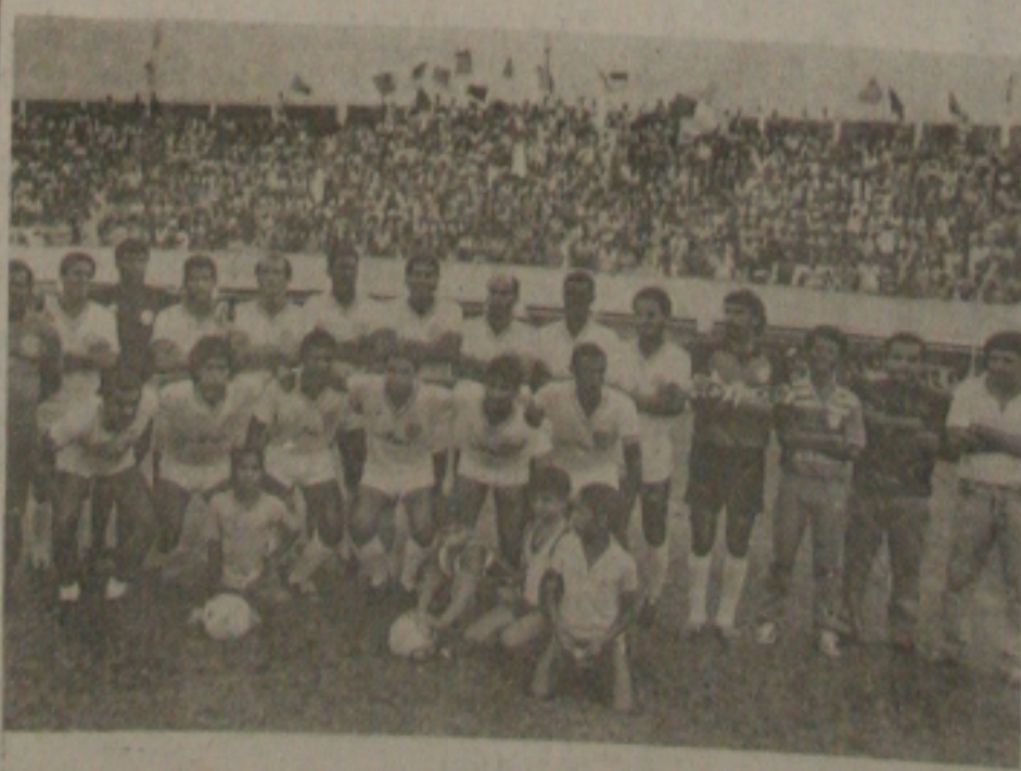
Os campeões de 88 receberão rão a grande conquista.