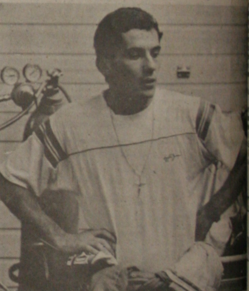
Senna começa a treinar para o Grande Prêmio da Espanha.

Começam hoje, em Jerez de La Frontera, os treinos oficiais para o GP da Espanha, a antepenúltima etapa do Campeonato Mundial de Pilotos de Fórmula 1, que promete ser uma das provas mais emocionantes da temporada. Não só pelas características do circuito espanhol, que tem pouquíssimos pontos de ultrapassagem em seus 4.128 metros, mas principalmente por causa da acirrada disputa entre Ayrton e Alain Prost pelo título.