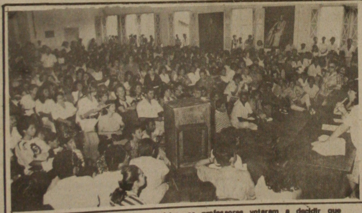
Na assembleia geral no Instituto Histórico, os professores votaram a decidir que vão permanecer em greve até a audiência com o Governador.