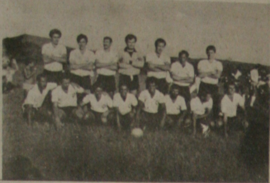
CORINTIAS DE APARECIDA

Ai está o time de futebol do Corintias da cidade de Nossa Senhora Aparecida que continua invicto em seus