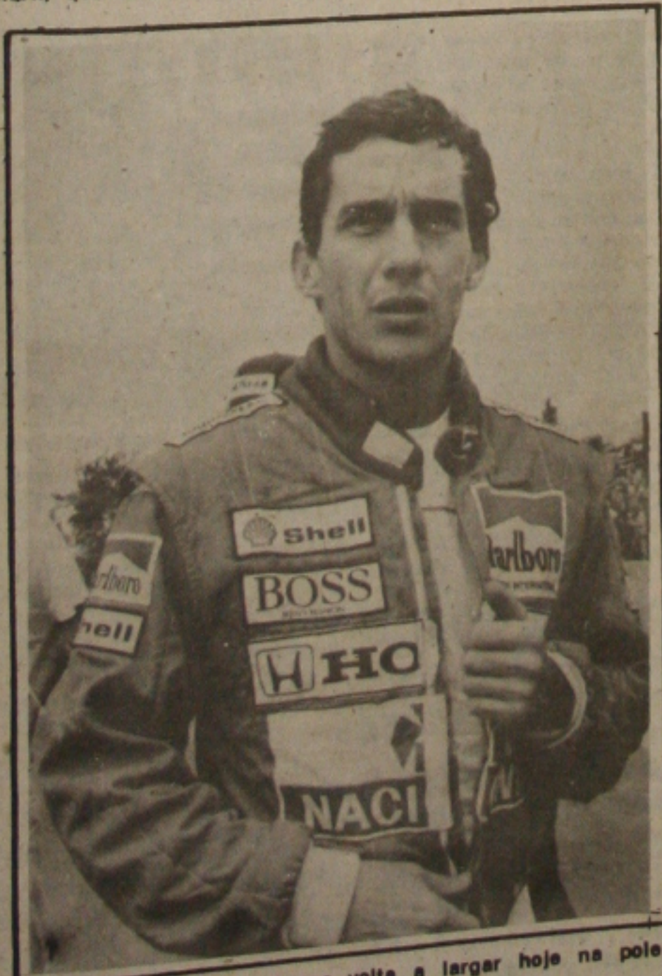
O brasileiro Ayrton Senna, volta a largar hoje na pole, mas reconhece que vai ser uma corrida difícil.

mente, 28 e 33 pole-positions em suas carreiras. O companheiro de Senna na equipe Honda/Marlboro /McLaren, Alain Prost, vai largar em segundo lugar. O clima mais frio e a maior quantidade de borracha grudada no asfalto contribuíram para que os 30 pilotos que participaram das duas sessões de treinos melhorassem seus tempos. Nelson Piquet, por exemplo, passou de décimo quarto para nono enquanto Mauricio Gugelmin caiu de sétimo para décimo primeiro, mesmo tendo feito sua melhor volta quase 1 segundo mais rápida que a marca conseguida ante-ontem.