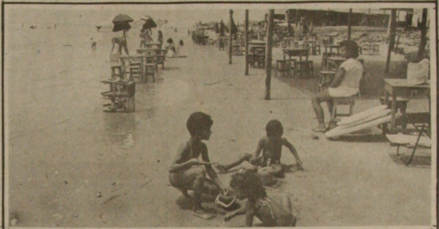
Desavisadas sobre os riscos a que estão expostas, as crianças brincam inocentemente nas areias da Praia da Coroa do Melo que está interdita.

e além do carro e propósito da Prefeitura sortear também diversos brindes, como televisores e eletrodomésticos. A nova caminhada da primavera, deverá acontecer até antes do dia 15 de novembro e a exemplo da anterior vai ter a participação do Governador do Estado, Antônio Carlos Valadares, do próprio Prefeito Viana de Assis, além de ocupantes de cargos das administrações estadual e municipal, e logicamente também dos candidatos da Aliança Democrática, o que vai transformar a caminhada numa grande passeata política da Aliança, a exemplo do que aconteceu no último domingo.