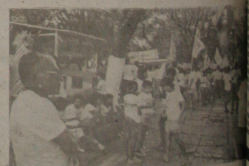
XIV Feira da Bondade

No dia de hoje, a Feira começa mais cedo, ou seja, às 16 horas, quando haverá apresentações de conjuntos musicais e de artistas da terra devendo