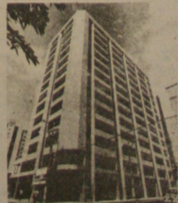
Vendas no local: Pacatuba com Estância.

O dinheiro que você daria pra poupança, você investe na instalação do seu novo escritório. No Edifício Paulo Figueiredo. Salas, lojas e mais um restaurante panorâmico, tudo pronto, esperando profissionais como você. O Edifício Paulo Figueiredo está no centro da cidade, em área de alto índice de valorização. Será, em pouco tempo, o centro dos profissionais mais bem sucedidos de Aracaju. O financiamento total facilita a vida de quem está começando ou de quem já está consolidado na carreira. Poucos pelo novo escritório, você tem condições de investir mais no seu próprio negócio.