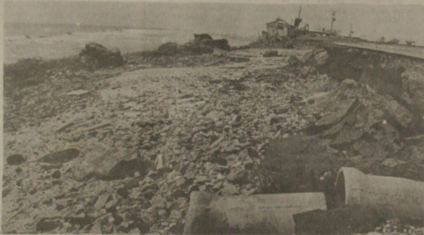
Polluição é o grande problema das praias de Aracaju.

Apesar da ADEMA ter interditado 7 das 14 praias existentes em Aracaju, pelo fato delas apresentarem altos índices de poluição e estarem provocando o aumento de casos de dermatite, gastroenterite e febre tifóide nos banhistas, ainda é grande o número de pessoas que não sabem que as praias Treze de Julho, Coroa do Meio, Bairro Industrial, Marinas, Barra dos Coqueiros, Enceada do Rio Poxim e Praia do Siri estão condenadas, tendo em vista que, era grande a quantidade de pessoas que tomavam banho na Coroa do Meio no dia de ontem.