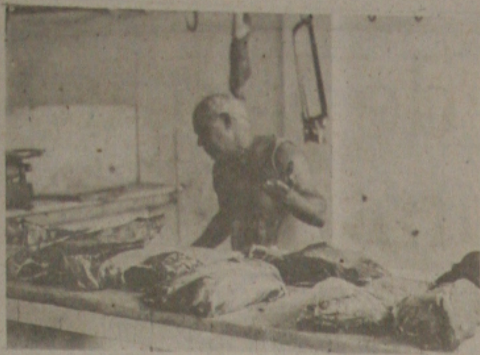
Cal e consumo de carne em Aracaju.

Desde a última sexta-feira que o consumidor aracajuano está pagando 13 por cento mais caro pela carne de primeira que passou de 800 cruzados o quilo para 900 cruzados. Com isso, tem calado bastante o consumo de carne, tendo em vista que, a população está substituindo o produto por verduras, omeletes, ovos e sardinhas.